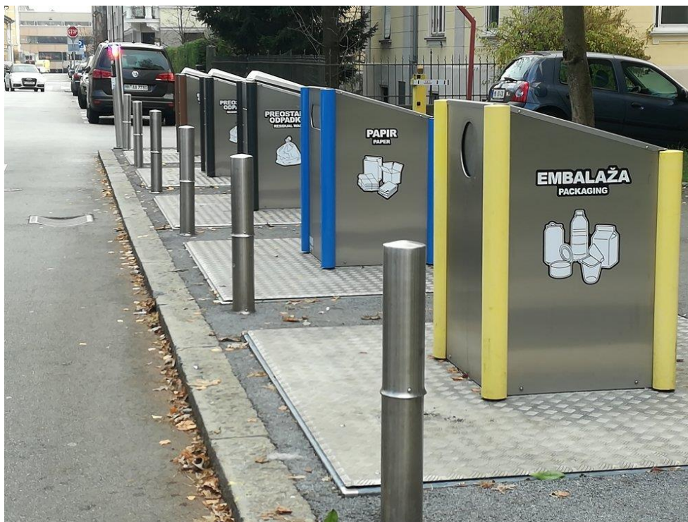
Slika 7. Podzemni spremnici za odlaganje komunalnog otpada

Važno je istaknuti kako je Ljubljana započela s odvojenim sakupljanjem otpada još 2002. godine. U 2006. godini javno poduzeće Snaga, ujedno i najveća tvrtka za upravljanje otpadom u Sloveniji, započela je s prikupljanjem biootpada na kućnom pragu za sva kućanstva, a čak 82% ih je bilo uključeno. Ciljevi grada Ljubljane do 2025. godine su sljedeći: