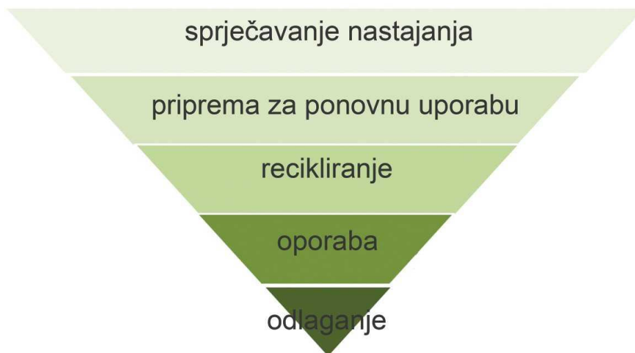
Slika 2. Hijerarhija gospodarenja otpadom

Odlaganje otpada na odlagalištima podrazumijeva svako djelovanje koje nije oporaba, čak i u slučaju u kojem tijekom postupka dolazi do sekundarnih posljedica u obliku obnavljanja tvari ili energije (Tišma, Boromisa, Funduk, Čermak, 2017).