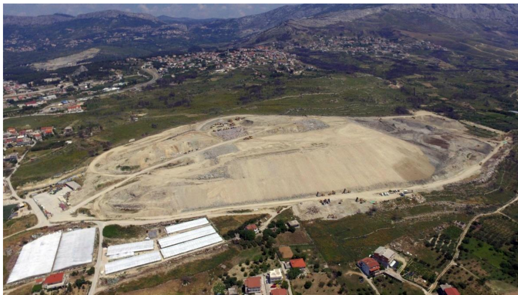
Slika 6. Odlagalište otpada Karepovac - Split

Plan gospodarenja otpadom grada Splita za razdoblje 2016 do 2022. godine predstavlja temeljni dokument koji će poslužiti kao osnova za uvođenje cjelovitog sustava gospodarenja otpadom u administrativnim granicama grada Splita. Svrha ovog plana je definirati okvir za održivo gospodarenje otpadom koje obuhvaća skup aktivnosti, odluka i mjera usmjerenih na sprječavanje nastanka otpada, smanjivanja količine otpada, provedbu sakupljanja, prijevoza, uporabe, zbrinjavanja i drugih aktivnosti vezanih za otpad, nadzor nad obavljanjem tih djelatnosti kao i skrb za postojeća i divlja odlagališta otpada.