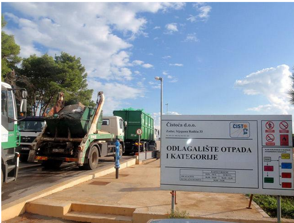
Slika 5. Odlagalište otpada Diklo – Zadar

Odlagalište neopasnog otpada “Diklo” službeno je odlagalište grada Zadra. Odlaganje otpada na toj lokaciji započelo je još 1963. Godine, a dana odlagalište zauzima površinu oko 60,33 ha. Cjelokupan komunalni otpad s područja grada Zadra odlaže se na odlagališta otpada Diklo i sigurno je da će se takva praksa nastaviti sve do izgradnje županijskog centra za gospodarenje otpadom koje je predviđeno za izgradnju u Biljanima Donjim. Na području grada Zadra uključujući i otoke u administrativnom sustavu grada ( Silba, Molat, Olib, Ist, Iž, Rava, Premuda) usluge odvoza i odlaganja komunalnog otpada obavlja Čistoća d.o.o Zadar. Na odlagalište Diklo svakodnevno se odlaže otpad iz grada Nina, općina Privlaka, Vrsi, Ražanac, Posedarje, Poličnik, Galovac, Zemunik Donji, Sukošan, Novigrad i Škabrnja, te otoka koji administrativno pripadaju gradu Zadu.