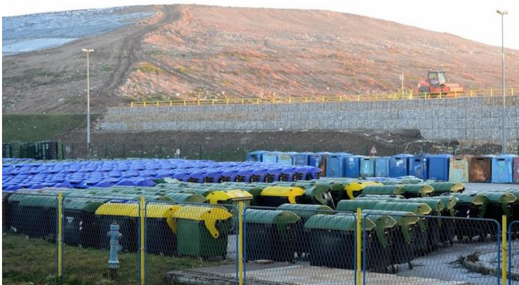
Slika 4. Odlagalište otpada Prudinec - Jakuševac

Planom gospodarenja otpadom grada Zagreba za razdoblje od 2018. do 2023. godine poduzimaju se svi zacrtani ciljevi iz Plana gospodarenja otpadom RH. Za grad Zagreb posebno je bitno smanjiti ukupnu količinu proizvedenog komunalnog otpada za 5% do 2022. godine u odnosu na 2015. Godine što bi ujedno i značilo smanjenje za oko 15.000 t.