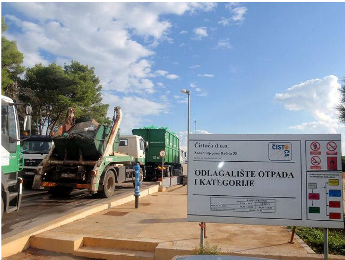
Slika 5. Odlagalište otpada Diklo – Zadar

Odlagalište neopasnog otpada “Diklo” službeno je odlagalište grada Zadra. Odlaganje otpada na toj lokaciji započelo je još 1963. Godine, a dana odlagalište zauzima površinu oko 60,33 ha. Cjelokupan komunalni otpad s područja grada Zadra odlaže se na odlagališta otpada Diklo i sigurno je da će se takva praksa nastaviti sve do izgradnje županijskog centra za gospodarenje otpadom koje je predviđeno za izgradnju u Biljanima Donjim. Na području grada Zadra uključujući i otoke u administrativnom sustavu grada ( Silba, Molat, Olib, Ist, Iž, Rava, Premuda) usluge odvoza i odlaganja komunalnog otpada obavlja Čistoća d.o.o Zadar. Na odlagalište Diklo svakodnevno se odlaže otpad iz grada Nina, općina Privlaka, Vrsi, Ražanac, Posedarje, Poličnik, Galovac, Zemunik Donji, Sukošan, Novigrad i Škabrnja, te otoka koji administrativno pripadaju gradu Zadu.