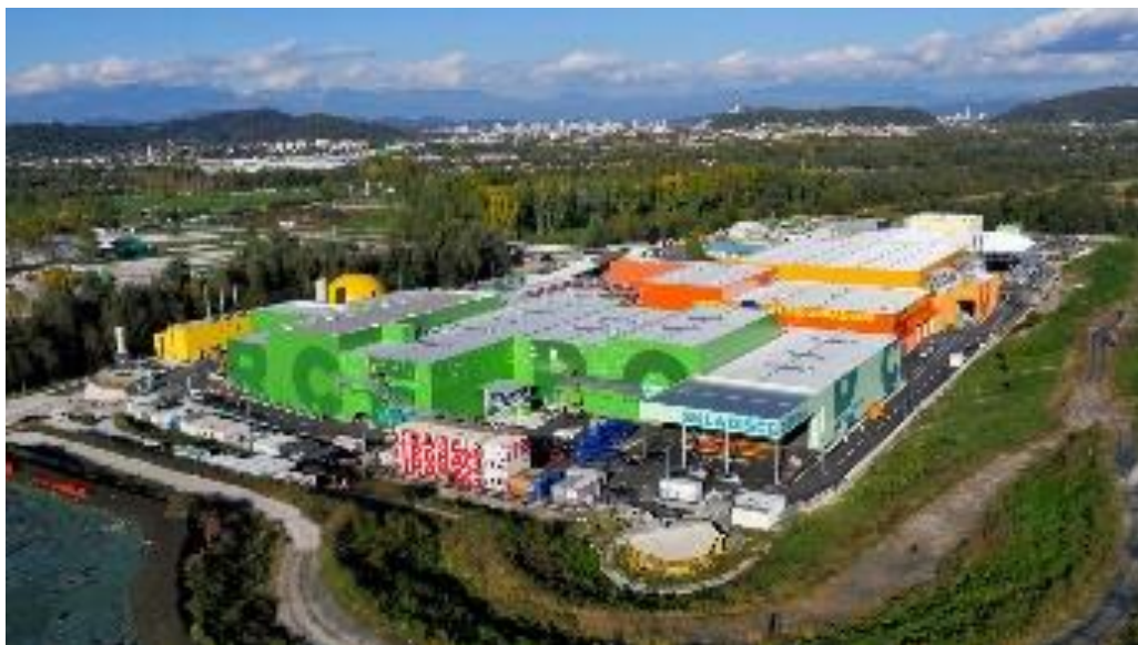
Slika 8. Regionalni centar za gospodarenje otpadom Ljubljana

neusporedivo efikasnija, tamo je postavljen jedan zeleni otok na stotinjak stanovnika, a veći je i postotak odvojenog prikupljanja koje započinje još na kućnom pragu 13 .