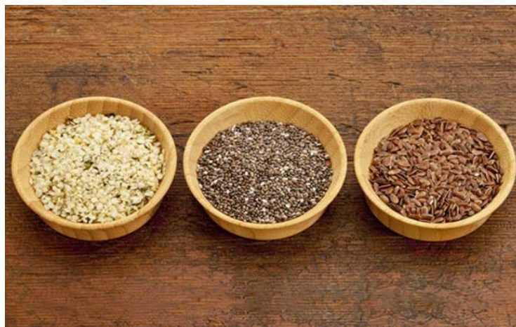
Slika 2. Chia sjemenke i sjemenke lana