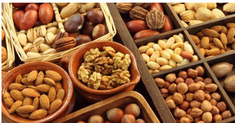
Slika 3. Orašasti plodovi

Izvor: https://freshpress.info/magazin/jedu-ih-doktori-tri-supersjemenke-koje-treba-konzumirati-svakog-dana/