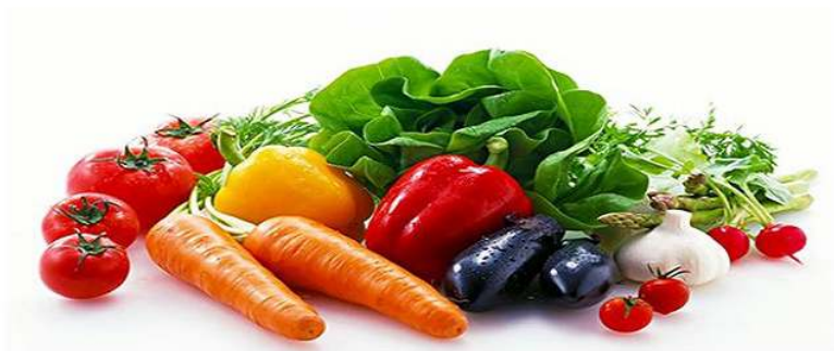
Slika 1. Povrće bogato željezom