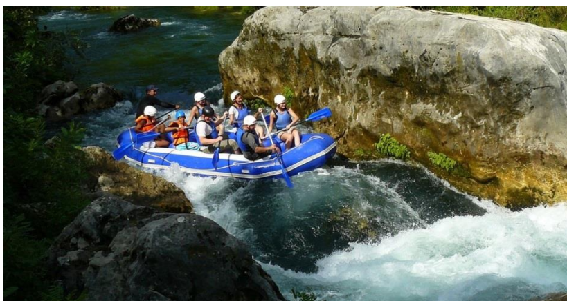
Slika 6. Rafting na rijeci Cetini