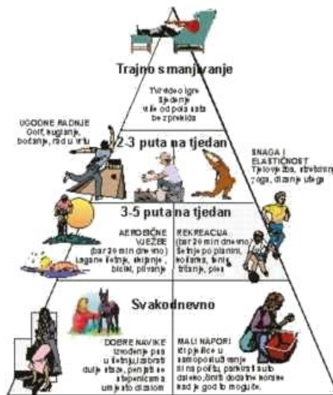
Slika 6. Piramida tjelesne aktivnosti Jane Nirstorm, Minesta, SAD