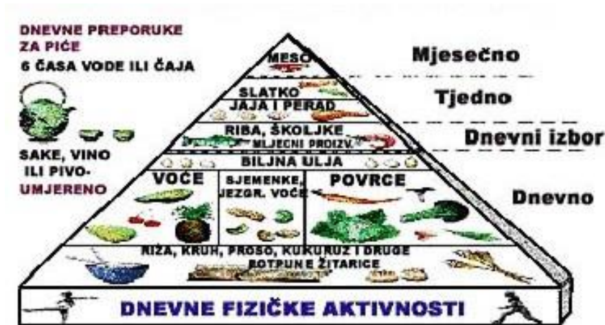
Slika 11. Piramida Azijske zdrave prehrane