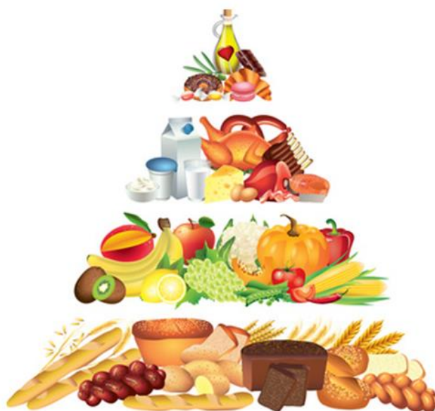
Slika 3. Prva piramida pravilne prehrane