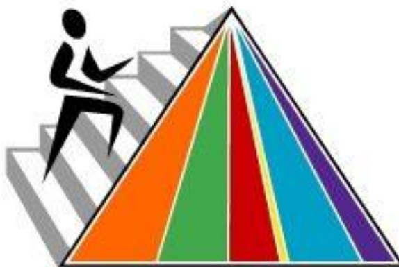
Slika 4. Moja piramida

Izvor: https://www.interijernet.hr/hr-razno/piramida-zdrave-prehrane_57167