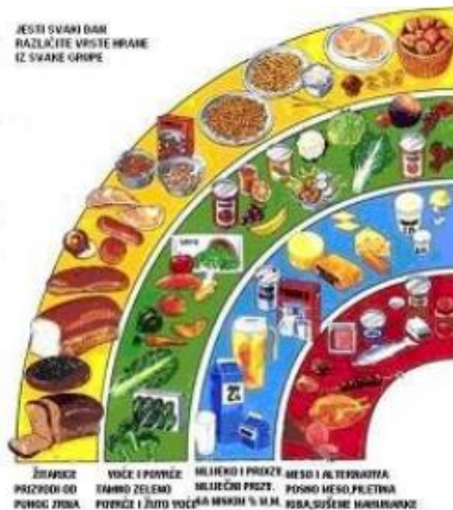
Slika 2. Prikaz pravilne prehrane (DUGA)