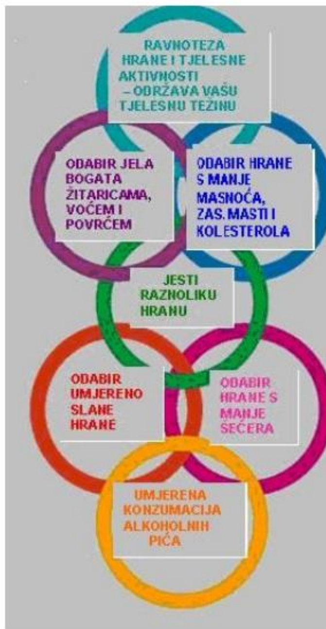
Slika 1. Prvi koncept pravilne prehrane (KRUGOVI)