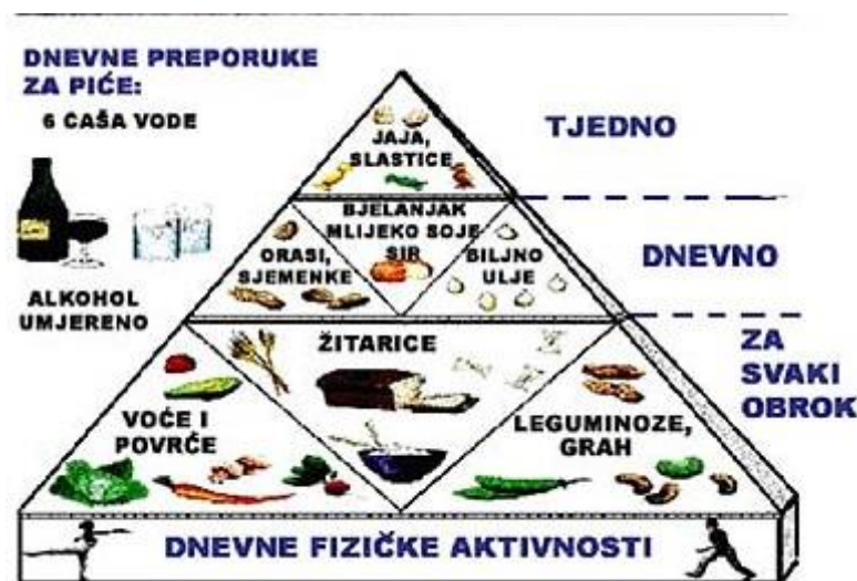
Slika 13. Piramida tradicionalne vegetarijanske prehrane