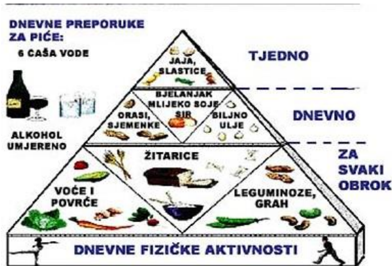
Slika 12. Piramida tradicionalne Latinoameričke prehrane