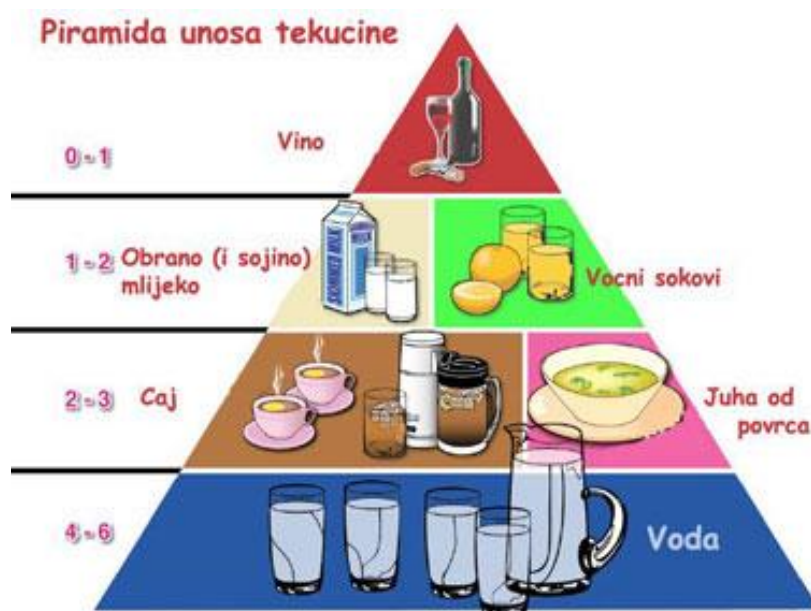
Slika 8. Piramida unosa tekućine