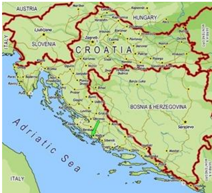
Slika 4. Granica Republike Hrvatske i susjednih država.