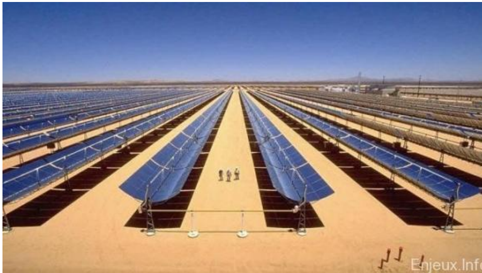
Slike 3. Solarna elektrana.