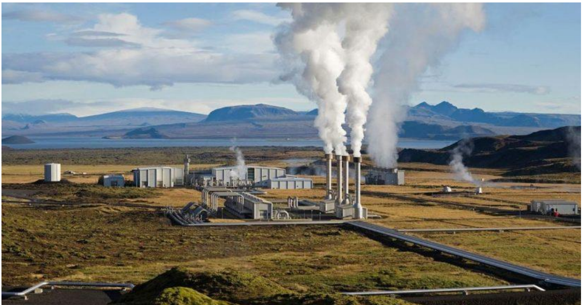
Slika 5. Geotermalna elektrana na Islandu.