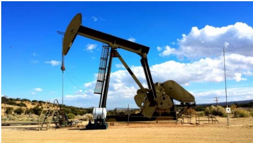
Slika 7. Naftna bušotina.