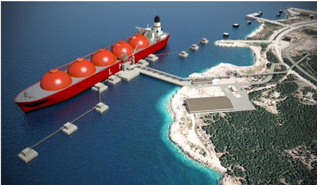
Slika 8. LNG brod na koprenom LNG terminalu.