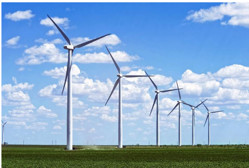
Slika 2. Vjetroelektrane.