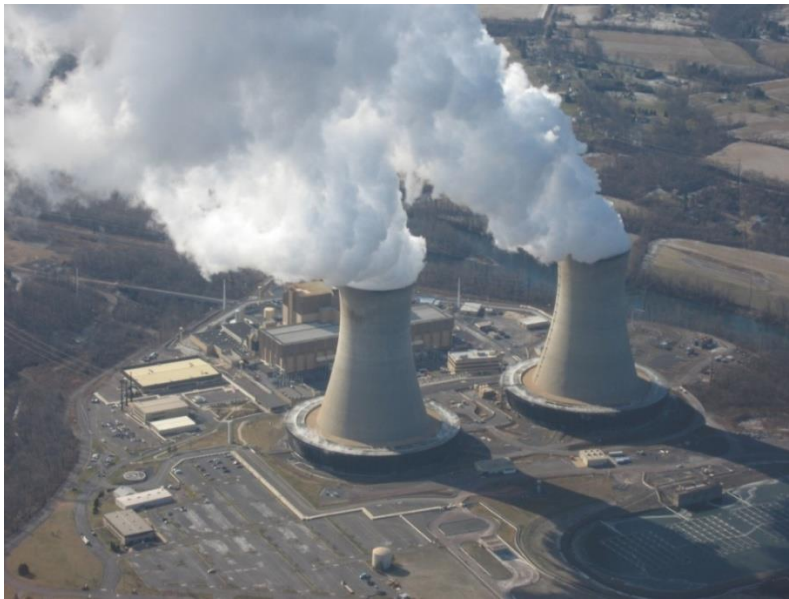
Slika 6. Nuklearna elektrana.