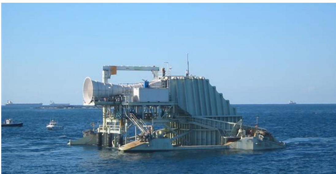
Slika 4. Elektrana na morske valove.