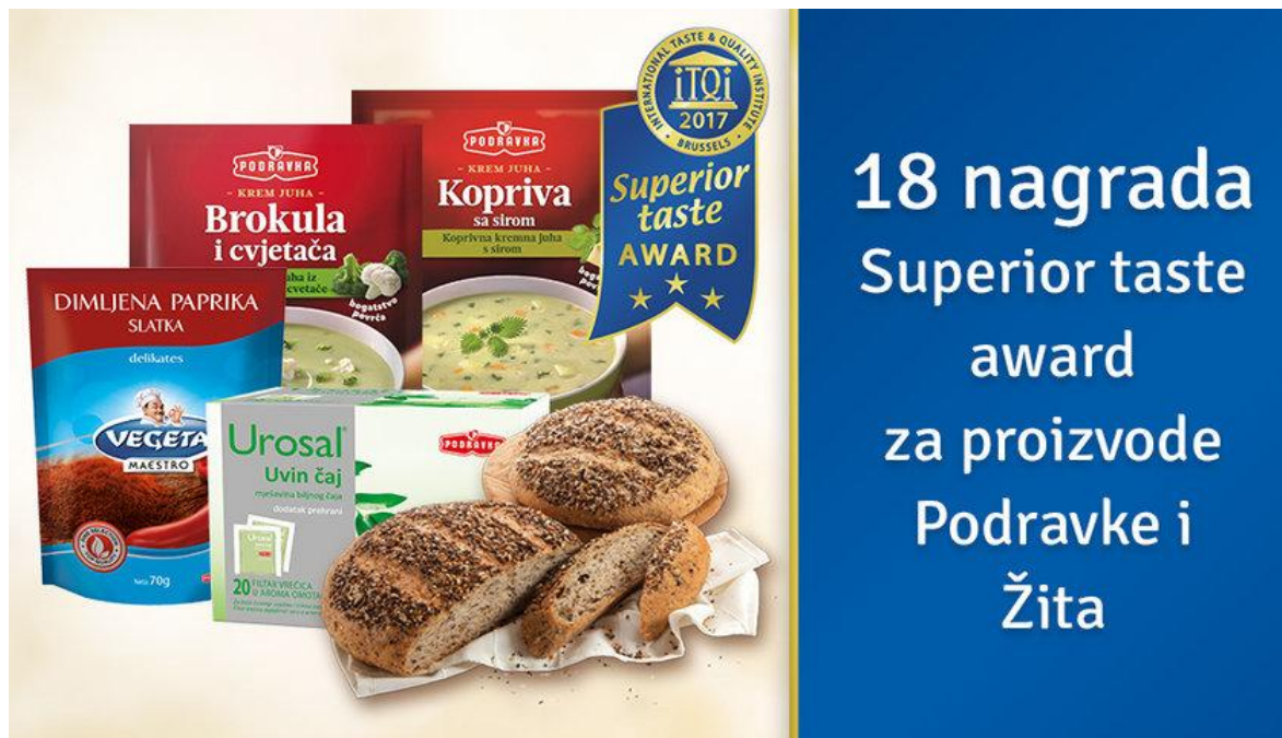
Slika 1: Podravkini proizvodi