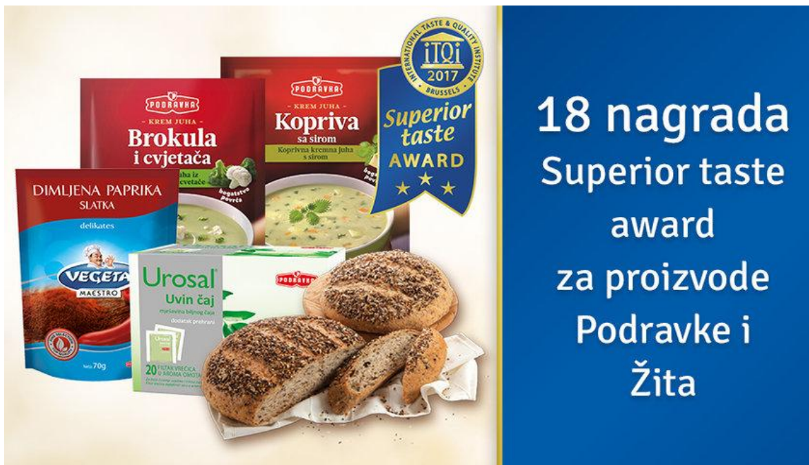
Slika 1: Podravkini proizvodi