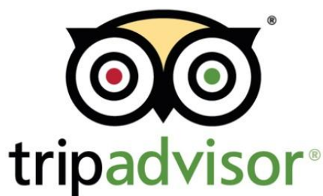
Slika 5. Službeni logo TripAdvisora

„Tripadvisor je vodeći svjetski putnički web-portal i vodič na kojem putnici/gosti diljem svijeta ostavljaju recenzije o određenoj destinaciji, smještaju, restoranu, baru, kafiću, trgovini, izletu...” 22 Pomoću recenzija putnici saznaju velik broj informacija o destinaciji u koju putuju te dodatnom sadržaju. Preko Tripadvisora putovanja se planiraju, istražuju i rezerviraju, čime ovaj portal broji više od 83 milijuna posjeta mjesečno, a portal je prisutan u 34 zemlje i dostupan na 21 jeziku svijeta. Ovaj oblik online komunikacije je zapravo vrlo moćna usmena preporuka koja oduvijek i jest najbolji oblik reklame ili antireklame. Svaki objekt koji se nalazi na Tripadvisoru, kao što je hotel, kafić, trgovina, apartman, kuća krub ili restoran svjesni su svog postojanja u viralnom svijetu te se maksimalno trude ispuniti sva očekivanja svojih gostiju kako bi o njima ostavili što bolju recenziju, imajući na umu da će te iste komentare pročitati velik broj putnika i onih koji istražuju mjesto koje bi voljeli posjetiti. Korisnicima portala Tripadvisor pomaže kod bolje prezentacije gostima i bolje optimizacije na Google pretraživaču, a pri otvaranju profila potrebno unijeti podatke, link web-stranice i fotografije. Kod Tripadvisora je ključno da vas gosti ocjenjuju i da to objaljuju. Većina se današnjih gostiju koristi ovim alatom za bolje snalaženje u moru turističkih ponuda, pa tako vjeruje komentarima drugih. 23