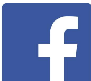
Slika 1. Službeni logo Facebooka

Facebook je najraširenija i najpopularnija društvena i poslovna mreža današnjice obuhvaća preko milijardu i pol korisnika, čiji broj neprekidno raste. 10 Facebook je socijalna platforma za izmjenjivanje informacija, znanja, poslovnih ponuda, fotografija... Valjani e-mail dovoljan je za registraciju Facebook profila. Jednom kada je napravljen, profil se može mijenjati, uređivati slikama i komentarima, ograničavati glede prava korištenja i vidljivosti danih informacija itd. 11 Facebook je osnovao Mark Zuckerberg, bivši student Harvarda 2004.godine. Na početku je Facebook bio namijenjen samo studentima sveučilišta Harvarda koji su putem te društvene mreže mogli međusobno komunicirati i razmjenjivati informacije. Kasnije su se priključila i druga sveučilišta, srednje škole i velike kompanije diljem svijeta. Danas Facebook ima oko 2 milijarde aktivnih korisnika.