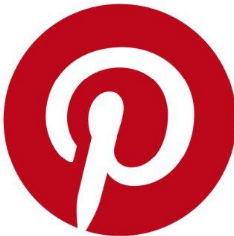
Slika 6. Služben logo Pinteresta

Pinterest je jedna od jednostavnijih marketinških platformi na ovom popisu. Umjesto objavljivanja sadržaja vašoj publici za čitanje, na Pinterestu objavljujete samo fotografiju koja se može kliknuti i kratak opis. To je vrlo popularna platforma za robne marke s opipljivim proizvodom, tj. markama odjeće i hrane, restoranima, onima u e-trgovini itd. Pinterest je površna platforma, tako da svaka fotografija koju postavite mora biti visoke kvalitete i upečatljiva da se istakne u vašem feedu. Kada započnete s objavljivanjem fotografija, provjerite jesu li povezane natrag na blog ili stranicu na vašoj web stranici. Kada korisnici kliknu vašu sliku na vašu web-lokaciju, žele vidjeti ili čitati nešto što je povezano s fotografijom koja ih je privukla.