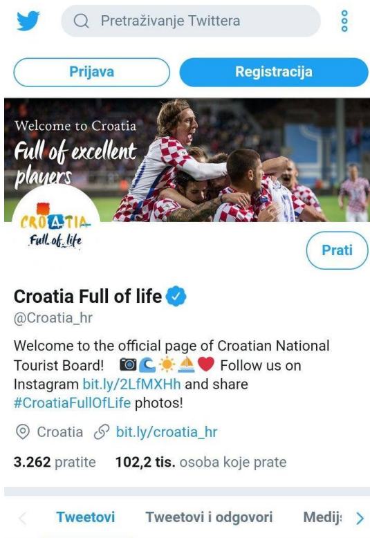
Slika 10. Croatia full of life - profil na Twitteru