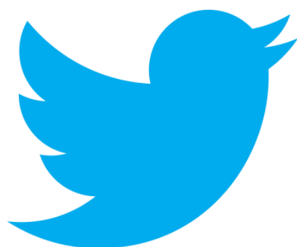
Slika 3. Službeni logo Twittera

uspjeha. 17 U početku su Twitter prihvatili samo američki korisnici, no kako se dobar glas brzo širi, proširio se i na Europu pa tako ova društvena mreža većinu hrvatskih korisnika dobiva 2008. i 2009. godine. Twitter, na žalost, ne daje podatke o broju korisnika po državama, jer je polje za unos lokacije slobodno. U njega možete upisati Hrvatska, Croatia, Zagreb ili nešto treće. Nema jedinstvenih kategorija, tako da je nemoguće znati koliko ima „tviteraša“ u Hrvatskoj ili bilo kojoj drugoj susjednoj zemlji. 18