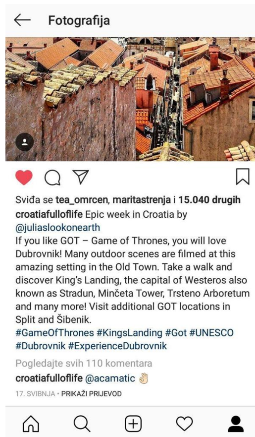
Slika 9. Grad Dubrovnik na Instagram profilu Croatia full of life