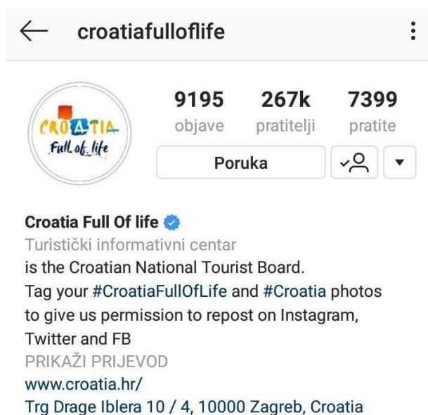
Slika 8. Pratitelji i broj objava na Instagram profilu Croatia full of life

Hrvatska se na društvenim mrežama prezentira kao atraktivna i neistražena destinacija, prepuna raznolikosti i bogate turističke ponude. Pritom se najčešće koriste fotografije koje prate godišnja doba i konkretne turističke proizvode, ali i one koje prikazuju poznate destinacijske znamenitosti. Sve aktivnosti su usklađene i s novim komunikacijskim konceptom koji je istovremeno održiv i prilagodljiv specifičnim ciljevima i turističkim proizvodima. Cilj aktivnosti na društvenim mrežama je zadržati pozornost, stimulirati um i izazvati emocije kod ciljane publike, a dosadašnje reakcije fanova na svim društvenim mrežama, a tako i na instagram profilu što se tiče Hrvatske turističke zajednice smatram da su su vrlo pozitivne.