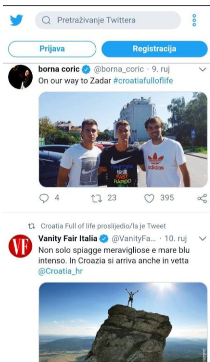
Slika 11. Promocija destinacije od strane poznatih i stranih posjetitelja