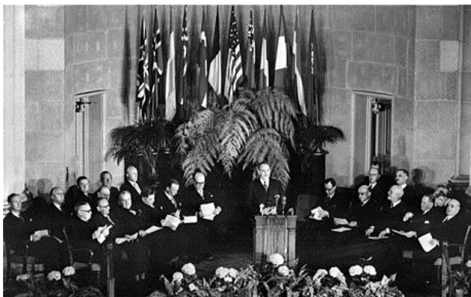
Slika 3 Potpisivanje Sjevernoatlantskog ugovora u Washingtonu

Potpisnice ovog sporazuma ponovno potvrđuju svoje uvjerenje u namjere i načela Povelje Ujedinjenih naroda i svoju želju da žive u miru sa svim ljudima i svim vladama. One su odlučne čuvati slobodu, zajedničko nasljedstvo i civilizaciju svojih naroda, zasnovanih na načelima demokracije, individualnih sloboda i prava. One žele poticati stabilnost i boljitak na sjevernoatlantskom području. One su odlučne ujediniti svoje napore za zajedničku obranu i održavanje mira i sigurnosti. 31