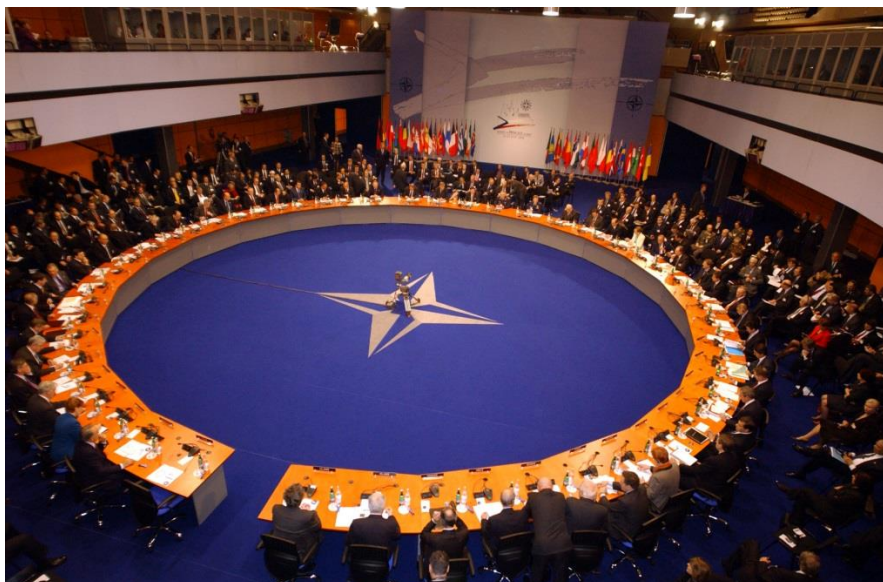
Slika 2 NATO summit održan u Pragu, Češka 2002.

Nema nekog točno određenog pravila pravila u vremenskom održavanju pa su primjerice 1989. godine, 1997. i 2002. godine održana po dva summita, dok je od prvog summita u Parizu 1957. godine do drugog u Bruxellesu 1974. godine proteklo sedamnaest godina.