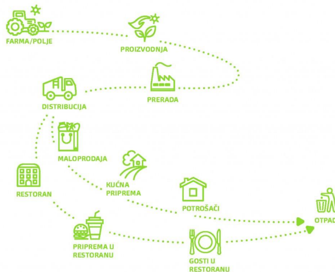
Slika 6. Prikaz od polja do stola.