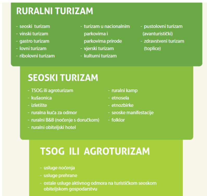
Slika 1. Shematski prikaz međusobnog odnosa ruralnog, seoskog i agroturizma.