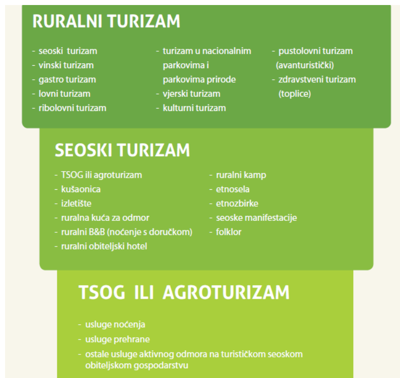
Slika 1. Shematski prikaz međusobnog odnosa ruralnog, seoskog i agroturizma.