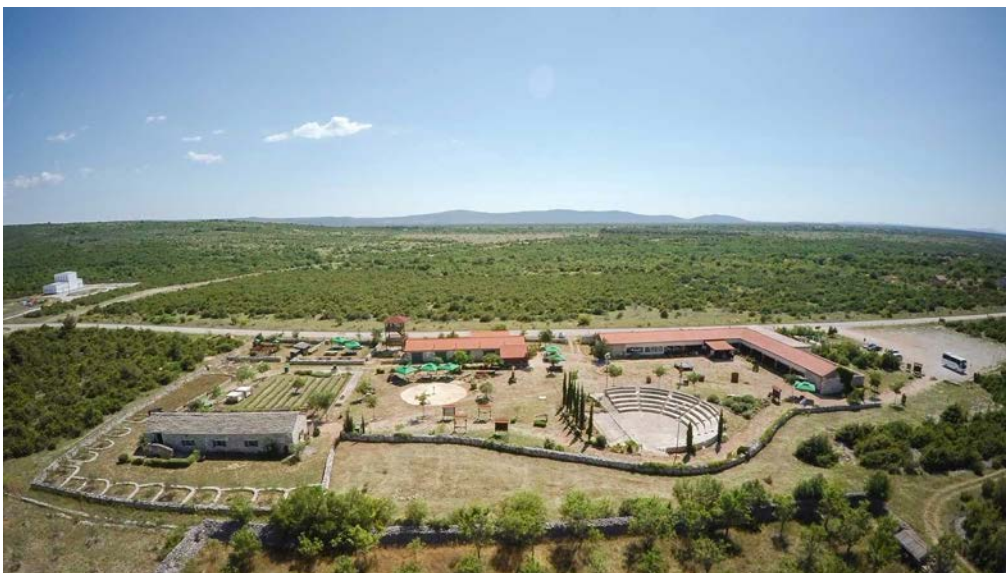
Slika 3. Etnoland Dalmati – pogled iz zraka.