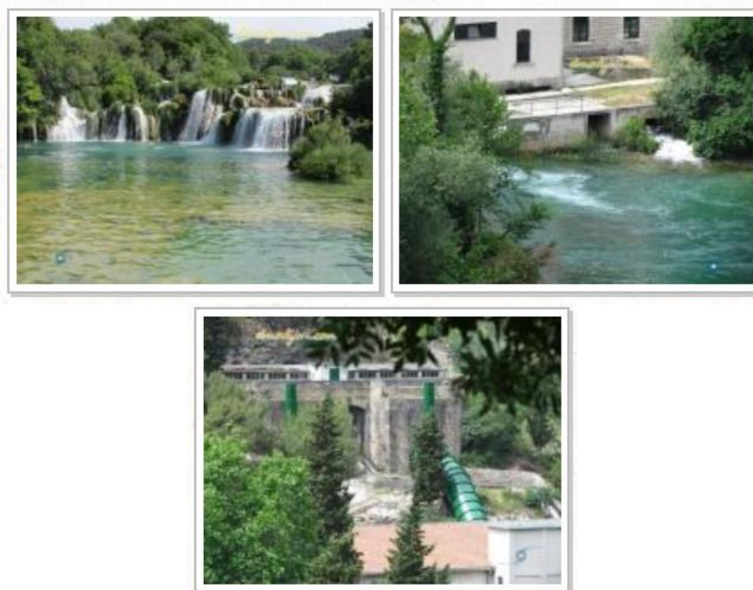
Slika 3. Hidroelektrana Jaruga