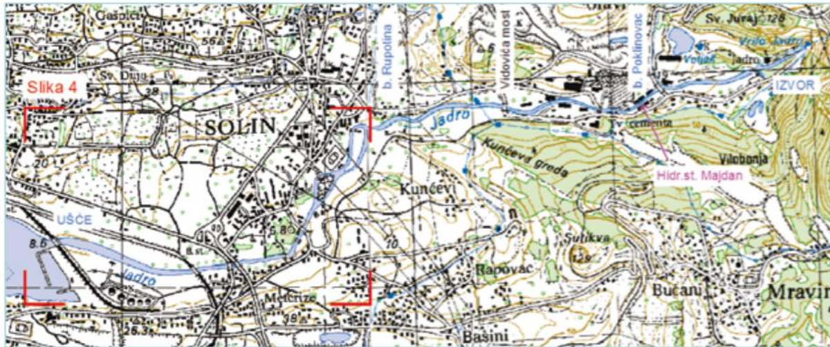
Slika 6. Tok rijeke Jadro od izvora do ušća