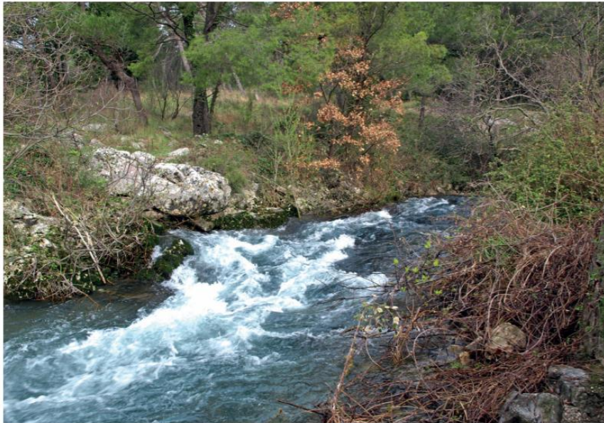
Slika 5: Izvorište Žrnovnica – jedno od manjih mjesta istjecanja