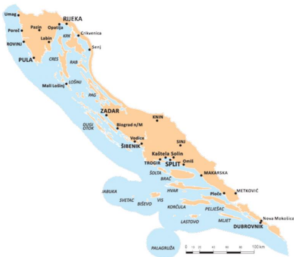
Slika 1. Primorska Hrvatska.

Izvor: Jurić, T.: Upoznajmo domovinu, Povijest i geografija, Prvo izdanje, Munchen, Zagreb, 2016., str. 82