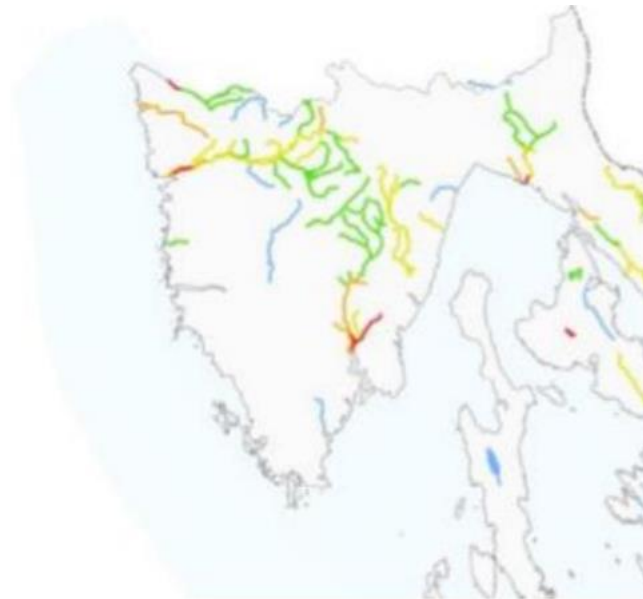
Slika 2. Ekološko stanje vodnih tijela na području Istarske županije.