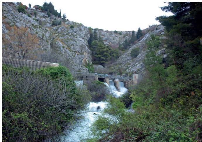
Slika 7. Izvor Jadra

Izvor: Kapelj, S., Kapelj, J., Švonja, M.: Hidrogeološka obilježja sliva Jadra i Žrnovnice, Tusculum, vol. 5, no. 1, 2012., str. 206