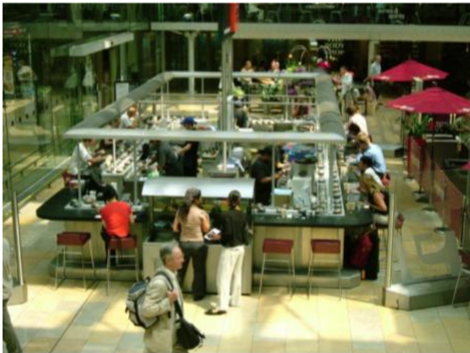
Slika 7. Sushi restoran s transportnom trakom „Yo“