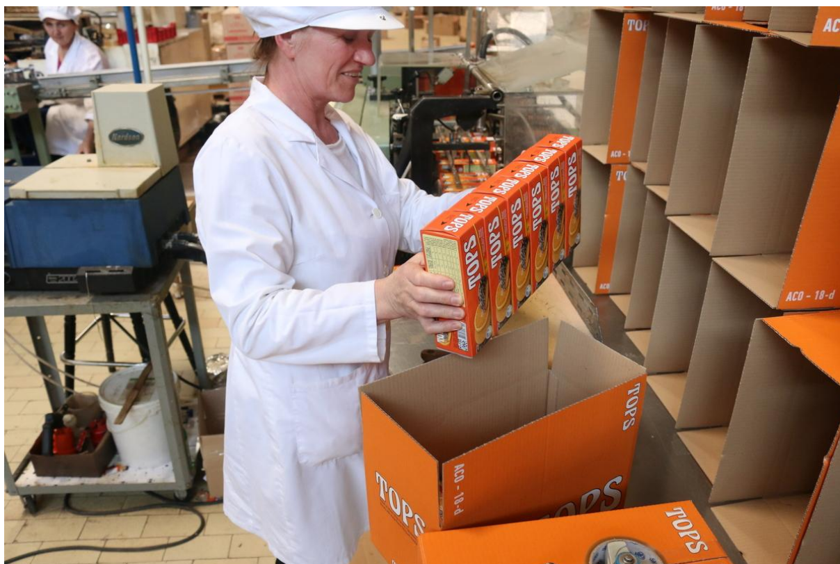
Slika 15. Pakiranje biskvita u komercijalne kutije