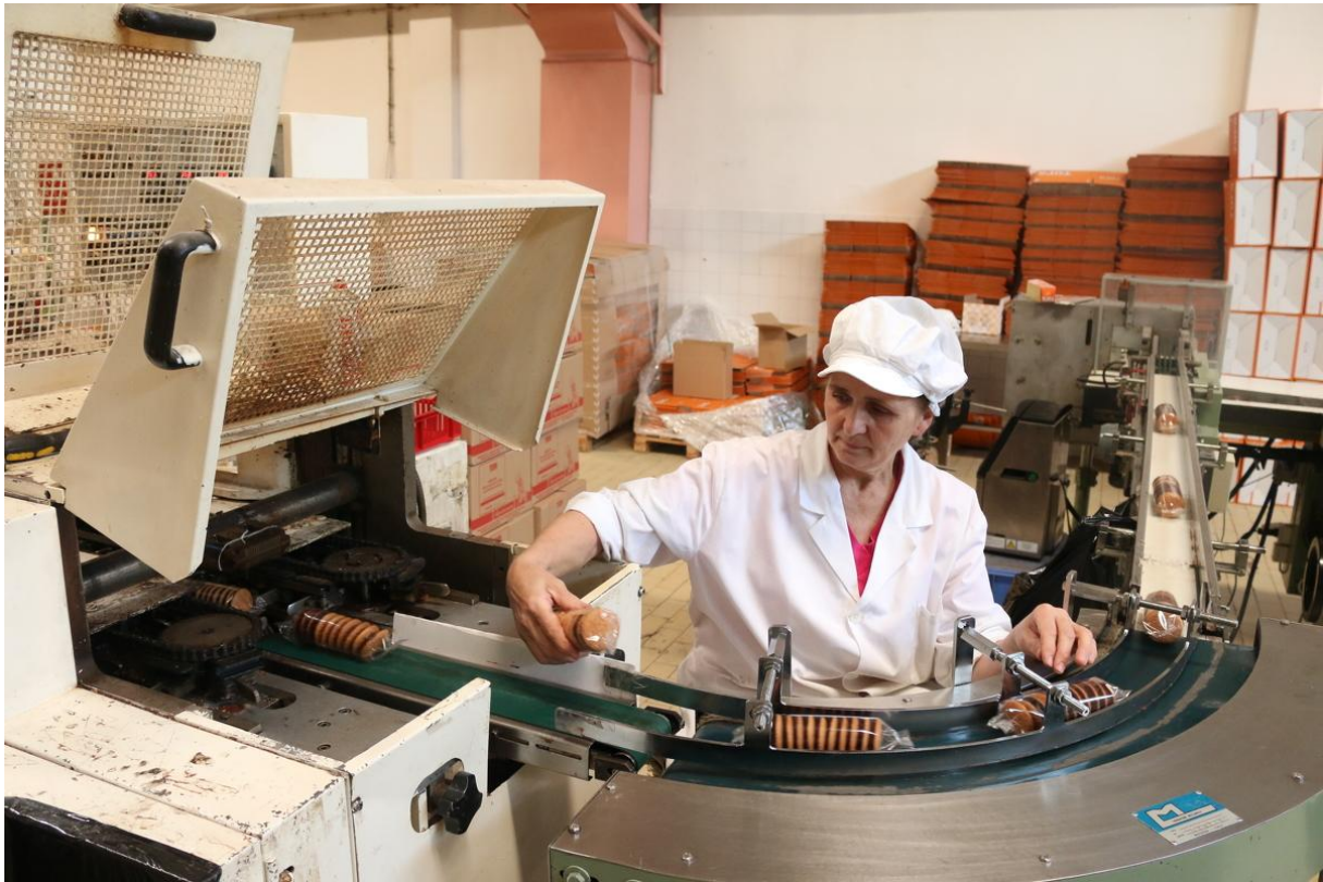
Slika 14. Pakiranje gotovog proizvoda