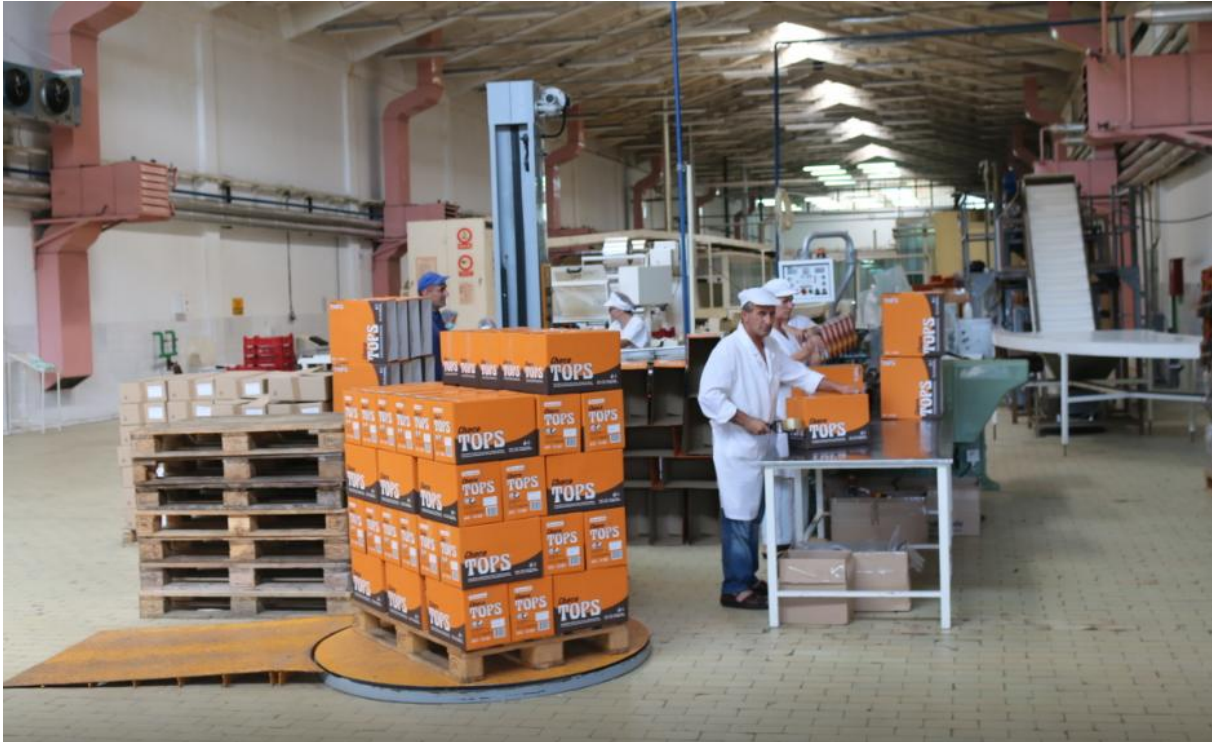
Slika 18. Umotavanje paleta na rotirajućem postolju

paletu ona se ručno omotava folijom od celofana tako što se postolje na kojem je paleta rotira, a radnik drži foliju.