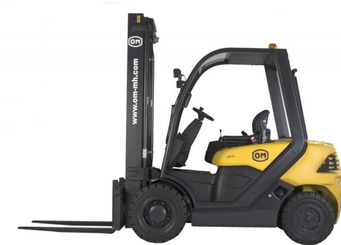
Slika 20. Čeoni samohodni viličar na dieselski pogon