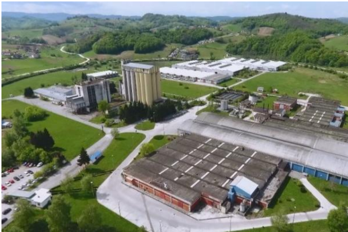
Slika 17. Skladište TOPS-a