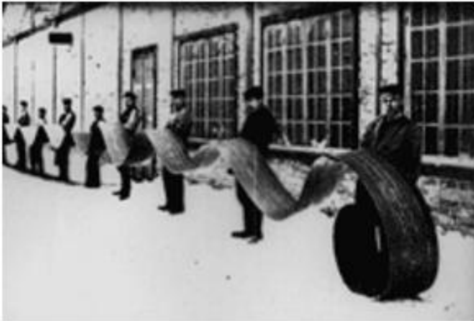
Slika 2. Sandvikova čelična traka iz 1901. godine