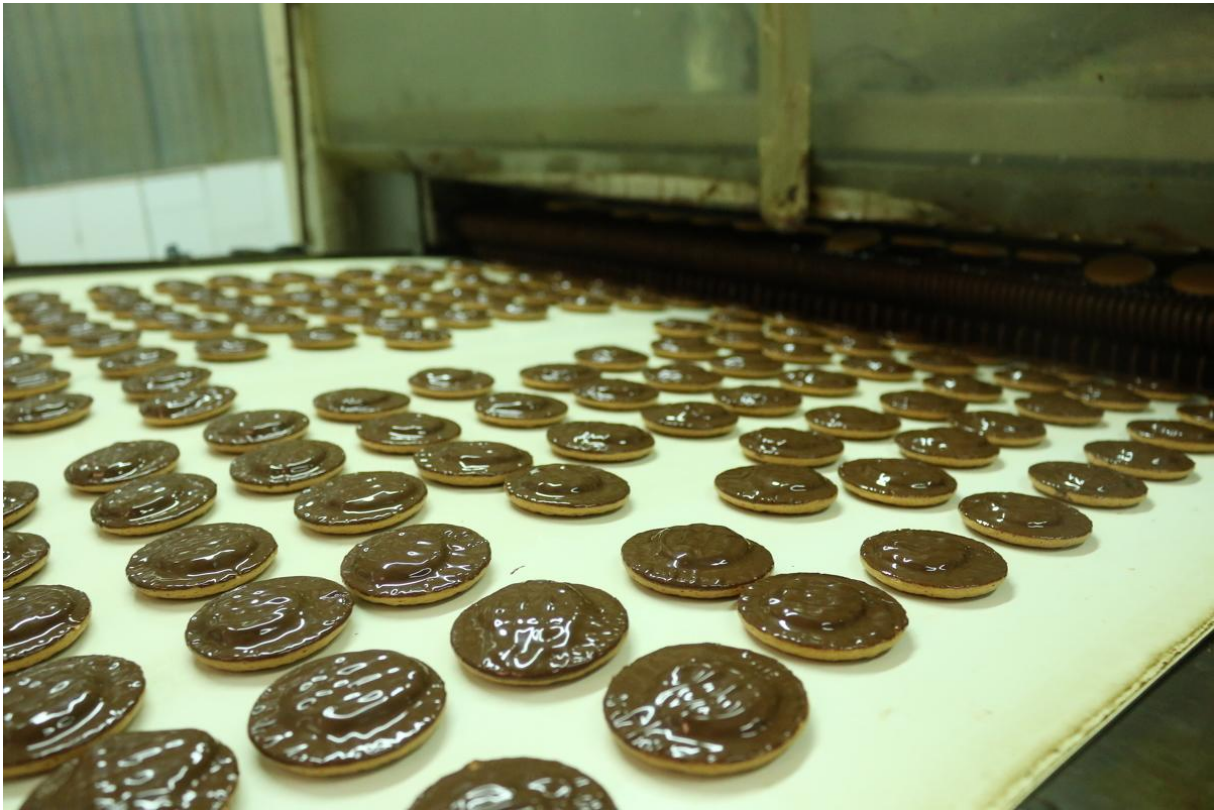
Slika 13. Izlazak biskvita iz tunela za hlađenje