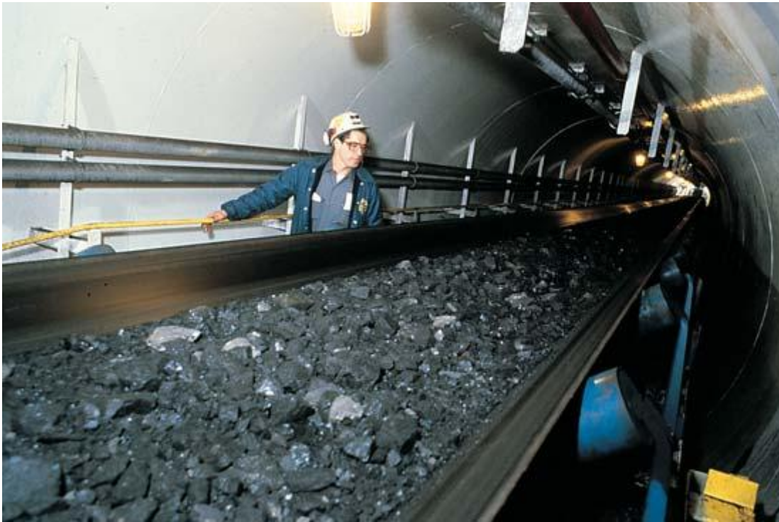
Slika 5. Upotreba trakastog transportera u rudniku uglja