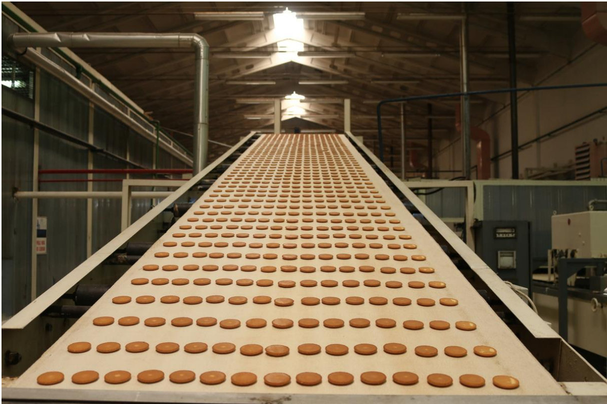
Slika 10. Trakasti transporter s gumenom trakom