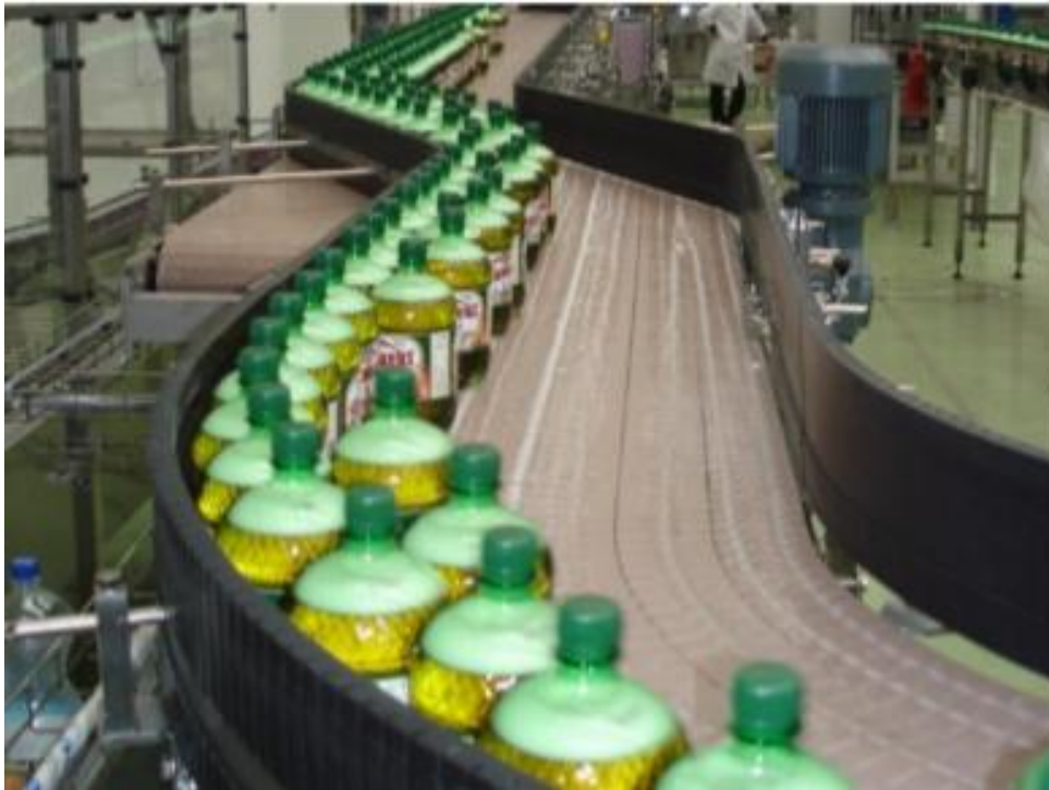
Slika 6. Trakasti transporter u punionici boca