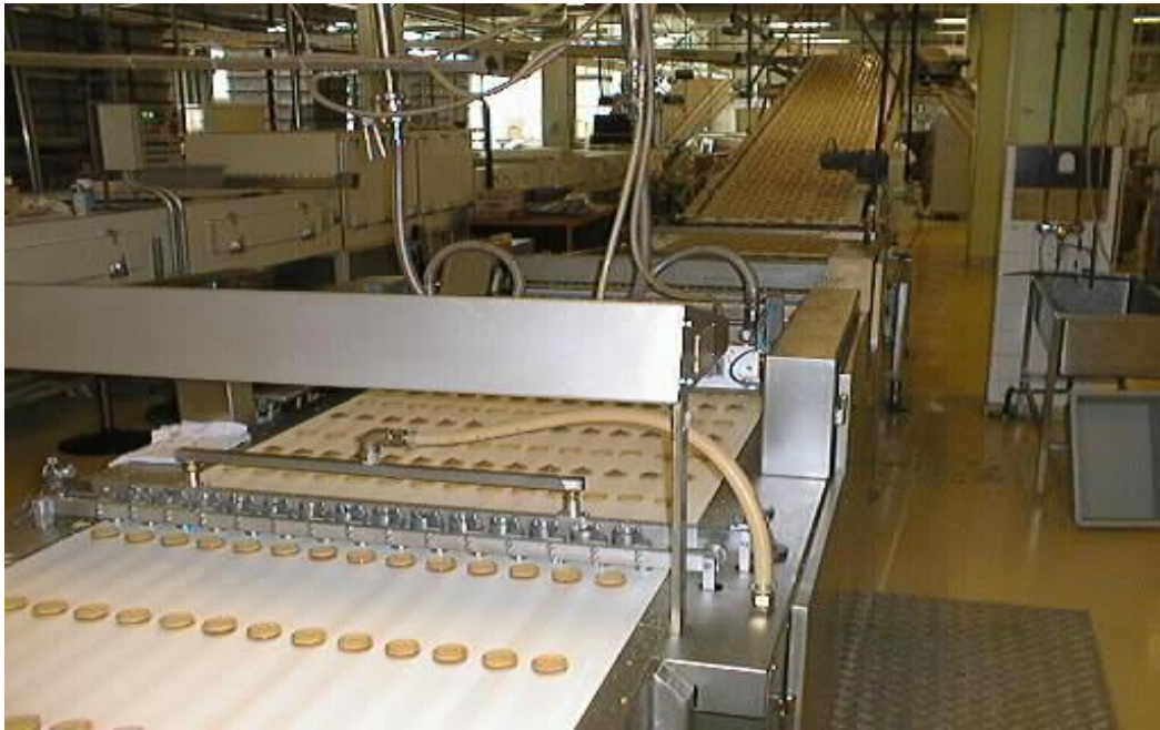
Slika 9. OAKES depoziter