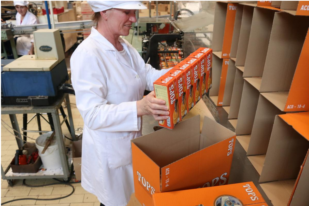
Slika 15. Pakiranje biskvita u komercijalne kutije