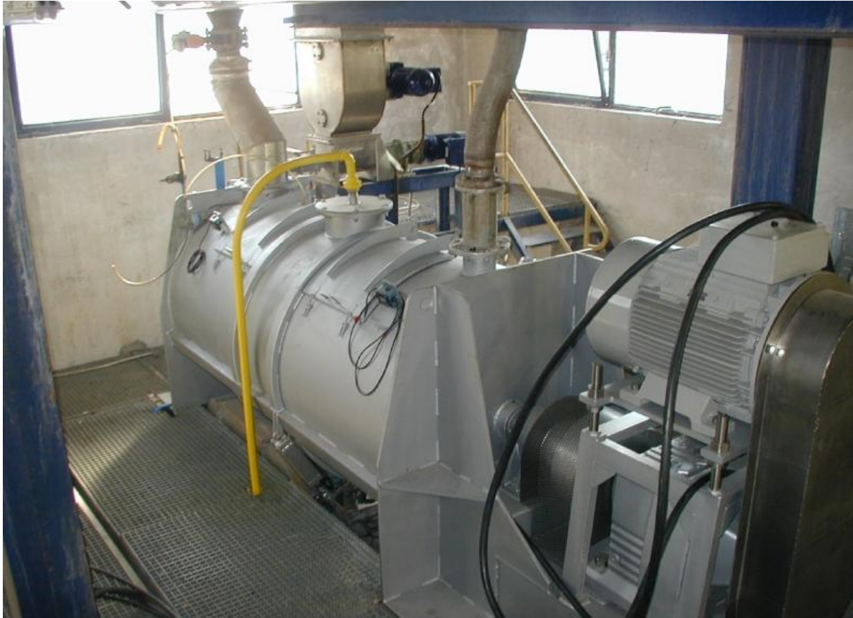
Slika 8. Miješalica za tijesto

Masa ulazi u komoru za miješanje i prolazi preko zubaca zadnjeg statora i rotora prema periferiji komore za miješanje, te prelazi preko ivice rotora i dalje između zubaca ide do centra prednjeg statora odakle se prazni.