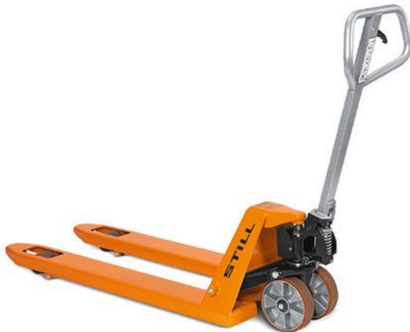
Slika 19. Ručni viličar