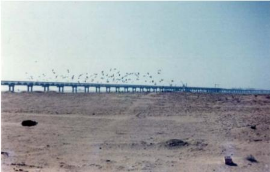
Slika 4. Najduži trakasti transporter na svijetu, Zapadna Sahara