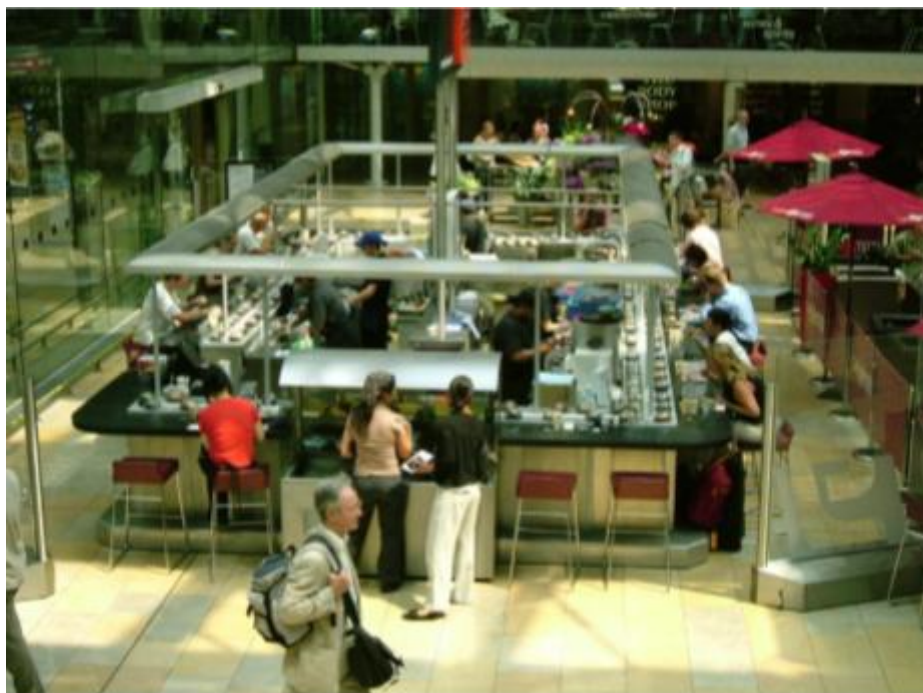
Slika 7. Sushi restoran s transportnom trakom „Yo“