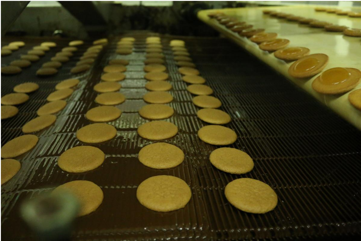
Slika 12. Presvlačenje biskvita s čokoladom