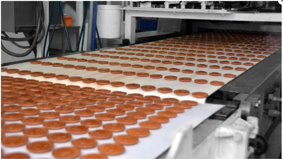
Slika 11. Doziranje voćnog pektina