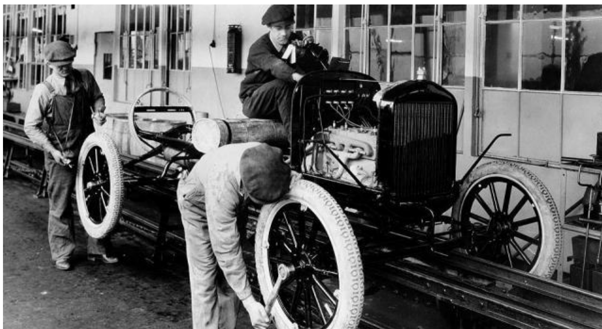
Slika 3. Montažna transportna traka Fordova automobila Model-T