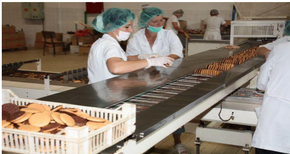
Izvor: Vlastita slika (19. 02. 2018.)