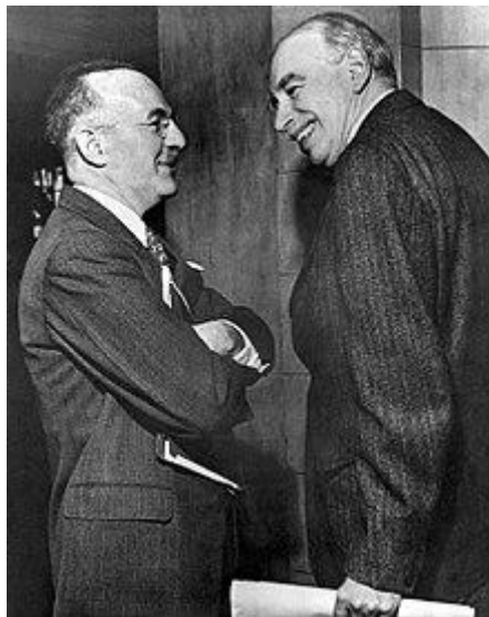
Slika 1. Harry Dexter White i John Maynard Keynes, osnivači Svjetske banke i Međunarodnog monetarnog fonda

Osnovana 1944. godine na Konferenciji Bretton Woods, Međunarodna banka za obnovu i razvoj, uskoro nazvana Svjetska banka, proširila se na blisko povezanu skupinu od pet razvojnih institucija. Iako je mnogo zemalja bilo zastupljeno na konferenciji Bretton Woods, Sjedinjene Američke Države i Velika Britanija bile su najmoćnije države u nazočnosti i dominirale su pregovorima.