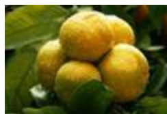
Slika 2. Neretvanska mandarina