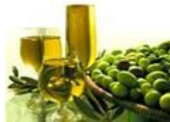
Slika 3. Ekstra djevičansko maslinovo ulje Cres