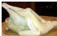
Slika 13.Zagorski puran