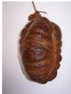
Slika 8. Baranjski kulen