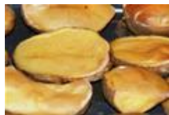
Slika 12.Lički krumpir