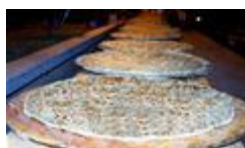
Slika 14.Poljički soparnik