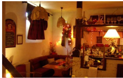
Slika 24. Konoba Dvori Matanovi