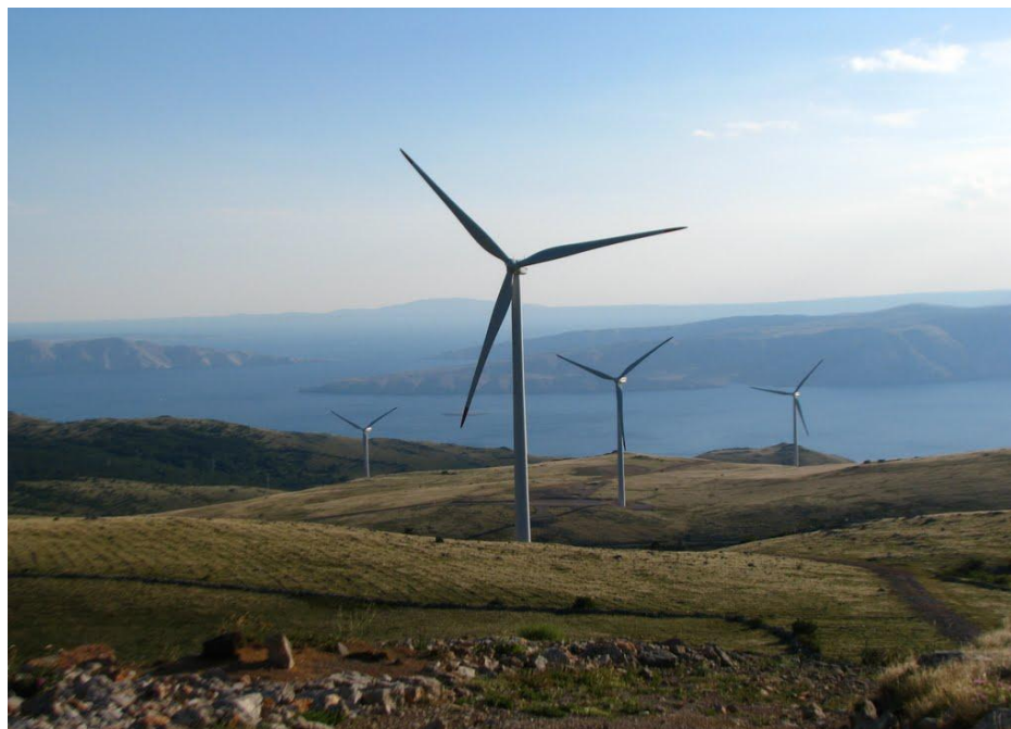
Slika 2. VE Vrataruša.