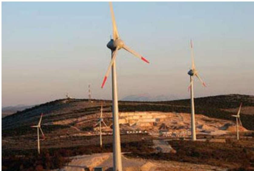
Slika 1. Vjetroelektrana Trtar – Krtolin.