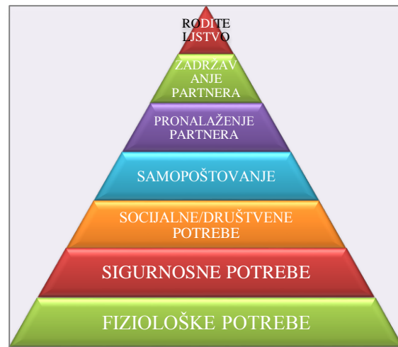
Slika 3: Preoblikovana piramida potreba