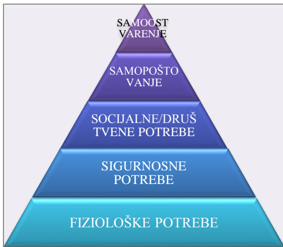
Slika 2: Maslowljeva piramida potreba

sposobnosti, spontanost, rješavanje problema, moralnost i manjak predrasuda, prihvaćanje činjenica). Na najvišoj točki piramide ljudi ostvaruju svoje primarne potrebe i stvaraju osnovu za daljnji razvoj, sklonost prema stjecanju znanja, estetici, razvijanju hobija i podizanju kvalitete života. Prema Fulgosiju (1997, 249), „cilj ili svrha života je aktualizacija ljudskih potencijala ili mogućnosti, odnosno samoaktualizacija svakog pojedinca“, a osobe koje ne rastu i ne razvijaju se nikad ne dostižu razinu ljudske egzistencije. Ljudi zadovoljavaju želje i potrebe prema određenom redosljedu važnosti, od nižih prema višim, stoga je hijerarhijski položaj određene potrebe Maslow prikazao u obliku piramide, prikazano na slici 2: