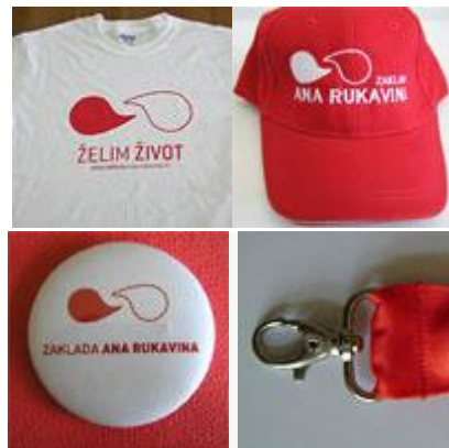
Slika 7. Promotivni artikli i materijali Zaklade Ana Rukavina