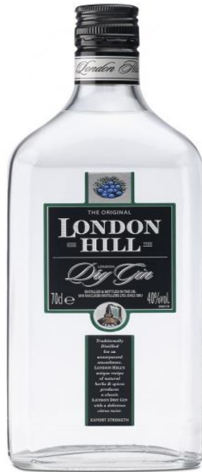
Slika 5. London Hill Gin