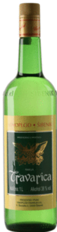
Slika 13. Travarica