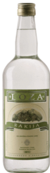
Slika 10. Loza