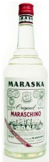
Slika 15. Zadarski maraschino