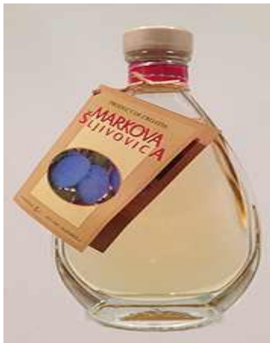
Slika 12. Slavonska šljivovica