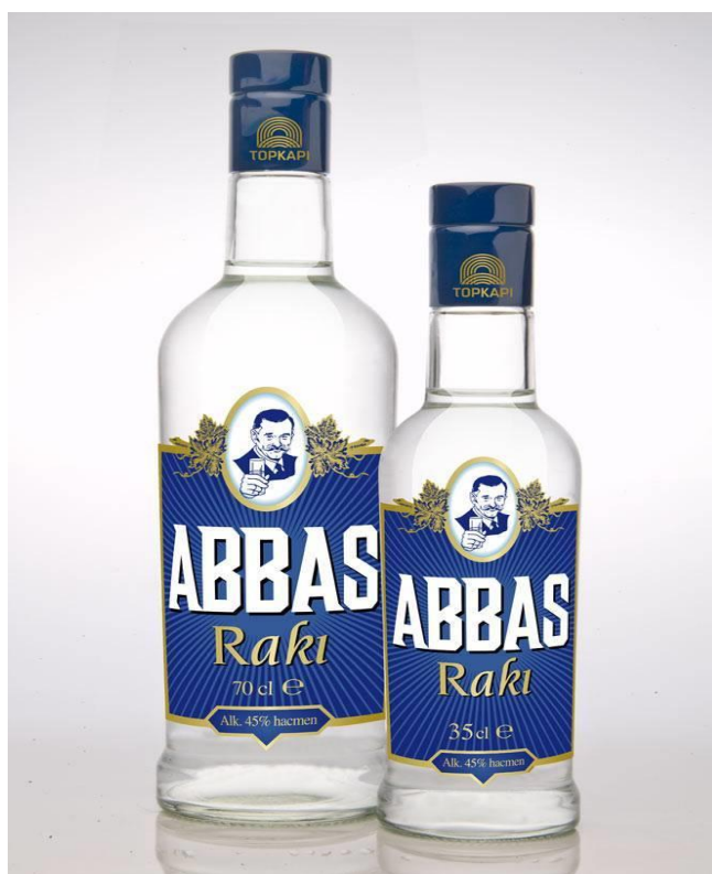
Slika 7. Turski Abbas Raki