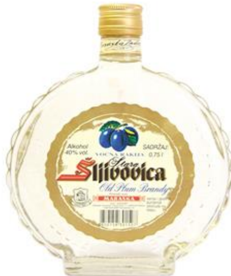
Slika 11. Stara šljivovica