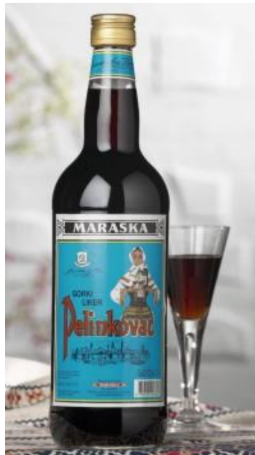
Slika 14. Pelinkovac