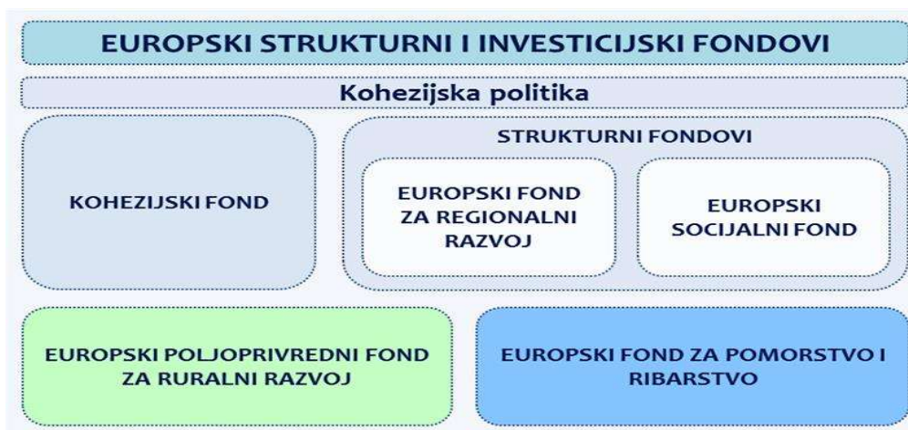
Slika 1: Europski strukturni i investicijski fondovi

U financijskom razdoblju 2014.-2020. Republici Hrvatskoj je iz Europskih strukturnih i investicijskih (ESI) fondova bilo dostupno ukupno 10,731 milijardi eura. Od tog iznosa, 8,452 milijarde eura bilo je namijenjeno ciljevima kohezijske politike, 2,026 milijarde eura za poljoprivredu i ruralni razvoj te 253 milijuna eura za razvoj ribarstva.