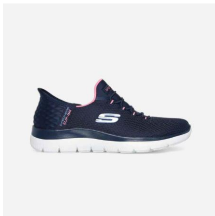
Slika 3. Slip- ins model

Novi proizvod koji je osmišljen 2023. godine i omogućuje najlakše i najbrže obuvanje bez saginjanja i korištenja ruku. Prvo je proizvod bio osmišljen za stariju populaciju i djecu zbog lakšeg obuvanja, ali na kraju su ga plasirali za sve. Obuća koja se koristi potpuno bez ruku, samo se zakorači u patiku. Dostupna je za sve spolove i u svim kategorijama obuće. Najveća je inovacija u povijesti brenda Skechers. Obuvanje bez ruku i saginjanja upravo sada donosi revoluciju u industriji obuće. (Skechers 2024)