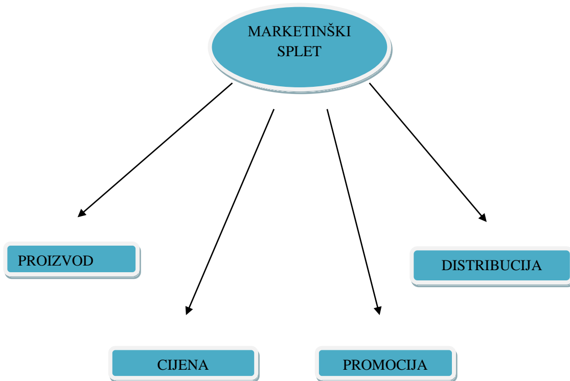
Slika 1. Slikoviti prikaz marketinškog miksa