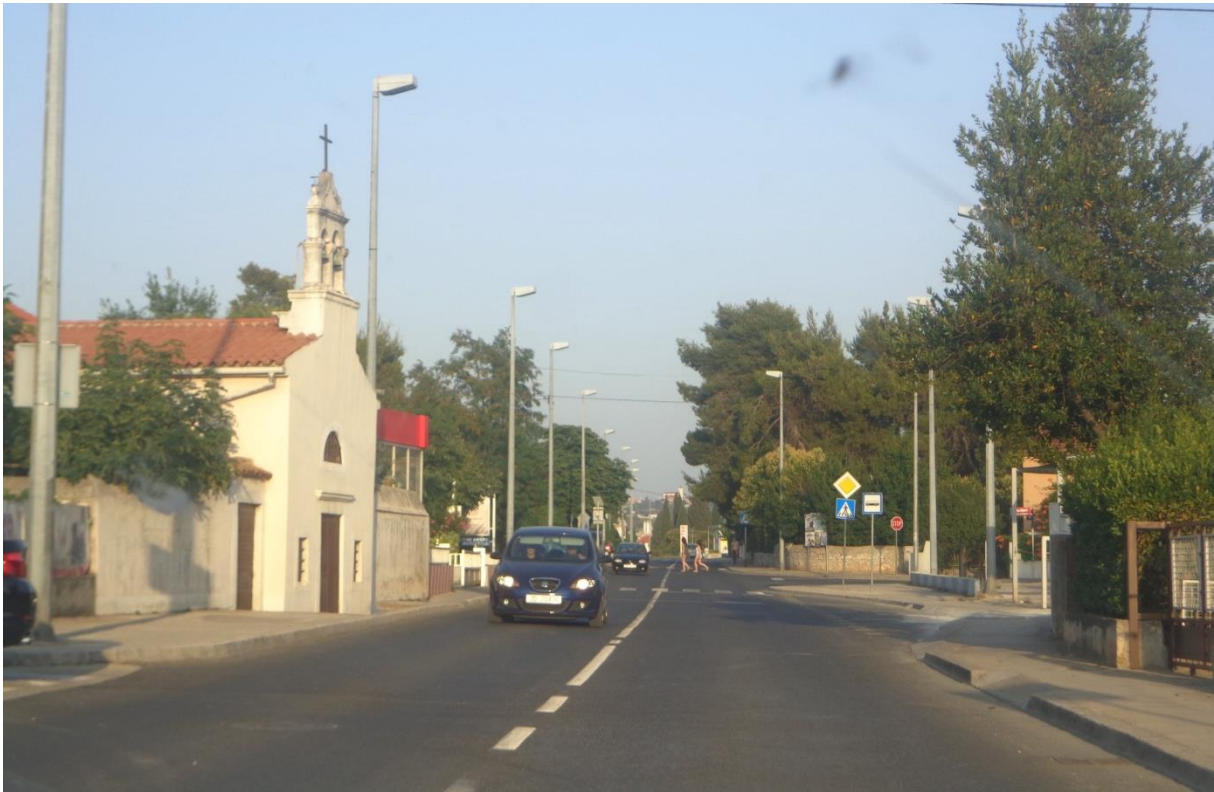
Slika 18: Ulica Franka Lisice