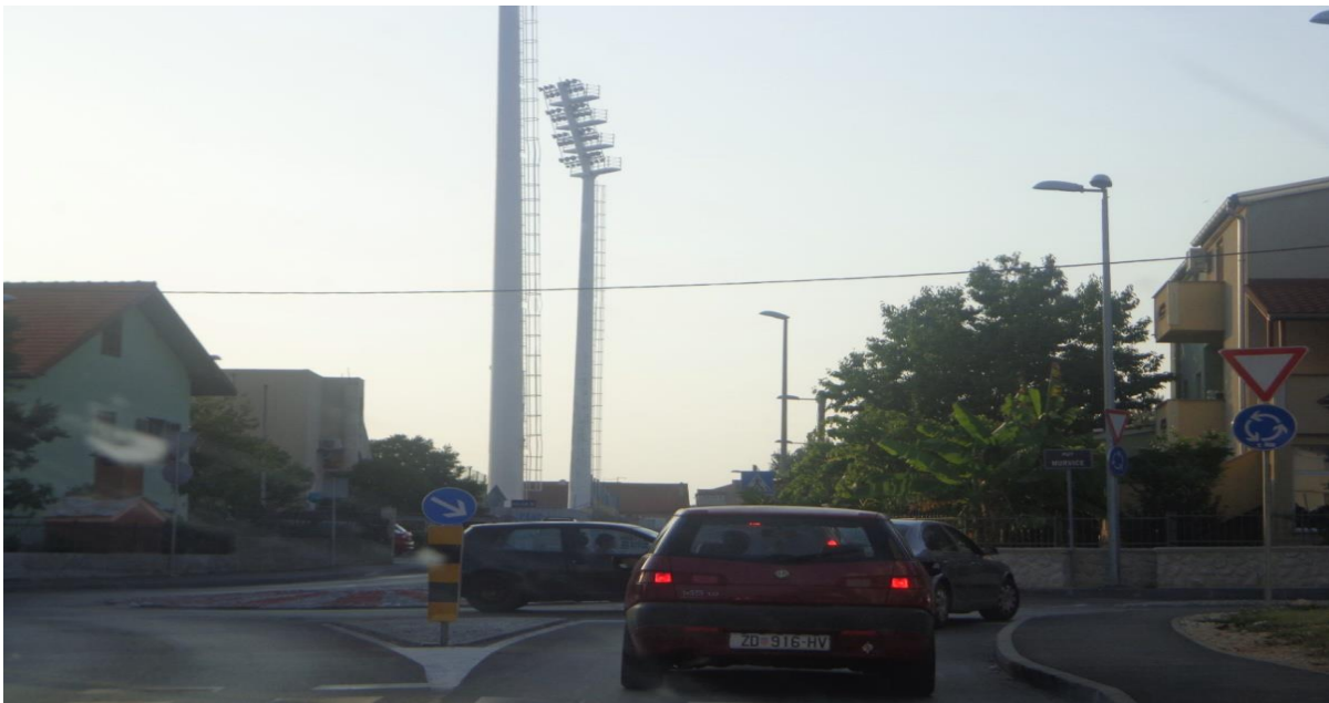
Slika 17: Raskrižje Ćustićeve s Put Murvice (rasterećenje ulice dr. Franje Tuđmana)

Iz priložene slike se vidi da je usmjeravanje prometa odvojeno u više prometnih trakova, odnosno ne izgleda kao raskrižje koje je nedovoljno za veći grad poput Zadra. U ulica dr. Franje Tuđmana je zbog velikog kapaciteta prometa koji gravitira na ovu gradsku prometnicu stanje je takvo. ŽC 6015 (Benka Benkovića, Oreškovićeve, Stadionska, Ćustićeva), sabire promet iz pristupnih ulica te pomaže rasterećenju ulice dr. Franje Tuđmana sa kojom je paralelna, i odvozi ga prema D407 na ulicu Ante Starčevića (slika 17).