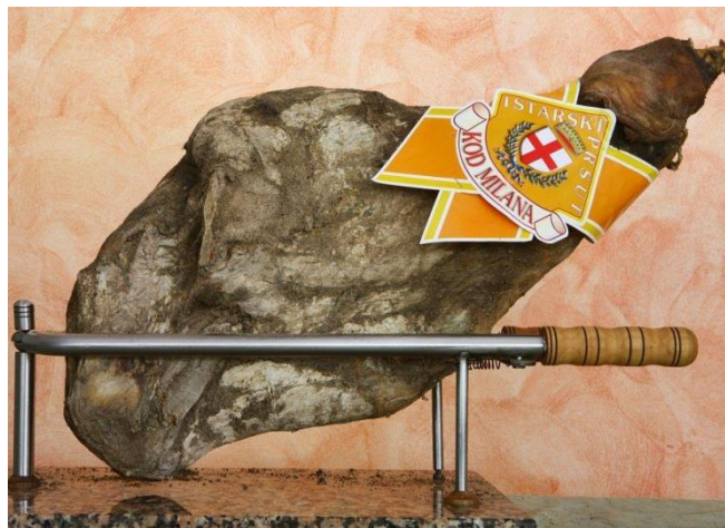
Slika 5. Istarski pršut

Istarski pršut , koji je zaštićen oznakom ZOI, još je jedan primjer proizvoda koji igra važnu ulogu u očuvanju tradicionalnih metoda proizvodnje. Ovaj pršut se suši na zraku, bez dimljenja, i karakterizira ga poseban okus koji se dobiva dugotrajnim sušenjem na bura vjetru. Istarski pršut je nezaobilazan dio istarske gastronomske ponude i redovito se promovira na lokalnim sajmovima i festivalima (Vitez, 2020).