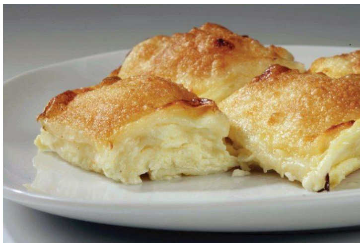
Slika 2. Zagorski štrukli zaštićeni oznakom zemljopisnog podrijetla

U središnjoj Hrvatskoj su osobito poznati Zagorski štrukli . Štrukli su jelo od tankog tijesta punjenog svježim sirom. Mogu kuhati ili peći, a obično se poslužuju s vrhnjem i prženim krušnim mrvicama (Slika 2). Ovaj jednostavan, ali izuzetno ukusan specijalitet često se poslužuje u posebnim prilikama. Purica s mlincima je u središnjoj Hrvatskoj tipično jelo za blagdane i slavlja. Pečena purica poslužuje se s mlincima, tradicionalnim sušenim tijestom koje se kratko prokuha i prelije sokom od pečenja (Barbieri, 2009).