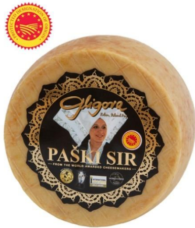
Slika 6. Paški sir