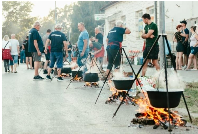
Slika 7. Festival fišijada