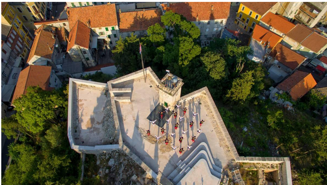
Slika 4. Utvrda Kamičak iz ptičje perspektive