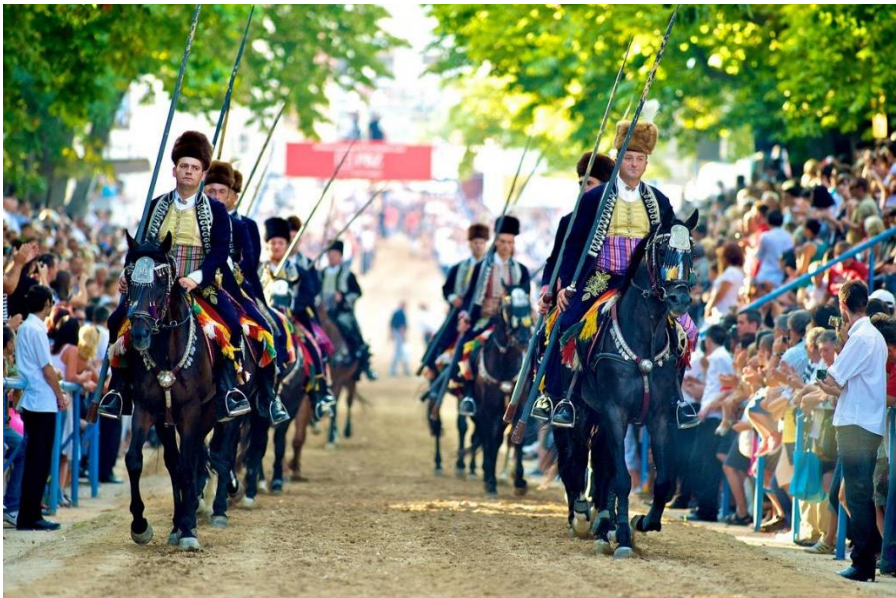
Slika 2. Sinjski Alkari