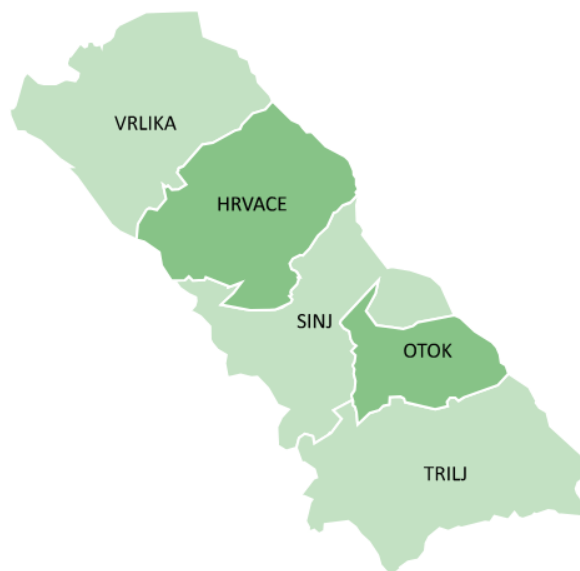
Slika 1. Prostorni smještaj Cetinske krajine