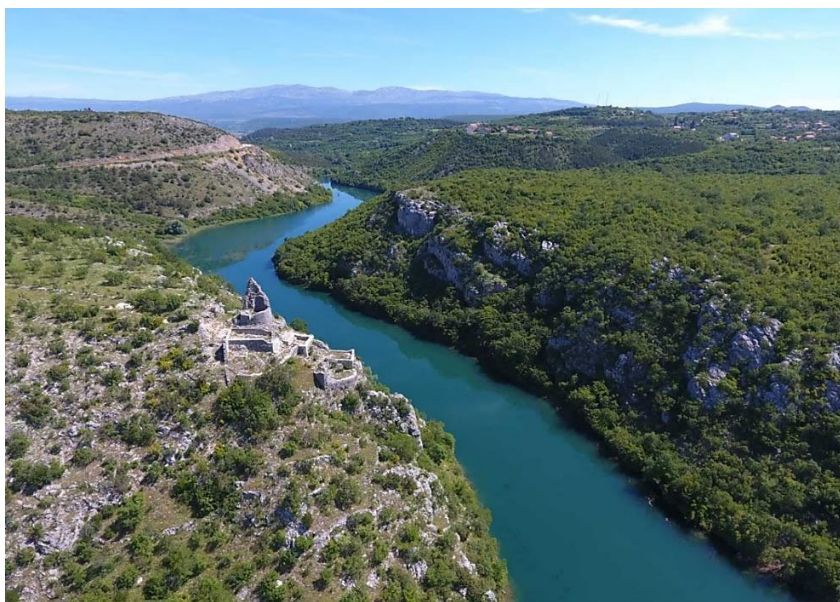
Slika 5. Utvrda Nutjak