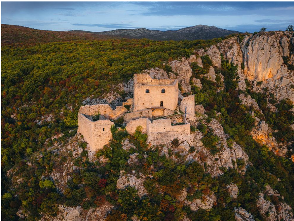
Slika 6. Tvrđava Prozor