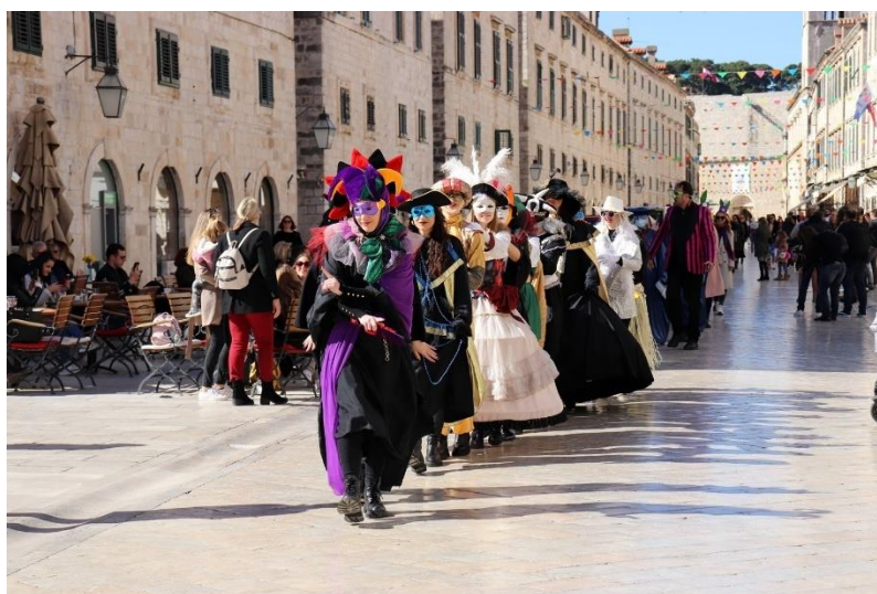
Slika 12. Dubrovački karnevo (karneval)