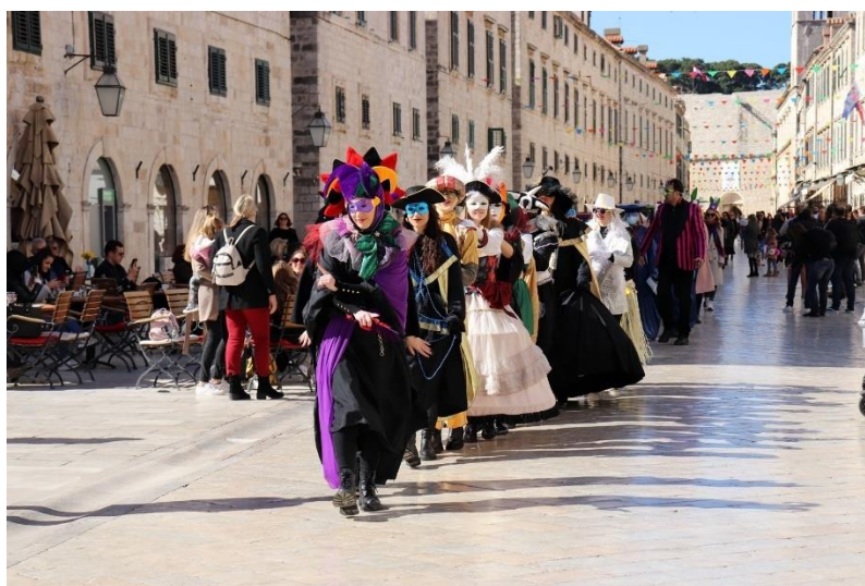
Slika 12. Dubrovački karnevo (karneval)