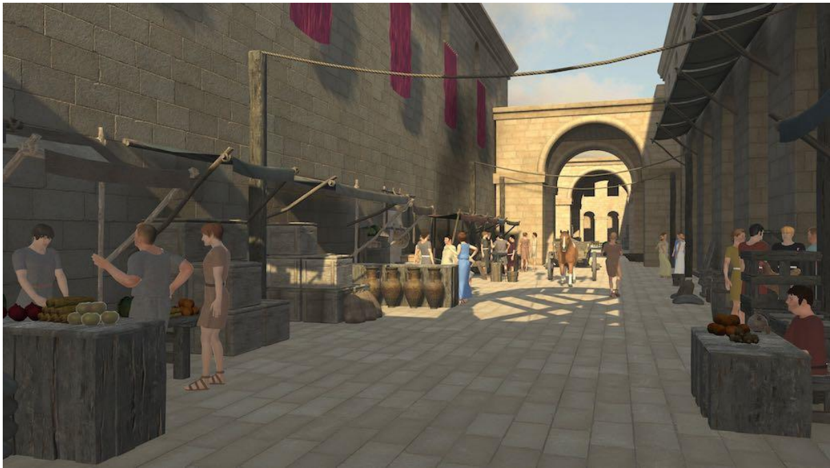
Slika 3 Prikaz lokacija virtualne šetnje Dioklecijanovom palačom