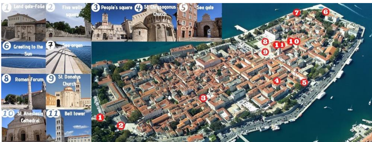
Slika 2 Prikaz lokacija virtualne šetnje u Zadru