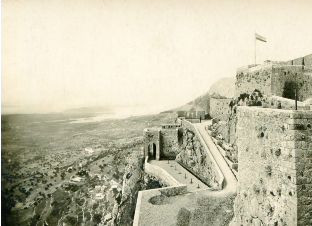
Slika 5. Tvrđava Klis- povijest