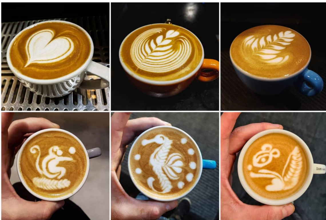
Slika 3. Različiti latte art dizajni

Kava sa latte art dizajnom predstavlja umjetničko djelo u šalici. Latte art je način da se napitci od kave istaknu kroz jedinstvene i privlačne dizajne. Iako latte art može biti teško za naučiti, ovo je vještina koju zaista vrijedi savladati. Baristi koriste latte art kako bi iskazali svoju kreativnost u radu. Postoje bezbrojne mogućnosti dizajna kod latte arta. Osnovni i najjednostavniji latte art dizajni su jabuka i srce, a zatim tulipan i rozeta. Malo zahtjevniji dizajn je labud, a zatim i majmun, morski konjic, zec, vjeverica i slično (Esquires Coffee, 2024).