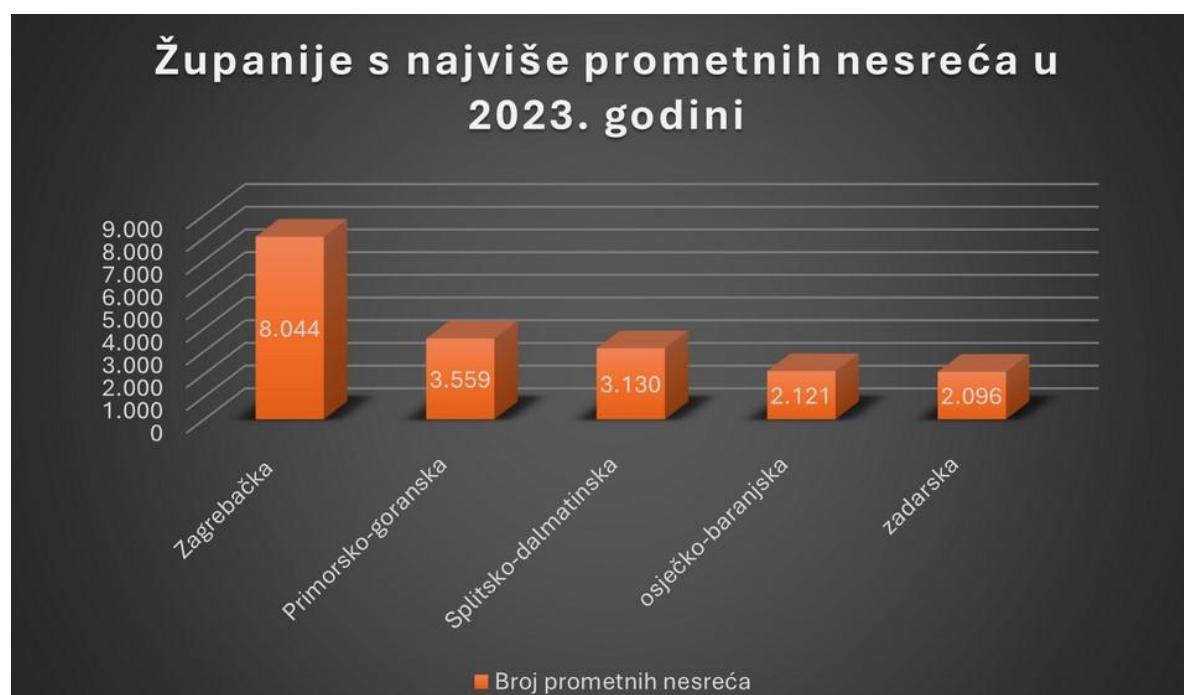
Slika 2. Županije s najviše prometnih nesreća u 2023. godini

Prometne nesreće su neizbježan dio prometa i uzrokuju osobne tragedije te značajne socijalne i ekonomske troškove. Mediji nas svakodnevno izvještavaju o prometnim nesrećama, posebno onima s poginulim i ozlijeđenim sudionicima. U razdoblju od 2008. do 2017. godine na hrvatskim cestama prosječno se dogodilo 39.294 prometnih nesreća godišnje, a stradavalo je prosječno 17.456 osoba godišnje. Najugroženiji sudionici su djeca, mladi, biciklisti, pješaci, motociklisti i mopedisti. Na globalnoj razini, godišnje u prometnim nesrećama pogine 1.300.000 ljudi, dok 50.000.000 bude ozlijeđeno. Predviđa se da će do 2030. godine prometne nesreće postati peti uzrok smrtnosti ako se trendovi nastave. Stoga je nužno poduzimati pravodobne mjere za smanjenje broja nesreća i njihovih posljedica te povećanje sigurnosti svih sudionika u prometu. 12