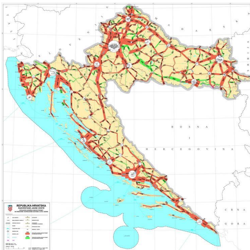
Slika 1. (Razvrstana cestovna mreža u 2018. godini), Izvor: https://mmpi.gov.hr/infrastruktura/prometna-infrastruktura-137/137 , preuzeto 17.6.2024.

Investiranje u gradnju nove prometne infrastrukture jedan je od ciljeva održivog razvoja. Nadziranje napretka prometne infrastrukture bazira se na analizi kvalitete prometnih usluga.