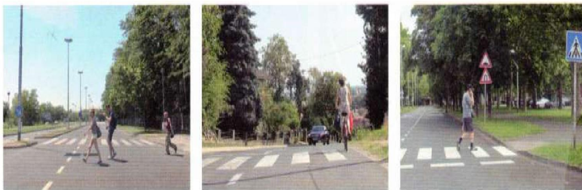
Slika 6. Prometna kultura među sudionicima prometa

Način na koji sudionici komuniciraju i sporazumijevaju se u prometu odražava njihov međusobni odnos, poznat kao prometna kultura. Različite situacije u prometu utječu na ponašanje sudionika i njihovu interakciju s drugima. Solidarnost, uzajamno poštovanje i procjena ponašanja drugih sudionika ključni su za sigurno sudjelovanje u prometu.