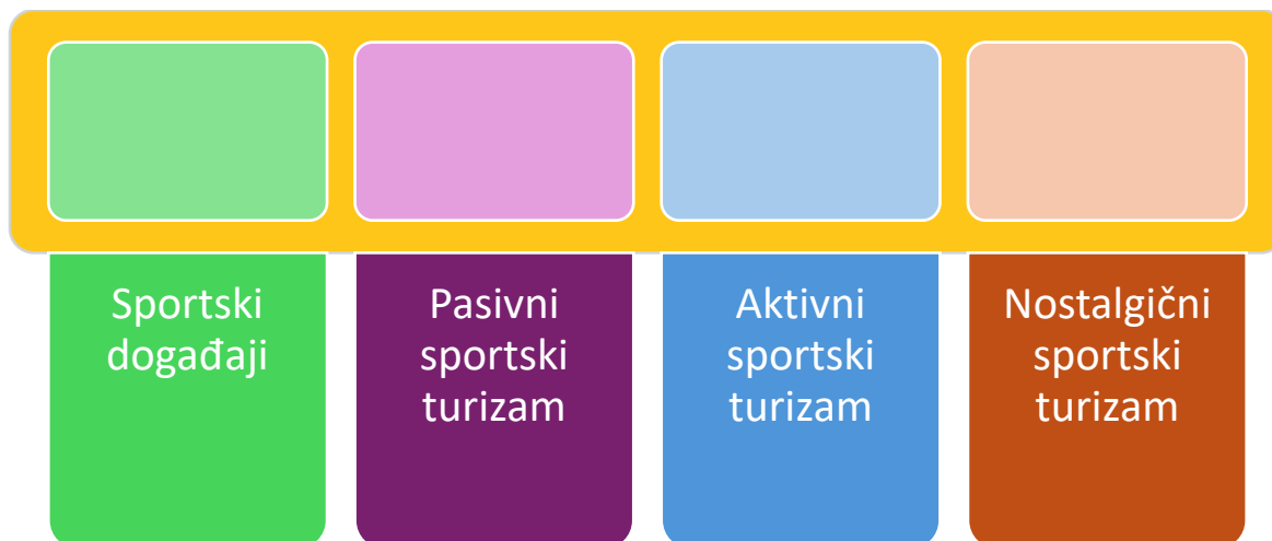
Slika 2. Sportski turizam prema načinu sudjelovanje

Prema: Dobrota, A (2023). Sportski turizam - zašto se o njemu toliko priča? https://www.cimerfraj.hr/ideje/sportski-turizam