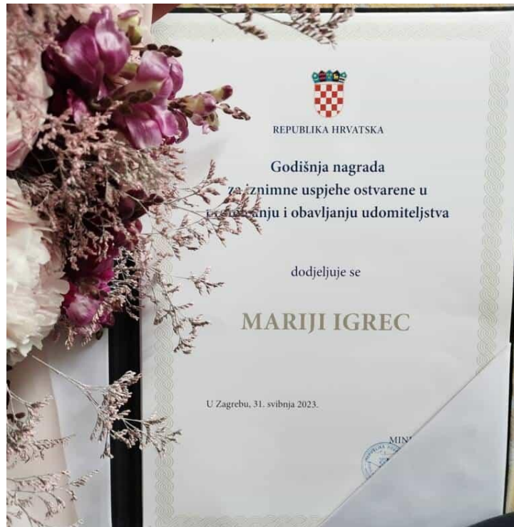
Slika 6. Godišnja nagrada za iznimne uspjehe ostvarene u promicanju i obavljanju udomiteljstva

osobno ime i potpis ministra te pečat Ministarstva, pri čemu visina Godišnje nagrade iznosi 663,00 eura, a visina Nagrade za životno djelo 1325,00 eura. 63