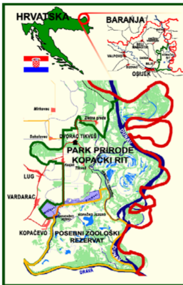
Slika 2. Geografski položaj parka prirode Kopački rit.