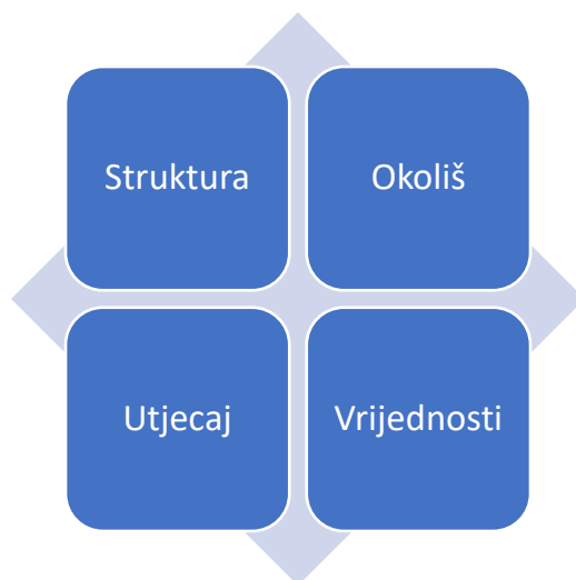
Slika 1. Dijamant civilnog društva