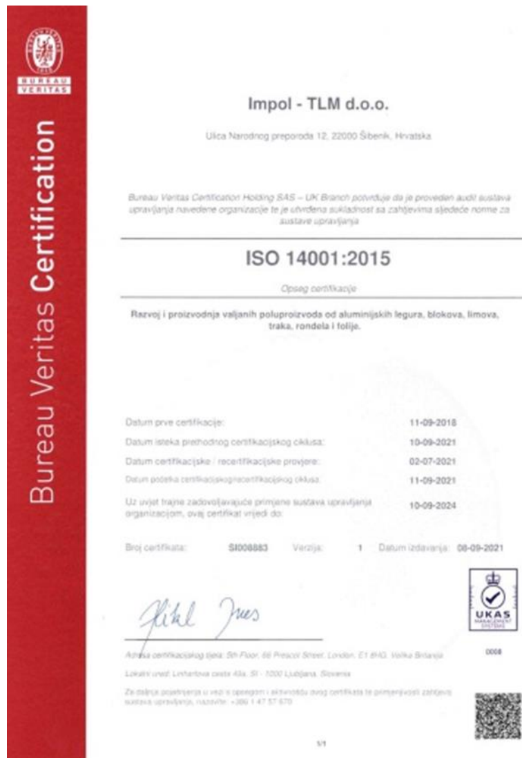
Slika 4. Iso 14001 certifikat firme