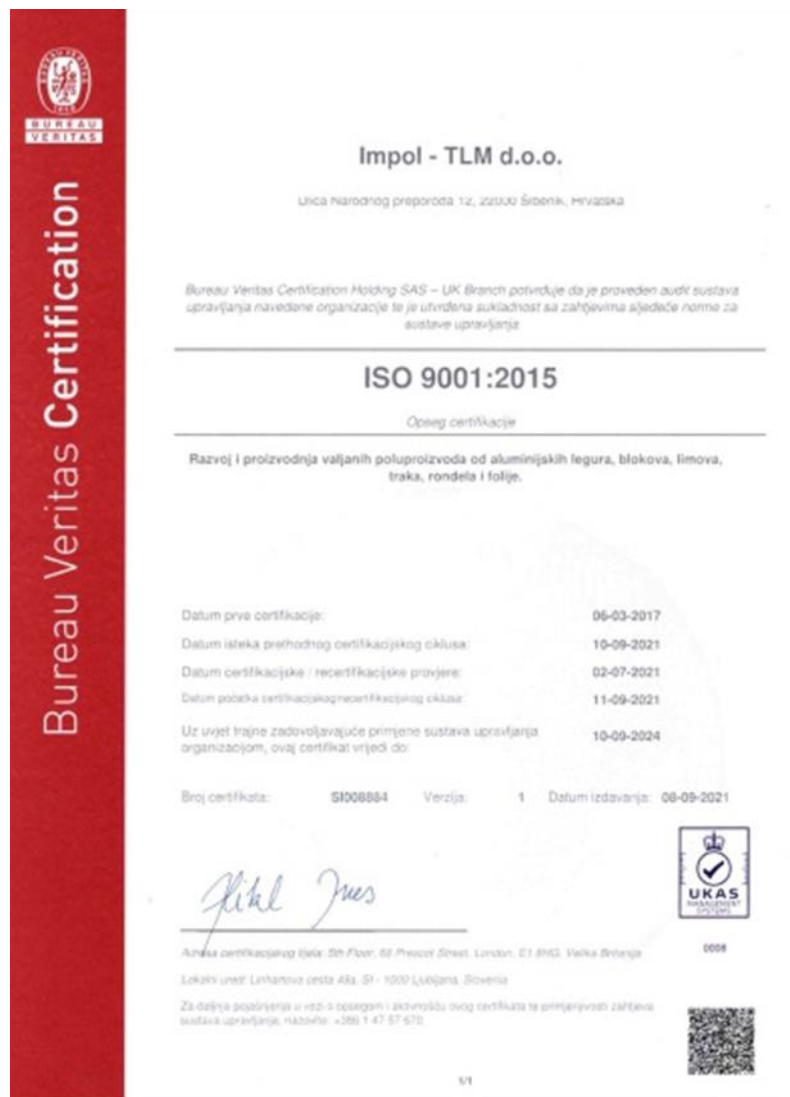
Slika 2. Iso 9001 certifikat firme