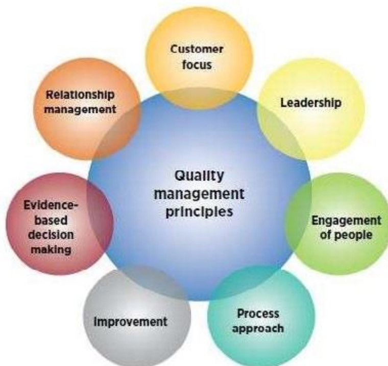
Slika 1. Sedam načela upravljanja kvalitetom