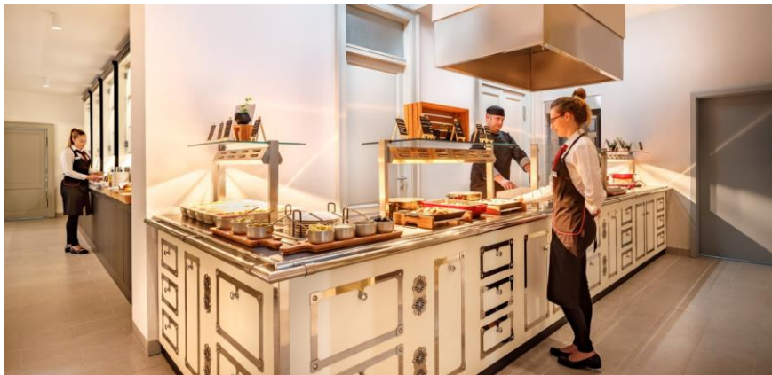
Slika 10. Gastro ponuda hotela Heritage Hotel Imperial

Sljedeći je obrok marena, koja se jede između 10 i 11 sati za koji se poslužuje fritaja s pršutom ili domaće kobasice, a nerijetko i sir i pršut te luk i kruh. Slijedi obed ili obid za vrijeme kojega se poslužuje gusta juha koja se naziva prema svom osnovnom sastojku (maneštra od bobiči, od koromača, od slanica). Također, specifičan je i grah s ječmenom kašom i kiselim kupusom, a svim se jelima dodaje začini imena pešt (mješavina sitno isjeckanog peršina, češnjaka i slanice). Uz ova se jela poslužuje razne salate, a najpoznatije su salata od mahuna (mošnjice na salatu) ili tikvica (cuketi na salatu) (Randić i Rittig-Beljak, 2006).