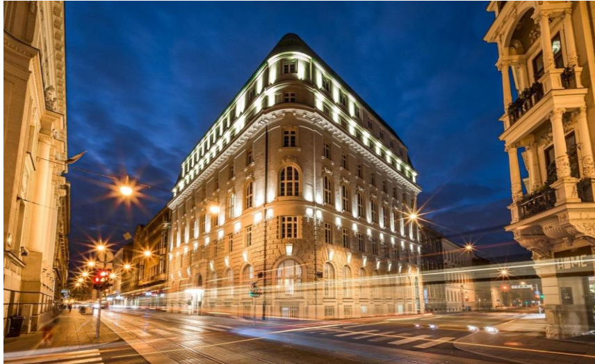
Slika 11. Amadria Park Capital