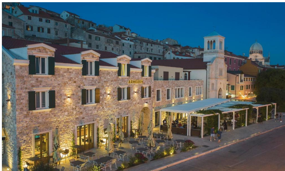
Slika 18. Armerun Heritage Hotel

Armerun Heritage Hotel smješten je ispod povijesnih bedema grada Šibenika s atraktivnim pogledom na Šibenski kanal i zalaske sunca gdje se rijeka Krka ulijeva u Jadransko more. Ovaj je hotel obnovljeni dominikanski samostan iz 17. stoljeća, a nalazi se 550 metara od gradske plaže Banj, a nudi smještaj s restoranom, besplatnim privatnim parkingom, barom i terasom. Među sadržajima ovog objekta su posluga u sobu i bankomat, kao i besplatni WiFi u cijelom objektu (Armerun, 2022).