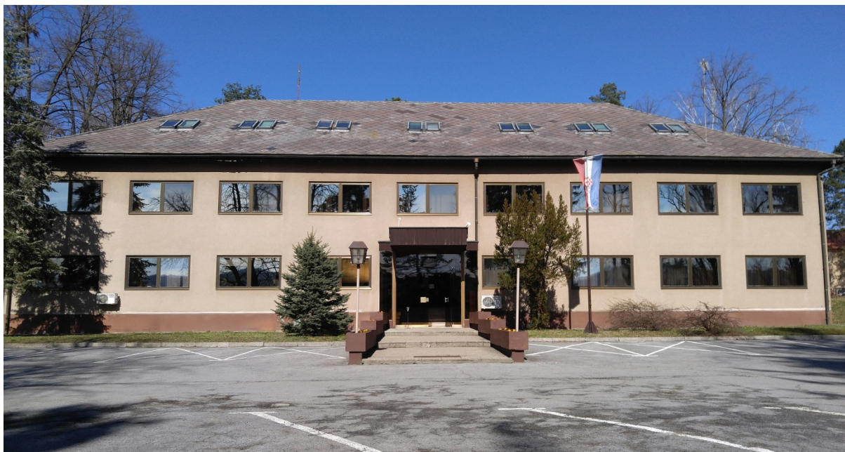
Slika 2. Odgojni zavod u Požegi