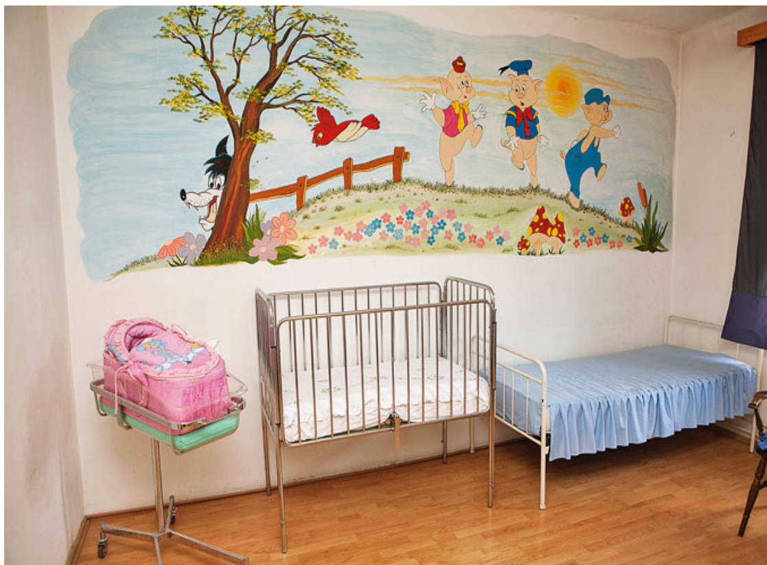
Slika 7. Odjel za roditelje u Kaznionici u Požegi

uređena, na raspolaganju su igračke i ostali didaktički materijali. 103