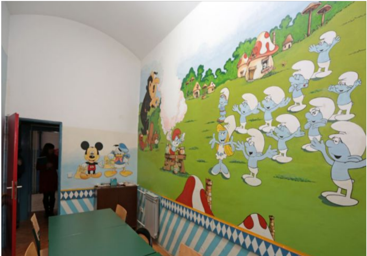
Slika 6. Soba za djecu u Kaznionici u Šibeniku 2