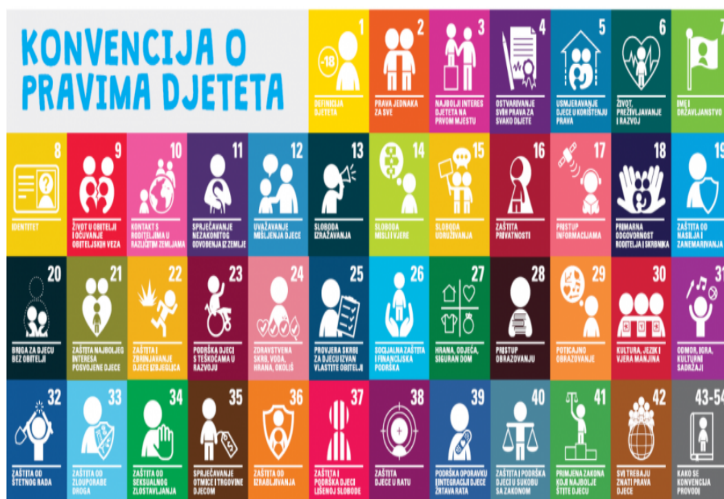
Slika 1. Konvencija o pravima djeteta

Sljedeći vrlo važan dokument koji se bavi pitanjima zaštite djece i njihovih prava jest Konvencija o pravima djeteta. Pristupanjem Konvenciji, Republika je Hrvatska postala jedna od onih naprednih zemalja koje su se obvezale na osiguranje i zaštitu prava i temeljnih sloboda ljudi.