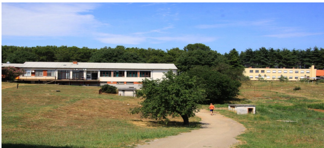
Slika 4. Kaznionica u Valturi

Osim navedenih kaznionica, maloljetnici mogu svoju kaznu izdržavati i u kaznionici u Valturi. Ova je kaznionica jedina kaznionica otvorenog tipa u Republici Hrvatskoj što znači da nema zidova, žice i ograde, klasične ćelije.