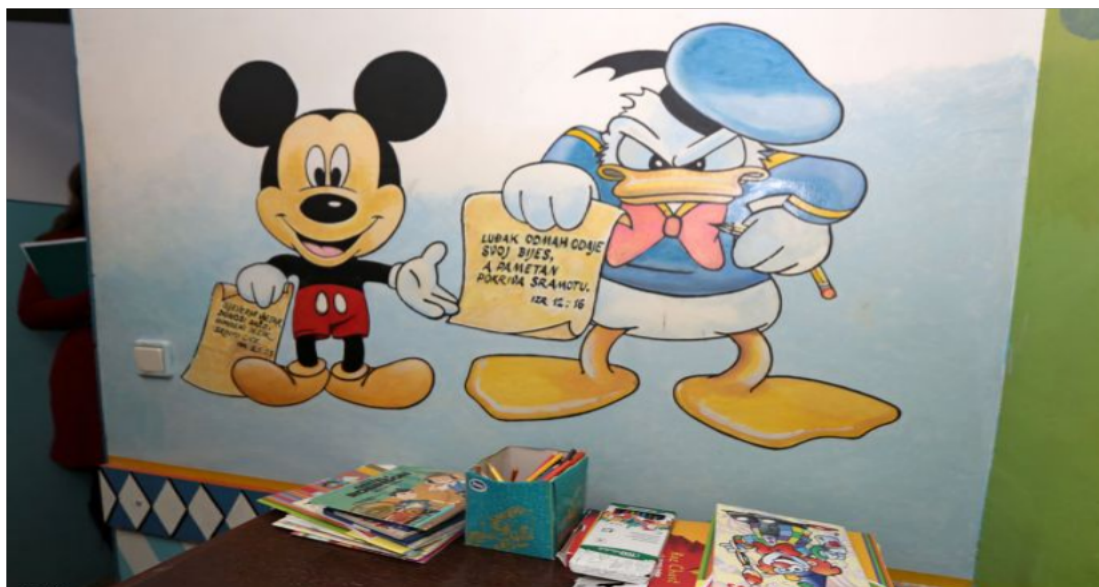
Slika 5. Soba za djecu u Kaznionici u Šibeniku