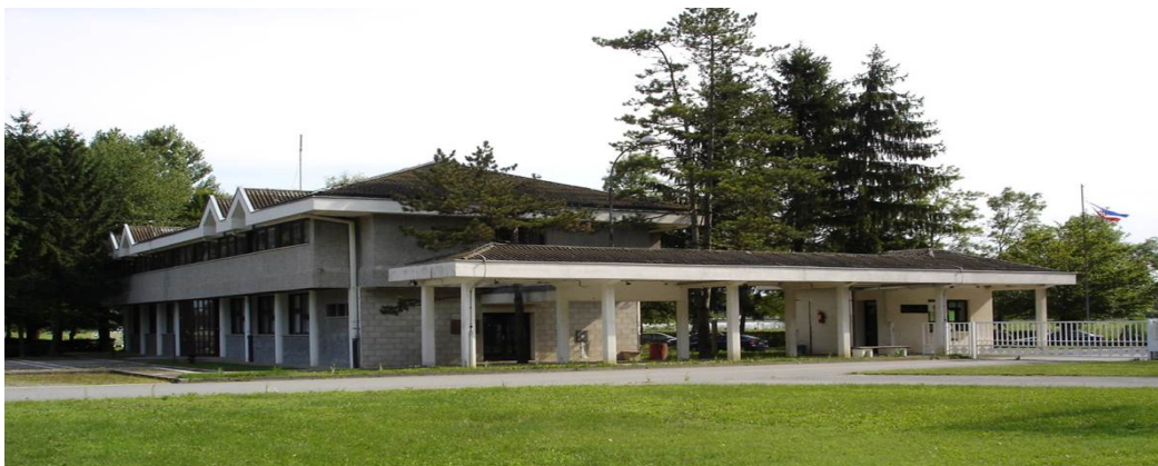
Slika 3. Odgojni zavod u Turopolju