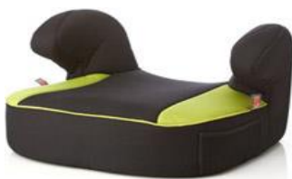
Slika 7. Vrste Booster podložaka Izvor: Booster Cushions | Child Car Seats (15. 04. 2021.)