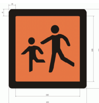
Slika 8. Znak za obilježavanje autobusa koji se prevoze djeca

Prema Zakonu o odgoju i obrazovanju u osnovnoj i srednjoj školi za učenike nižih razreda koji žive u naseljima koja su udaljena od škole više od 3 kilometra, te za učenike od 5. do 8. razreda koji žive u naseljima udaljenima od škole više od 5 kilometara potrebno je organizirati prijevoz na relaciji kuća – škola i obratno. U slučajevima kada djeca žive u naseljima gdje ne postoji javni prijevoz, tada ga je potrebno organizirati bez obzira na udaljenosti između kuće i škole. Na prednjoj vanjskoj i stražnjoj lijevoj strani školskog autobusa mora se nalaziti retro-reflektirajući znak prikazan na Slici 8. koji govori da je riječ o autobusu za prijevoz djece. 24