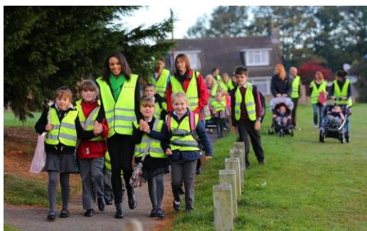
Slika 9. Hodajući školski autobus

Uspjeh hodajućeg školskog autobusa ovisi o udaljenosti između mjesta stanovanja i škole, te mogućnosti o neodgovarajućoj prometnoj infrastrukturi koja bi spriječila postojanje sigurnih ruta do škola i obratno (Slika 9.). Sami program „Hodajući školski autobus“ ne bi trebao započeti dok se ne definiraju rute od škole do kuće i obratno.