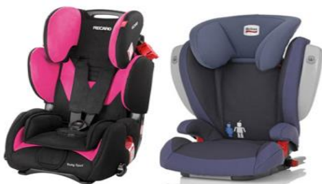
Slika 6. Booster sjedala s potporom za leđa Izvor: Booster Seats | Child Car Seats (15. 04. 2021.)