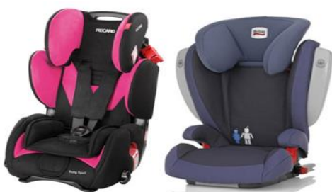
Slika 6. Booster sjedala s potporom za leđa Izvor: Booster Seats | Child Car Seats (15. 04. 2021.)