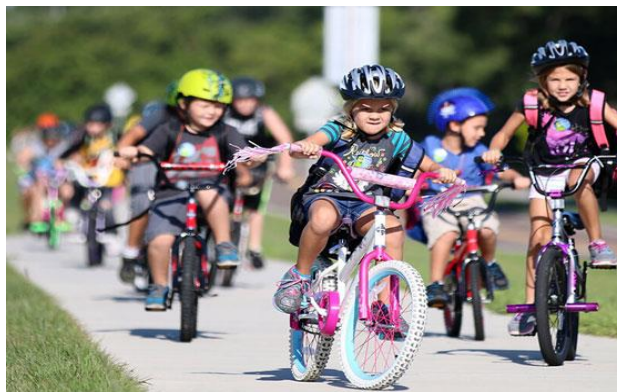
Slika 2. Pravilno korištenje bicikla