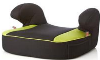
Slika 7. Vrste Booster podložaka Izvor: Booster Cushions | Child Car Seats (15. 04. 2021.)