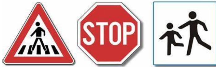
Slika 1. Prometni znakovi

prometnim znakovima (Slika 1.) koje pronalazi u blizini škole, te na relaciji između kuće i obrazovne ustanove ( u ovom slučaju škole). 12