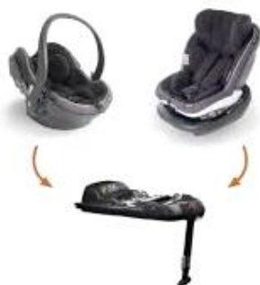
Slika 4. Prikaz dječjih auto-sjedalica s postavljanjem suprotno smjeru vožnje