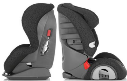
Slika 5. Dječje auto-sjedalice s postavljanjem u smjeru vožnje