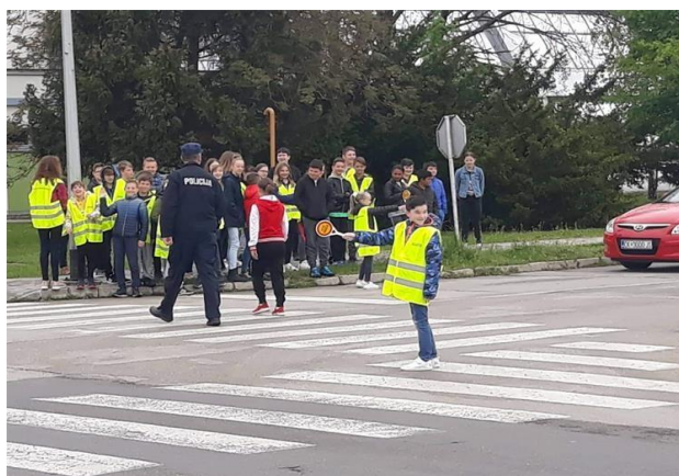
Slika 10. Primjer školske prometne jedinice

Školsku prometnu jedinicu vodi učitelj, dok je školska prometna jedinica organizirana od strane policijske uprave koja odlučuje o tome postoji li potreba za školskom prometnom jedinicom (organiziranje školske prometne jedinice nije obavezno!). Svrha pripadnika školske prometne jedinice u trenutku prijelaza djece na zebri je da zaustavi automobile i sva druga motorna vozila koja se kreću po pravcu gdje se nalazi pješački prijelaz, na način da stoji uz pješački prijelaz u reflektirajućoj odori. Koristeći pločicu sa znakom stop ograničava kretanje motornih vozila, te na takav način omogućuje sigurno kretanje djece po pješačkom prijelazu. 29