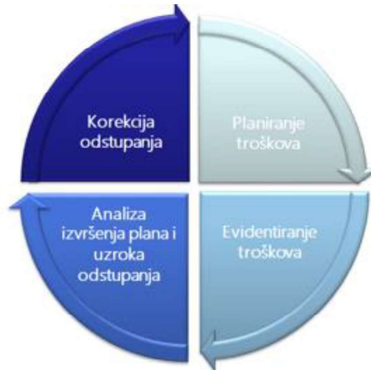
Slika 6. Proces upravljanja troškovima