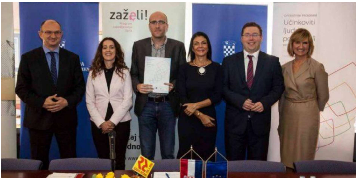
Slika 11. Udruga Mladi u EU na potpisivanju Ugovora o dodjeli bespovratnih sredstava u sklopu natječaja Zaželi