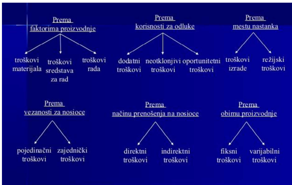
Slika 1. Opći prikaz vrste troškova