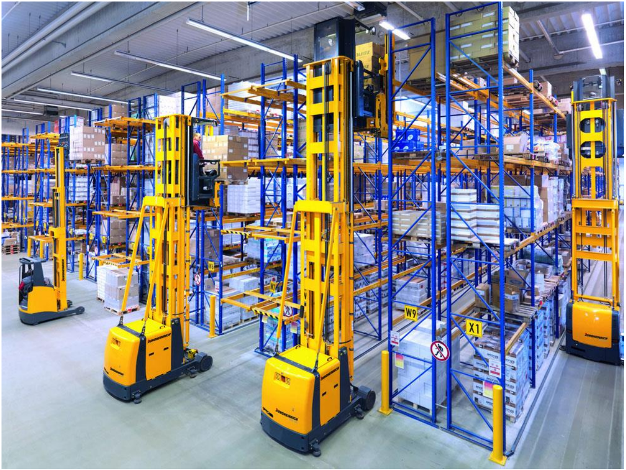
Slika 32. Visokoregalni viličari u uskoprolaznim skladištima

Prilikom pretovara tereta u vozila vanjskog transporta razvijen je sustav SavantLoader koji omogućava automatski vođenom viličaru sposobnost ulaska u prikolicu kamiona bez ikakvog ručnog upravljanja na način da se prilagođava duljini prikolice, obliku i popunjenosti. Osim toga, sustav automatski prepoznaje kut prikolice i prilagođava se svakom položaju. Sustav za navođenje vozila omogućava navođenje i dostavu paletizirane robe u prikolicu, a aktualne su izvedbe s jednostrukim i dvostrukim parom vilica (Slika 33.), s visinom dizanja i do 2,8 metra. Takav viličar može podići i voziti do željenog mjesta dvije palete odjednom. Prednosti kod ovakvih viličara su brže obavljanje posla i kraći period utovara (Kuliš, 2013., str. 59).