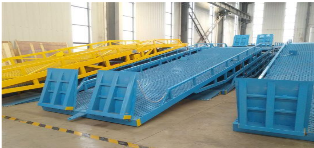
Slika 19. Utovarno/istovarne rampe u skladištu

Neka se skladišta grade na način da kamioni i vagoni ulaze u zgradu skladišta. Ako teretni prostor vozila nije u ravnini tla skladišta moraju se ugraditi rampe unutar skladišta ili na ulaz u skladište (Slike 19. i 20.).