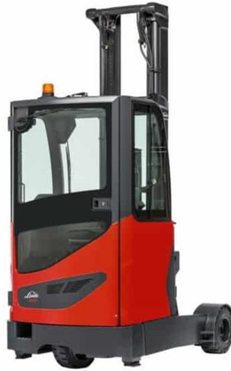
Slika 10. Regalni viličar