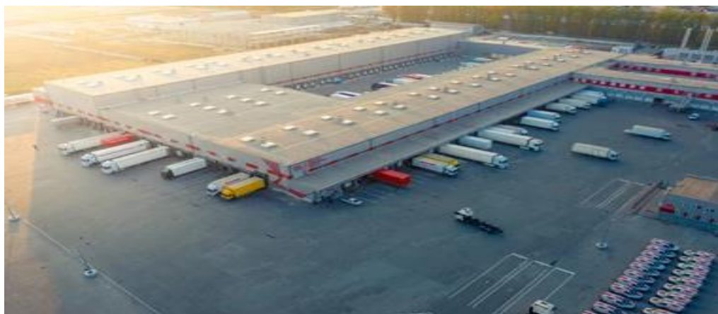
Slika 28. Parkiralište kod skladišta

Kod lučkih skladišta postavlja se nekoliko cestovnih priključaka zbog velikih dimenzija skladišnog prostora. Spoj skladišta s cestom ostvaruje se odvojkom koji se, kod skladišta s velikim prometom (sto ili više kamiona dnevno), ostvaruje jednostavnom petljom i jednim nadvožnjakom. Kod manjeg prometa, priključak na prometnicu odvija se pomoću običnog odvojka pod pravim kutom i proširenjem prometne trake. Neposredno prije ulaska u skladišni kompleks, mora postojati uređeno parkiralište (Slika 28.) na kojemu se prihvaćaju teška vozila, kamioni, prikolice i tegljači. Takvo parkiralište mora raspolagati s potrebnim kapacitetom kako bi se mogla smjestiti sva vozila u skladišnom kompleksu.