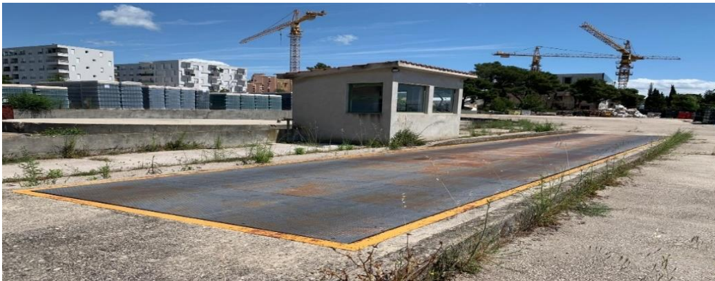
Slika 17. Kolska vaga za kontrolu pri odlasku robe iz skladišta, Izvor: vlastita izrada autora

U svakom skladištu vrlo važnu funkciju imaju i sredstva za određivanje težine i dimenzija , tj. sredstva za vaganje i mjerenje. Sva roba koja ulazi i izlazi iz skladišta mora se mjeriti, vagati i brojati (ovisno o vrsti robe) zbog čega skladišta moraju imati odgovarajuće uređaje za mjerenje. Vage su sredstva za vaganje i one mogu biti mehaničke, elektronske ili kombinirane, a vaganje može biti pojedinačno ili serijsko. Osim u samim skladištima, uz njih stoje vage za mjerenje mase kamiona zajedno s teretom. Sve širom upotrebom računala i računalne tehnologije, vage postaju ključni i neophodno element u funkciji transporta i skladištenja jer omogućavaju utvrđivanje težine, ali i usporedbu težina svih pošiljki. Kolska vaga (Slika 17.) čini neizostavan dio svakog industrijskog procesa jer se koristi za mjerenje količine robe prilikom ulaska i izlaska iz skladišta te je vrlo važan segment pri dobivanju brzih i točnih informacija neophodnih menadžmentu za donošenje poslovnih odluka.