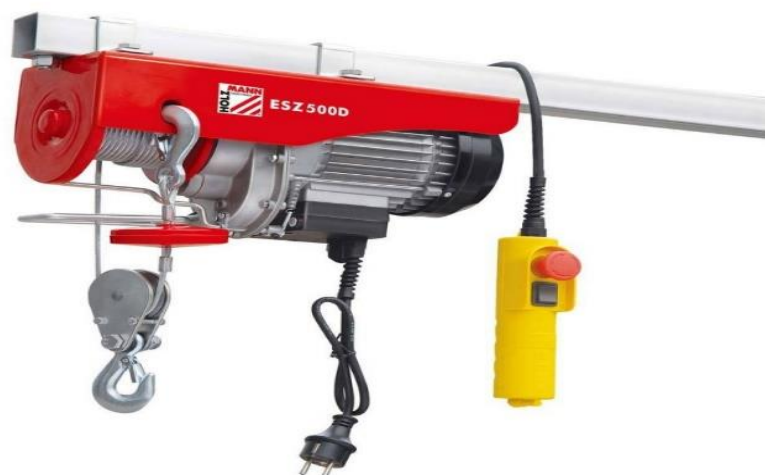
Slika 3. Električna dizalica, Izvor: https://www.trgovina-ekstra.hr/hr/elektricna-dizalica-500kg-esz500d-230v-holzmann-maschinen

Prema vrsti pogona koji koriste, dizalice mogu biti ručne i motorne. U današnje se vrijeme ručni pogon vrlo rijetko koristi te je motorni pogon široko rasprostranjen. Motorni pogon može biti izveden raznim motorima s unutrašnjim izgaranjem, elektromotorima, parnim strojem itd. zbog čega se razlikuju električne, parne, hidraulične i pneumatske dizalice. Najviše korištena je električna dizalica (Slika 3.) jer ima mnogo prednosti poput jednostavnog rukovanja, male težine, ekonomičnosti, brze spremnosti za rad i slično.