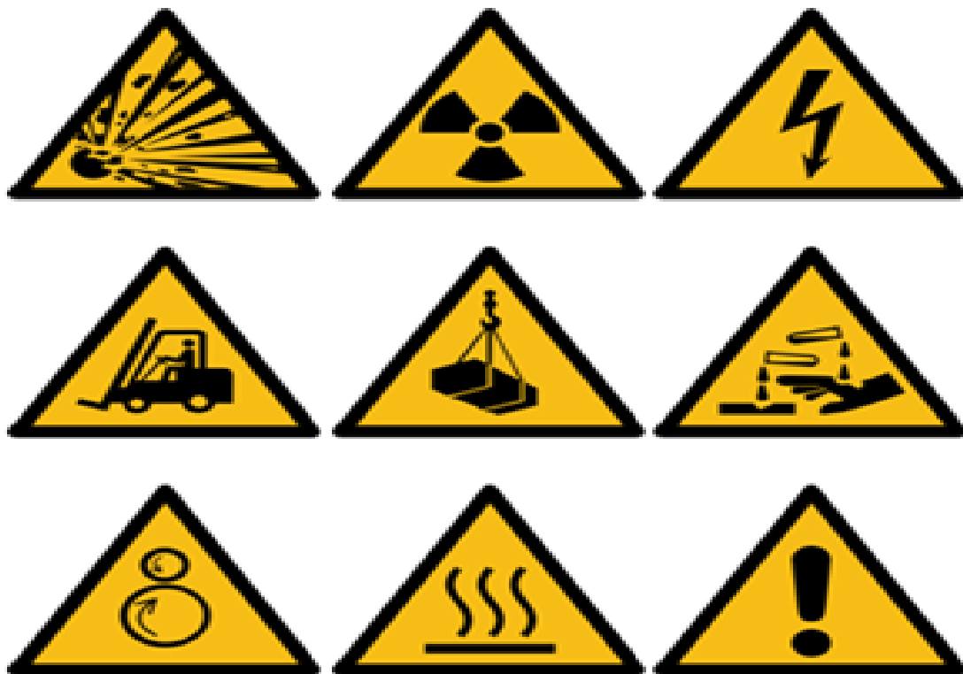
Slika 25. Znakovi opasnosti u skladištu, Izvor: https://www.czs.hr/hr/znakovi

Zaštita robe u skladištu zahtijeva razrađeni protupožarni sustav. Naime, skladišta su objekti koji su u velikoj mjeri izloženi opasnosti od požara zbog raznih uzroka. Tako su neki od najčešćih uzroka požara u skladištima posljedice nepažnje i propusta, nereda, nediscipline, pušenja, neispravnih električnih instalacija i uređaja itd. Štete od požara pretežno su velike jer se požar vrlo brzo širi i zbog toga u svakom skladištu mora postojati protupožarna zaštita. Zbog toga je važno u svakom skladištu imati odgovarajuće znakove opasnosti (Slika 25.).