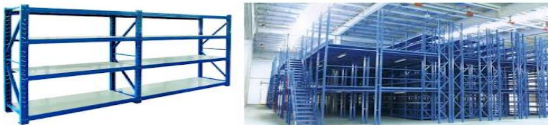
Slika 15. Stalci u skladištu

Kutije za skladišta (Slika 16.) koriste se za spremanje i izlaganje robe u skladištima, a ima ih raznih boja i dimenzija. Naime, kombiniranjem boja moguće je pregledno skladištenje različitih grupa roba. Također, proizvodi su izrađeni od vrlo otpornog termoplastičnog materijala koji nije štetan za okolinu jer se može reciklirati (PREPLAM, 2021).