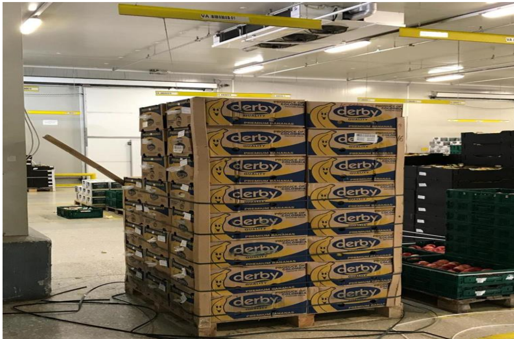
Slika 29. Palete s robom u skladištu

Svaki SIELager osigurava učinkovito upravljanje skladišnim poslovanjem jer optimizira poslovne procese, smanjuje troškove i povećava učinkovitost skladišnog sustava. Temeljni zadaci ovakvog sustava su: zaprimanje, evidencija i izdavanje robe koja je smještena na paletama (Slika 29.). Svaka se identifikacija paleta obavlja bar-kodom čije se očitavanje obavlja ručnim terminalima koji imaju laserski čitač bar-koda (Slika 30.). Sustav SIELager podržava komisioniranje robe s unutarnjom organizacijom koja je prilagođena potrebama korisnika.