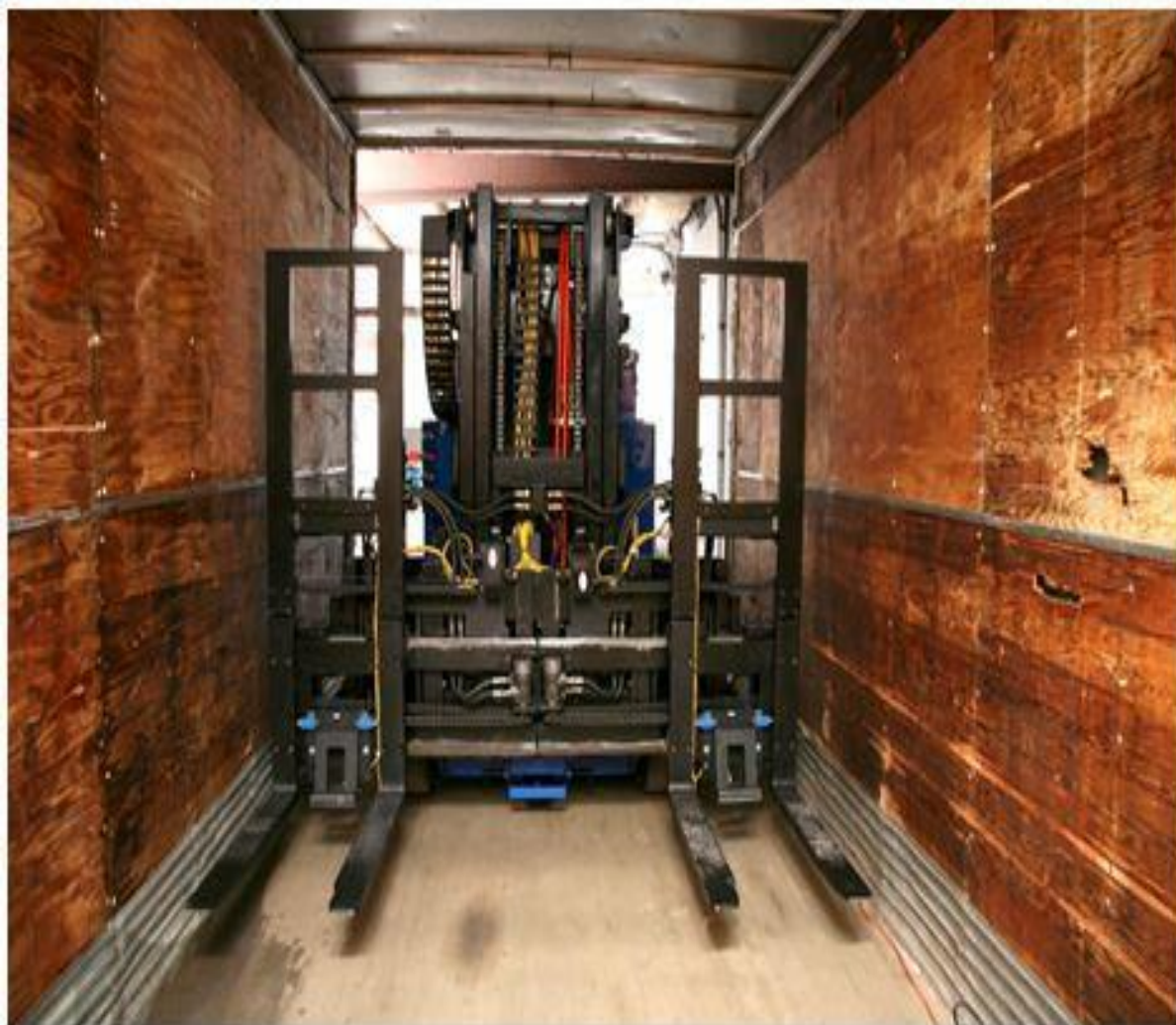
Slika 33. Izvedba automatski vođenog viličara s dvostrukim parom vilica