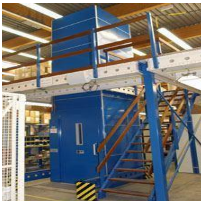
Slika 4. Dizala u skladištu

Dizala (liftovi) su dizalična postrojenja za vertikalni transport ljudi ili tereta koji se prenose u kabini dizala tako što se kreću između najmanje dvije čvrste vodilice te imaju mogućnost zaustaviti se na predviđenim stajalištima. U današnje su vrijeme dizala jako proširena te predstavljaju neophodna postrojenja u stambenim i poslovnim zgradama, hotelima, bankama i ostalim objektima. Dizala također imaju i vrlo važnu ulogu u prijenosu tereta zbog čega su neizostavan dio i u skladištima na kat. Liftovi (dizala) povezuju sve katove skladišta. Dakle, osim putničkih i teretnih, vrlo su važna skladišna dizala. Takva suvremena dizala imaju pogonsku užnicu (u prošlosti je to bio bubanj) i električni pogon. Brzine ovakvih dizala su velike, a broj dizala ovisi o broju katova i površine cijelog skladišta. Svaki kat skladišta mora biti odijeljen vatrogasnim čvrstim zidovima (zbog sigurnosti od požara), a svako odjeljenje mora imati barem dva dizala. Također, prilikom izgradnje, korištenja, ali i održavanja dizala jako je važno postupati sukladno odgovarajućim standardima i propisima. Vertikalna mehanizacija skladišta povezuje katove skladišta zbog čega ne postoji kod prizemnih skladišta. Postoje liftovi za podizanje ili spuštanje paletiziranog tereta (Slika 4.) te liftovi za prijevoz viličara bez tereta (Dundović & Hess, 2007, str. 248 - 249).