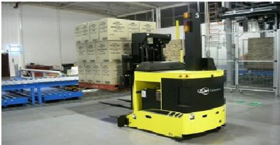
Slika 31. Automatski vođeni viličar

Automatski vođeni viličari (Slika 31.) imaju široku primjenu u suvremenim skladištima, a ovisno o vrsti skladišta, razlikuje se i vrsta viličara koji će se upotrijebiti.