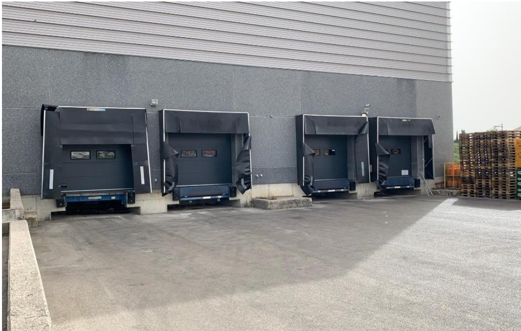
Slika 20. Utovarno/istovarna rampa veleprodajnog centra Velpro u Šibeniku

Bile rampe unutar ili izvan skladišnog prostora, to je vrlo značajna oprema skladišta i vrlo je važno voditi računa o njihovim propisanim dimenzijama, načinima i lokacijama postavljanja.