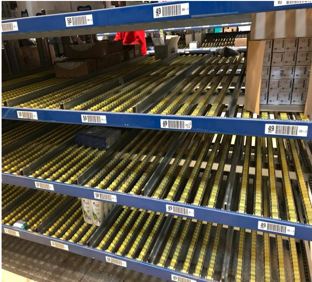
Slika 30. Bar-kod u skladištu, Izvor: vlastita izrada autora

Terminali su stalno povezani s WMS sustavom, i to online vezom, standardnom WLAN mrežom.