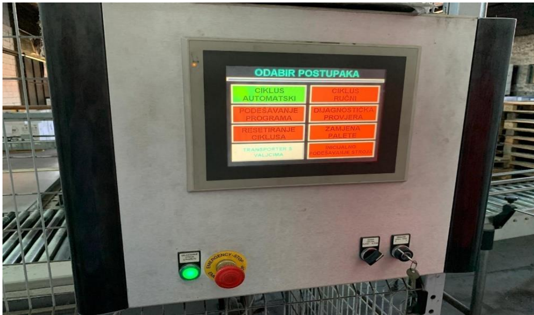
Slika 22. Upravljačka ploča paletizatora, Izvor: vlastita izrada autora