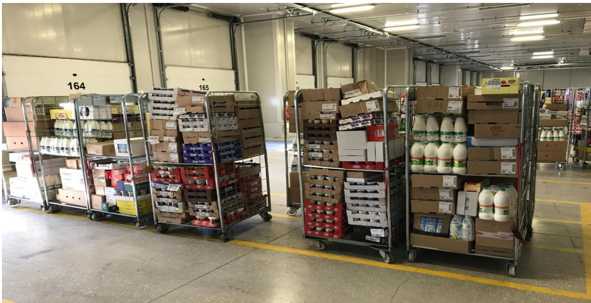
Slika 13. Kolica u skladištu

Primjena kolica u skladištu jednog logističko-distribucijskog centra može se vidjeti na slici 13. gdje se koriste za komisioniranje robe prema zahtjevima prodavaonica različite robe.