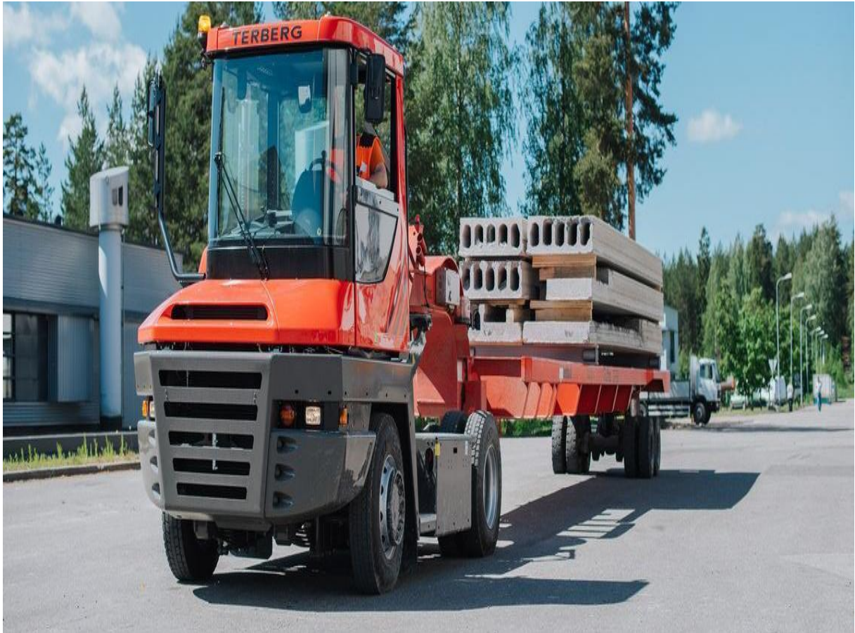
Slika 6. Traktorski tegljač

Traktori tegljači (Slika 6.) se upotrebljavaju u unutarnjem transportu luka i industrijskih pogona za vuču običnih i specijalnih prikolica, a opremaju se različitim namjenskim priključnim strojevima i uređajima. U lukama i industrijskim pogonima za transport robe od skladišta do transportnog sredstva koriste se prikolice koje imaju najčešće osam kotača, a koje vuče tegljač.