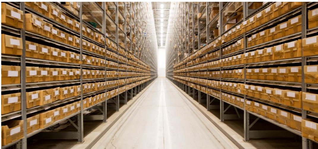
Slika 1. Uredno složeno skladište, Izvor: https://decoratex.biz/bsn/hr/svh---chto-eto-takoe-srok-hraneniya.html

Dakle, skladište mora biti uredno i čisto te treba omogućiti pristupačnost robi i njenu preglednost što prikazuje Slika 1.