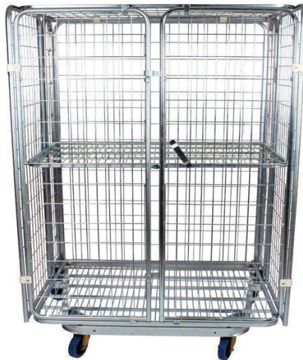
Slika 12. Sanduk na kotačima za skladištenje zaliha

Primjena kolica u skladištu jednog logističko-distribucijskog centra može se vidjeti na slici 13. gdje se koriste za komisioniranje robe prema zahtjevima prodavaonica različite robe.