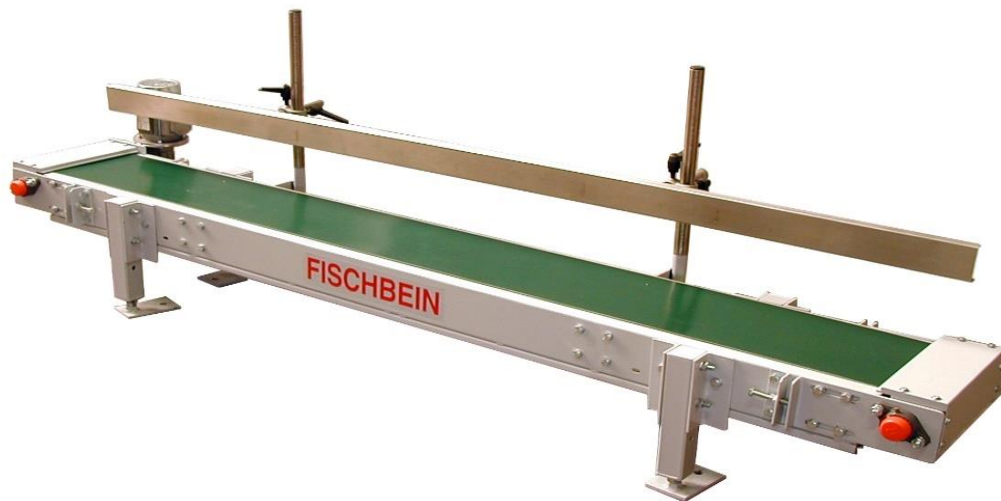
Slika 8. Trakasti transporter

Transporteri predstavljaju najkorišteniju grupu sredstava s neprekidnim djelovanjem i ovdje spadaju trakasti, pločasti, gravitacijski, pružni i drugi transporteri. Trakasti su transporteri (Slika 8.) najrasprostranjeniji jer je njihova konstrukcija iznimno jednostavna i vrlo su pouzdani. Ovi uređaji koriste dva bubnja preko kojih prelazi traka koja se oslanja na nosive valjke. Jedan je bubanj pogonski, a drugi zatezni, sa zateznom napravom.