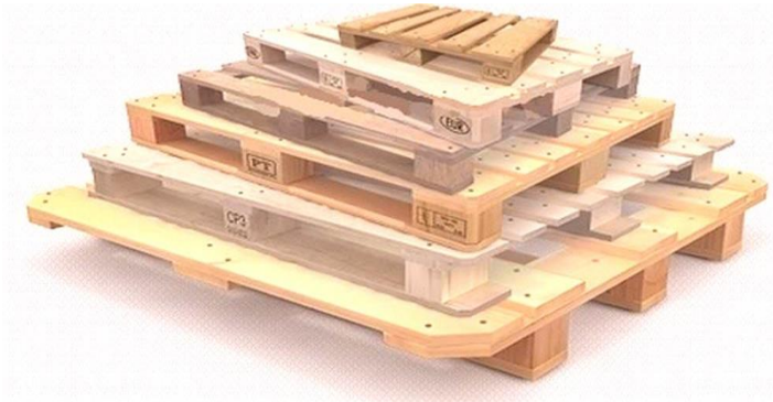
Slika 14. Paleta različitih dimenzija, Izvor: https://hr.dum-vybaveni.cz/velicine-paleta-paleta-euro-finski-americki-domaci-655

Paleta (Slika 14.) su specijalno izrađene i, najčešće, drvene podloge na koje se po stanovitim pravilima slažu komadni tereti kao što su kartoni, sanduci, vreće, bale, gajbe, bačve, s ciljem oblikovanja većih standardiziranih teretnih jedinica kojima se manipulira sigurno, jednostavno, brzo i racionalno. Paleta mogu biti ravne ili boks-paleta, drvene ili metalne te otvorene ili zatvorene paleta.