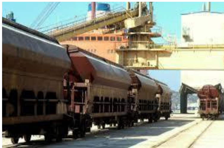
Slika 26. Utovar rasutih tereta u vagone u luci Šibenik, Izvor:

Kod jako velikih kompleksa skladišta ovakvo rješenje nije dovoljno jer se ne uspiju zadovoljiti svi zahtjevi prometa. Također, takvi kompleksi traže veliki prostor zbog čega se mora postaviti više kolosiječnih priključaka, a kako bi svaki od tih priključaka radio nesmetano i pravilno, mora biti direktno spojen s većim željezničkim čvorištem. Za rad sa skladištem, duž njega bi trebali postojati željeznički kolosijeci koji bi se postavljali paralelno sa zgradom skladišta. Razmak između tih kolosijeka i skladišta mora biti dovoljan za kretanje na primjer viličara s paletama, kolica itd. Slika 26. prikazuje vagone u luci Šibenik u koje se vrši utovar rasutog tereta iz skladišta putem utovarne stanice (desni dio slike).