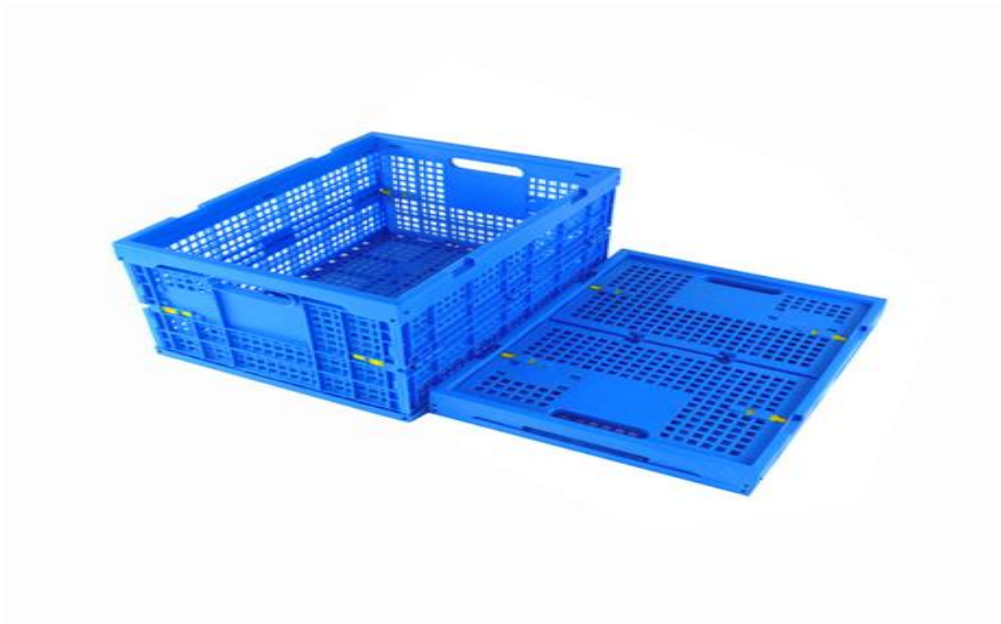
Slika 11. Sklopivi sanduk, Izvor: http://www.huading-industry.com/Collapsible-crates-480x250x250-pd6499259.html

Primjer kolica od žice može se vidjeti na slici 12. Kolica su složiva i napravljena od metalne ploče na dnu, s dimenzijama 1200x800 milimetara. Kolica su opremljena sa dva okretna i još dva okretna kotača s kočnicom promjera 125 milimetara, od plave elastik gume. Struktura je sastavljena od dvije bočne stranice, leđne stranice, dvojnih vrata, gornje strane i pregibne police. Korisna visina artikla je 1545 milimetara, pri čemu su mrežaste oči dimenzije 100x50x4 milimetara. Mrežasta žičana kolica mogu biti opremljena sa do 5 srednjih polica (Perfect move, 2021).