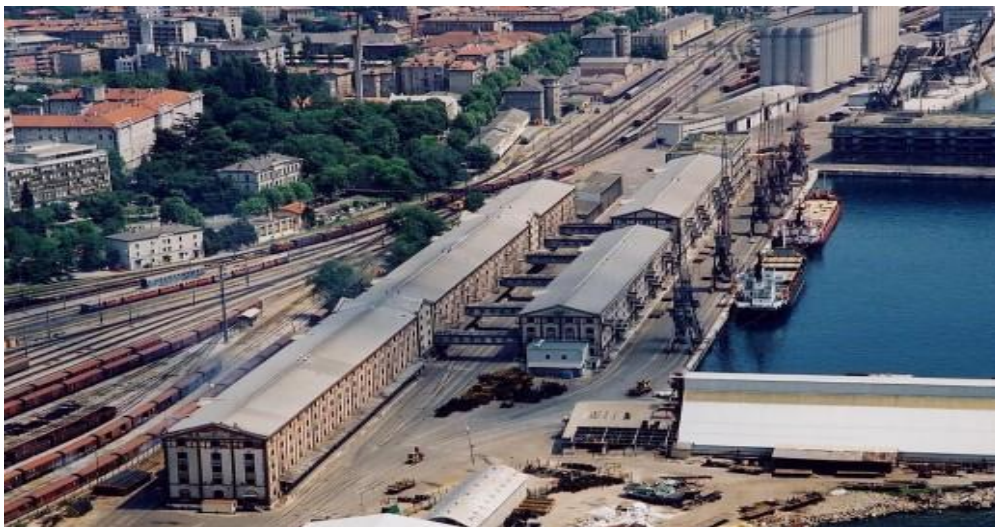
Slika 27. Željeznički kolosijeci skladišta u luci u Rijeci

Utovarno-istovarni kolosijek, koji se nalazi uz samo skladište, mora biti spojen s ostalom kolosiječnom mrežom kako bi se vagonima moglo nesmetano manevrirati. Na Slici 27. prikazani su željeznički kolosijeci jednog skladišta. Željezni kolosijeci imaju posebno veliku ulogu kod rasutih i sipkih tereta. (Prikril & Božičević, 1987, str. 180).