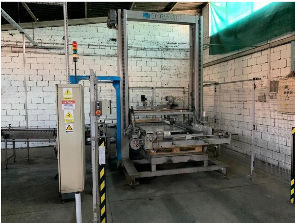
Slika 21. Paletizator u skladištu vinarije

Paletizatori (Slike 21. i 22.) služe za automatsko strojno slaganje tereta na palete, učvršćivanje tereta od ispadanja s paleta u tijeku transporta i skladištenja, markiranje i označavanje tereta te pripremanje tereta za skladištenje, unutarnji i vanjski transport.