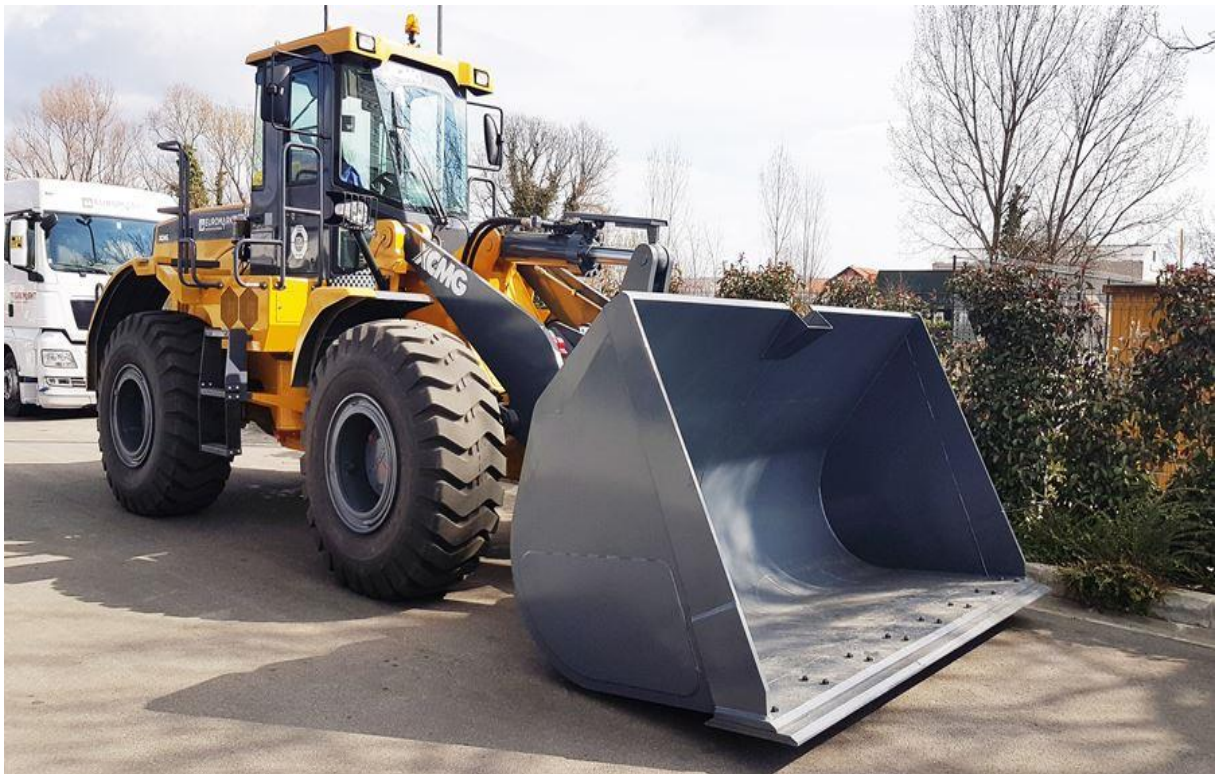
Slika 5. Utovarivač

Zbog sve većeg radnog učinka, utovarivači (Slika 5.) imaju pogon na sva četiri kotača, a za pogon se najčešće upotrebljava diesel motor. Pogon se prenosi od motora na prednju i stražnju osovinu preko hidrodinamičkog pretvarača momenta i mjenjača. Radne brzine utovarivača relativno su malene, a prednosti su im rad u teškim uvjetima i vožnja po kosim terenima. Utovarivači se često koriste u lukama gdje se u zatvorenim i otvorenim skladištima primjenjuju za manipulaciju robom u rasutom stanju.