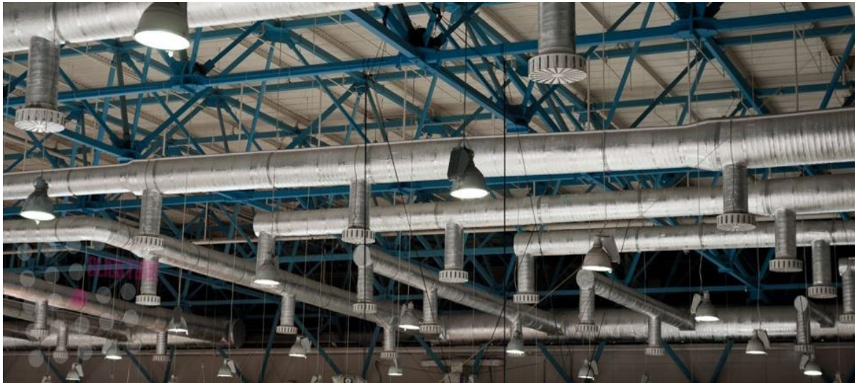
Slika 24. Ventilacija skladišta, Izvor: https://vvsc.ru/hr/ventilation-system-for-industrial-premises-ventilation-in-production/