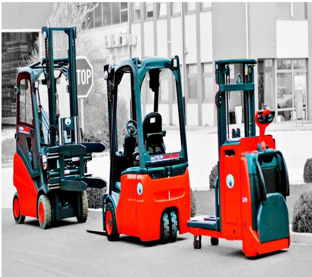
Slika 9. Viličari

Viličari (Slika 9.) predstavljaju posebna sredstva za transport koja imaju ugrađenu vilicu te su česta oprema za unutrašnji transport i skladištenje tereta. Osnovna svojstva svakog viličara su: dizanje tereta, vožnja (transport tereta s jednog mjesta na drugo), slaganje tereta te nepovezanost s određenim mjestom ili pravcem kretanja.