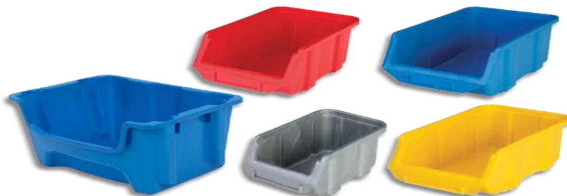
Slika 16. Kutije za skladišta

Kutije za skladišta (Slika 16.) koriste se za spremanje i izlaganje robe u skladištima, a ima ih raznih boja i dimenzija. Naime, kombiniranjem boja moguće je pregledno skladištenje različitih grupa roba. Također, proizvodi su izrađeni od vrlo otpornog termoplastičnog materijala koji nije štetan za okolinu jer se može reciklirati (PREPLAM, 2021).