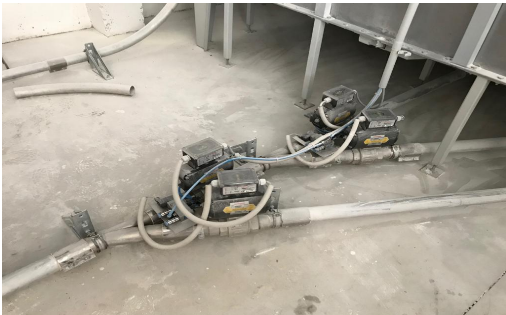
Slika 7. Uređaj za pneumatski transport u skladištu brašna

Uređaji pneumatskog transporta (Slika 7.) koriste se kod transporta određenog sipkog materijala pomoću struje plinova. Razlikuju se usisni i tlačni sustav pneumatskog transporta. Usisni je jednostavnije izvedbe, a tlačni kompleksnije. S obzirom na ostala sredstva neprekidnog transporta, pneumatski sustavi jednostavnije su konstrukcije, montaže i demontaže, zatim zauzimaju vrlo malen prostor, omogućuju visoki stupanj automatizacije te uzrokuju iznimno malene troškove (Dundović & Hess, 2007, str. 261).