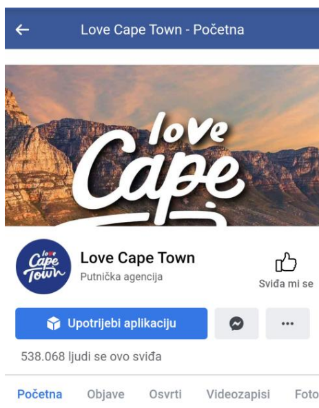
Slika 2. Facebook profil „Love Cape Town“

Jedan od primjera promocije turizma preko Facebooka je "Cape Town Turism". A ideja je bila otkriti nepoznata mjesta Cape Towna novim potencijalnim turistima. Osmislili su jednostavni predložak na koji su korisnici stavljali vlastite fotografije što je u konačnici rezultiralo impresijom da su sami korisnici aplikacije posjetili Južnu Afriku. Sve što su dodatno trebali napraviti bilo je podijeliti tu fotografiju na vlastitom profilu. Fotografije su se munjevitom brzinom proširile društvenim mrežama i ova kampanja ostaje jedna od najuspješnijih Facebook kampanja u svijetu.