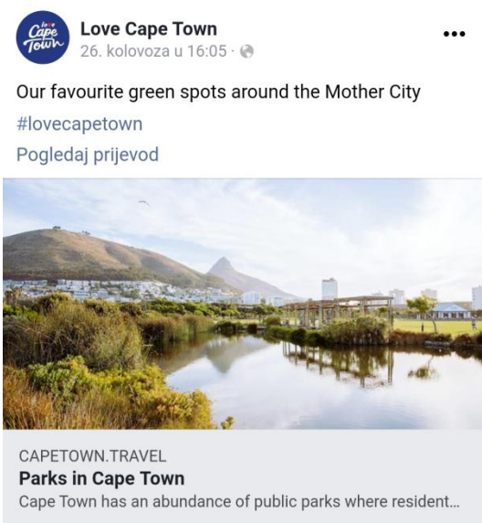
Slika 3. Promocija parkova Cape Town-a na Facebook profilu