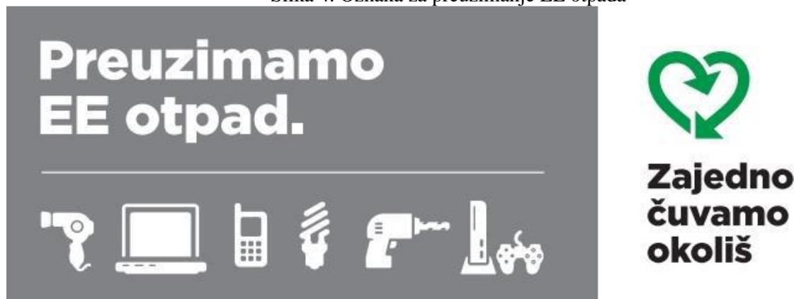
Slika 4. Oznaka za preuzimanje EE otpada