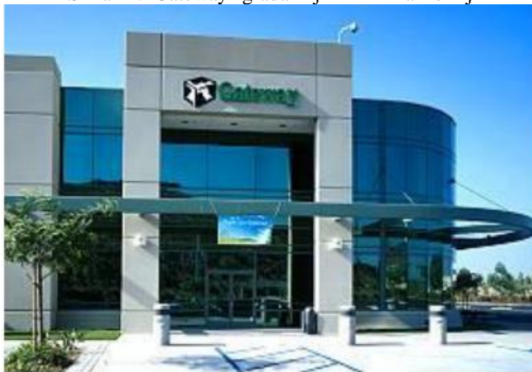
Slika 11. Gateway zgrada - sjedište u Kaliforniji