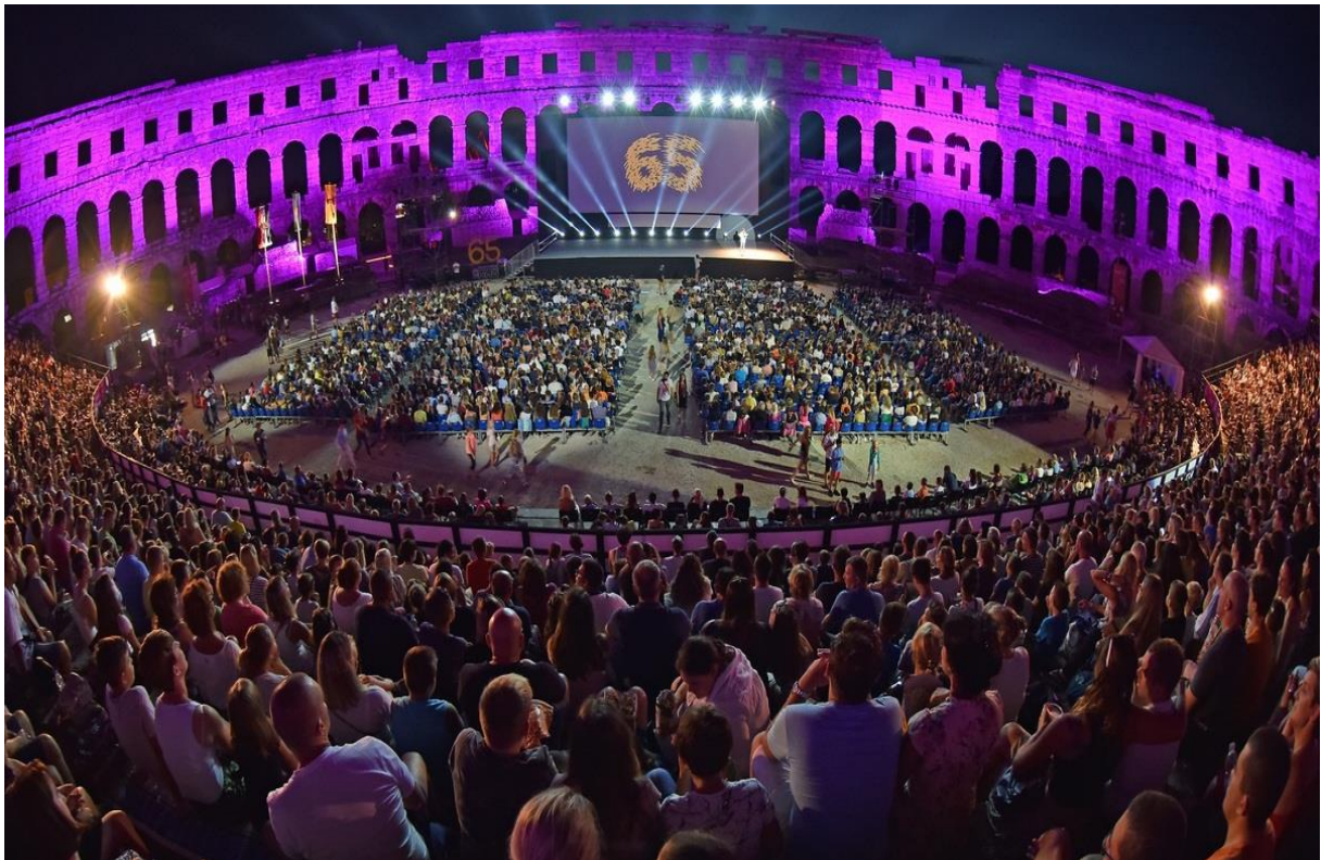
Slika 7. Pulski filmski festival