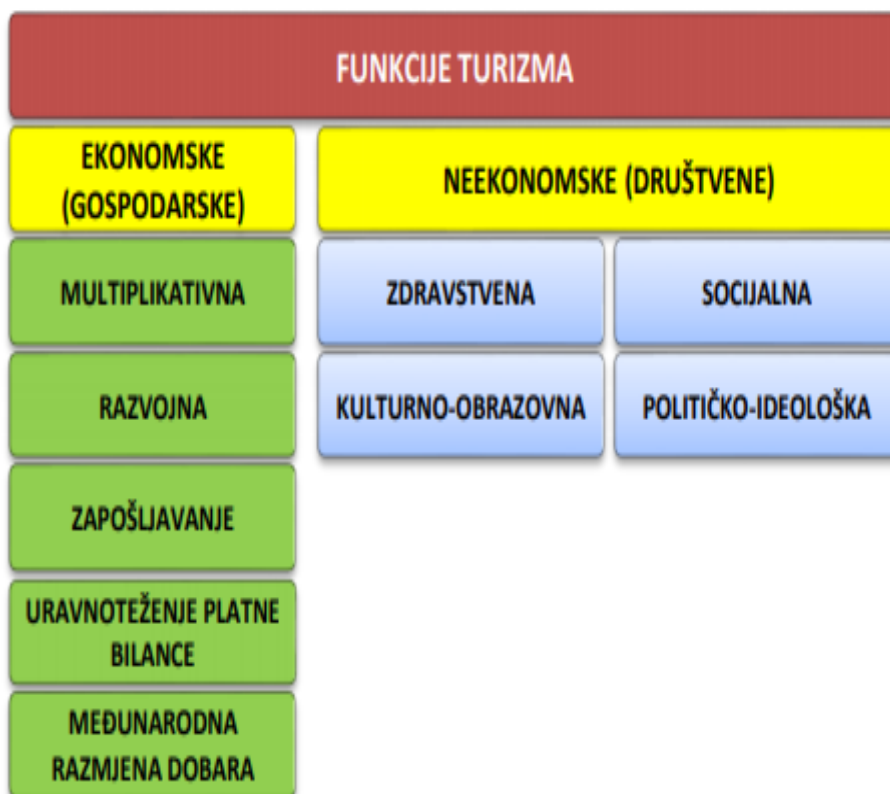
Slika 6. Funkcije turizma