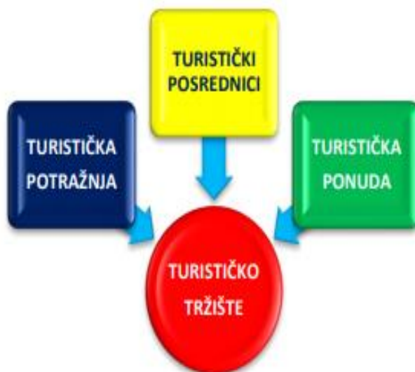
Slika 2. Konstitutivni elementi (subjekti) turističkog tržišta