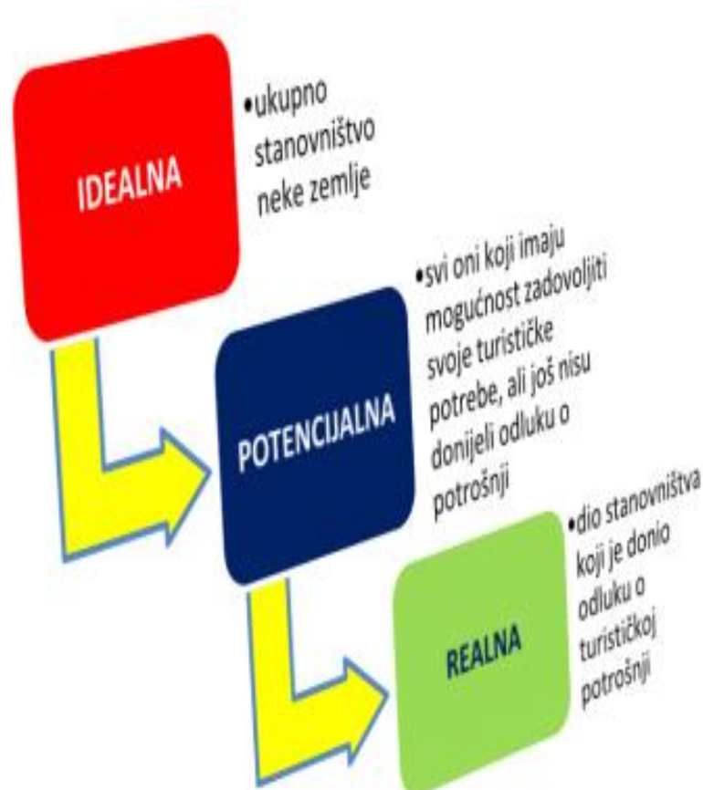
Slika 3. Skupine turističke potražnje