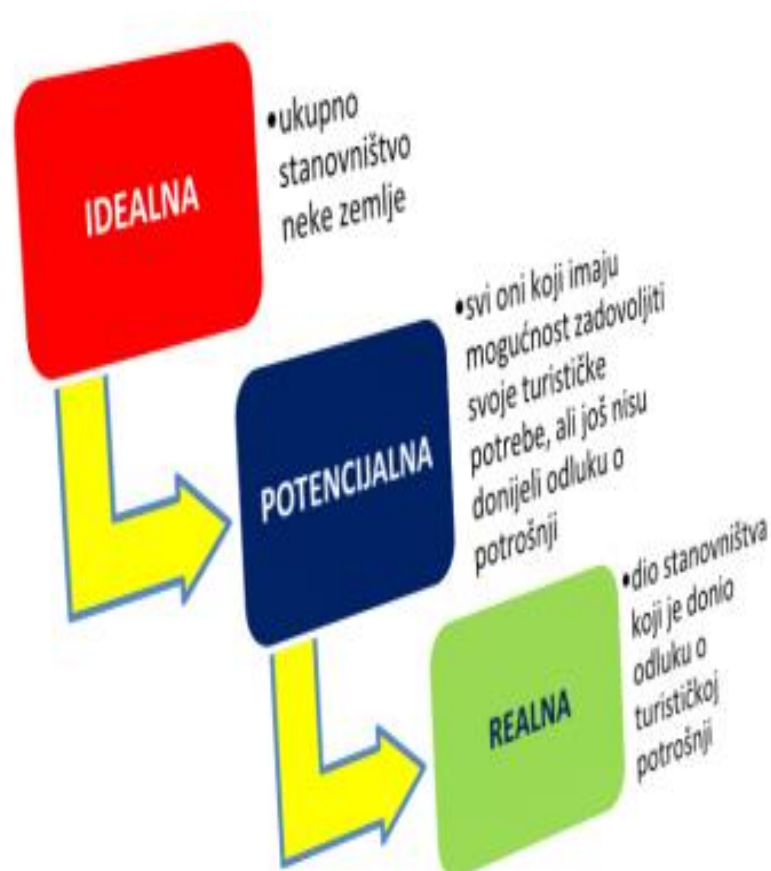
Slika 3. Skupine turističke potražnje