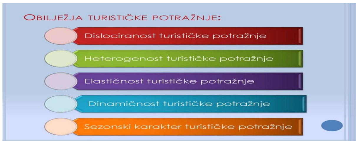
Slika 4. Obilježja turističke potražnje