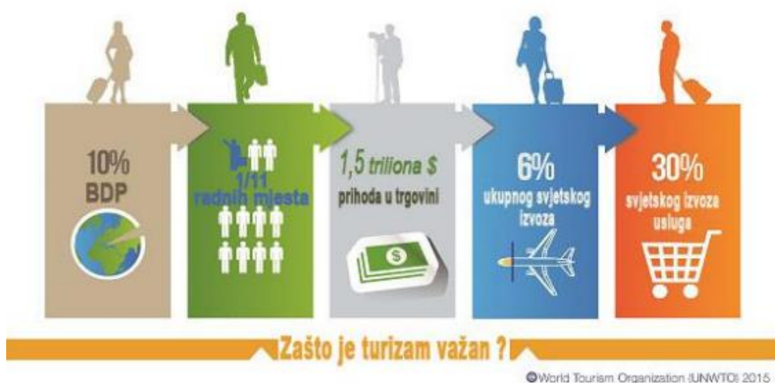
Slika 1. Važnost turizma