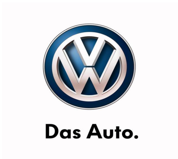
Slika 5: Volkswagen

Kako bi zadovoljio potrebu za automobilima koji nisu odraz brzine i prestiža, Volkswagen kreira vozila s više nego dovoljno prostora za putnike, pametnim pretincima za skladištenje i opremom koja je dopunjena stavkama koje povećavaju razinu sigurnosti i komfora kako bi svoj automobil učinio prikladnim za obiteljski orijentirane potrošače. 47