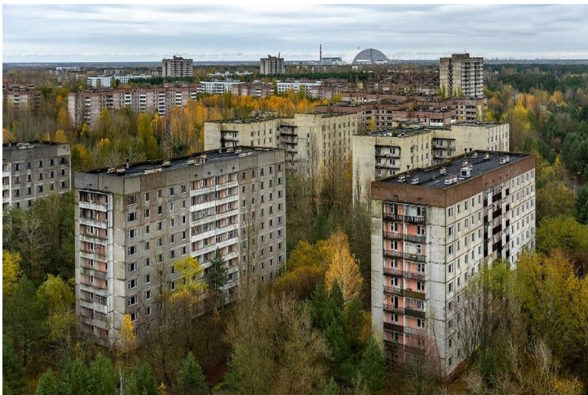
Slika 4: Pripjat, Ukrajina