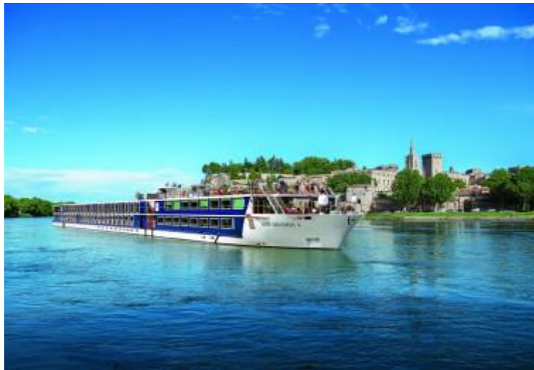
Slika 2. Krstarenje Dunavom