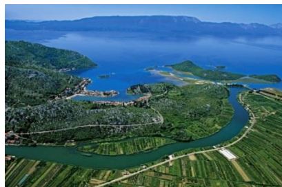
Slika 7. Dolina rijeke Neretve