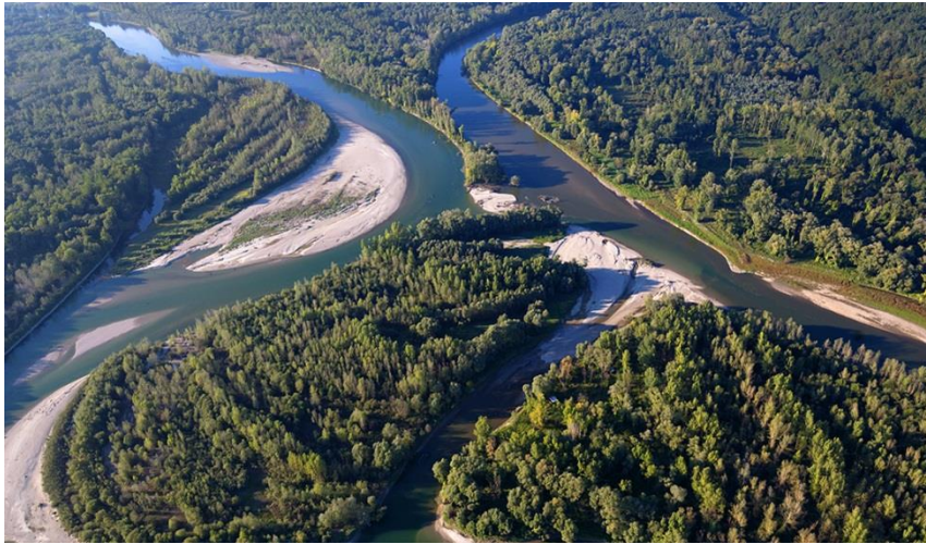
Slika 4. Drava