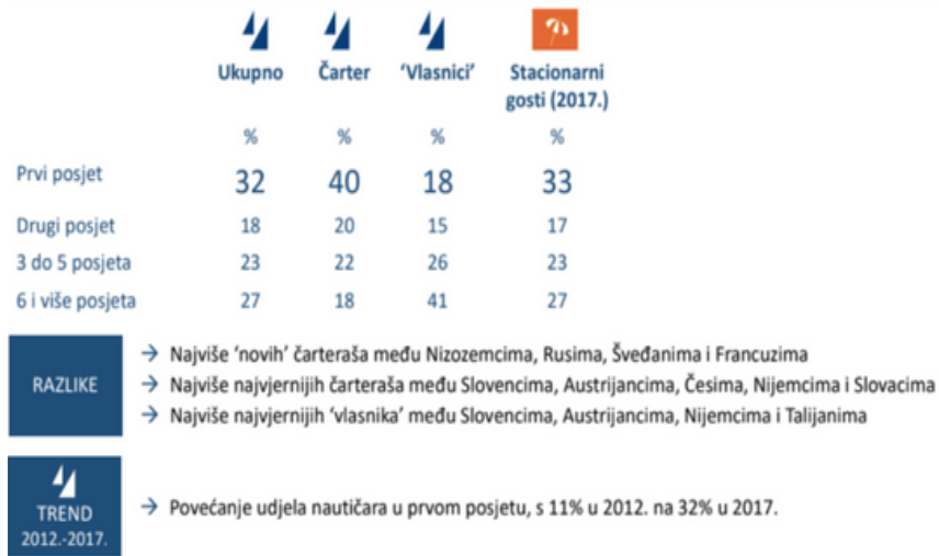
Slika 3. Učestalost dolazaka u Hrvatsku