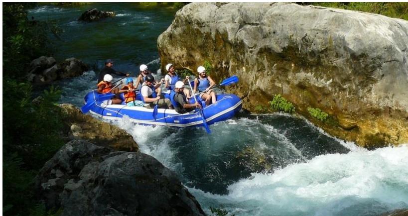
Slika 6. Rafting na rijeci Cetini