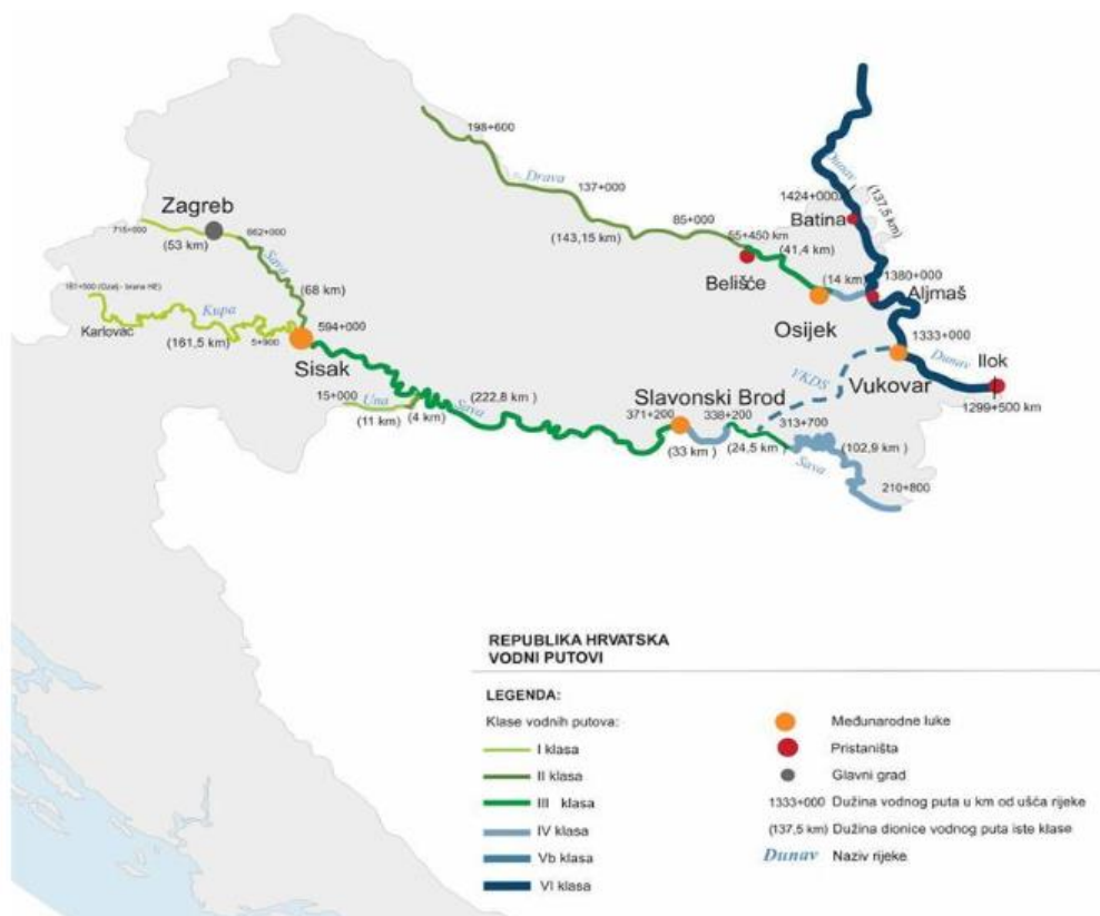
Slika 5. Plovni putovi rijeka Drave, Kupe, Save i Dunava