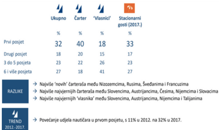
Slika 3. Učestalost dolazaka u Hrvatsku