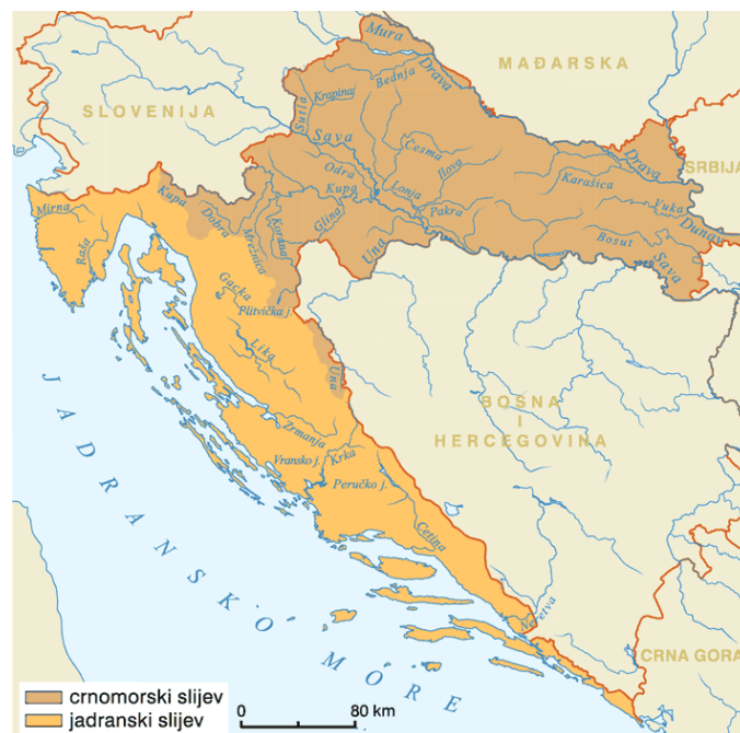
Slika 1. Hidrografska karta