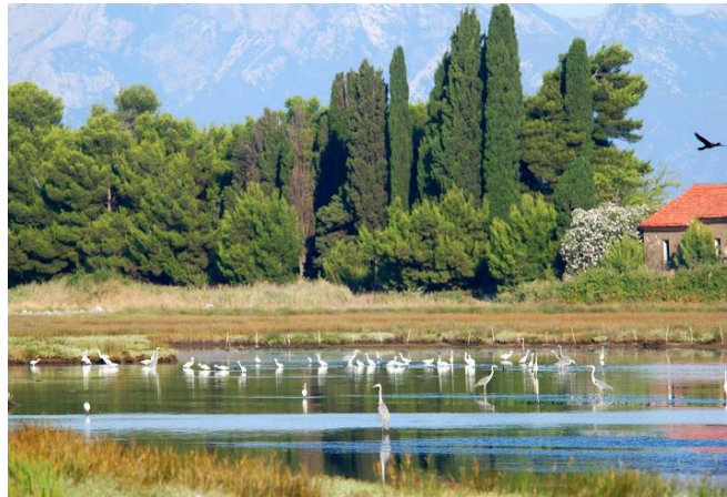
Slika 8. Foto-safari Neretva