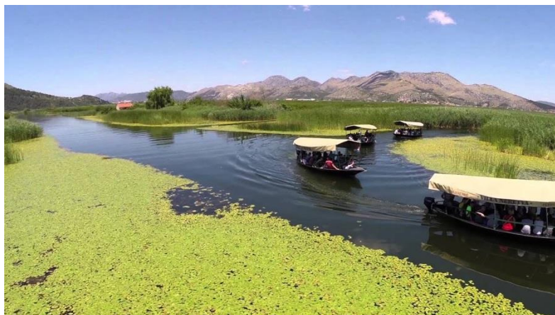
Slika 9. Vožnja tradicionalnom neretvanskom lađom