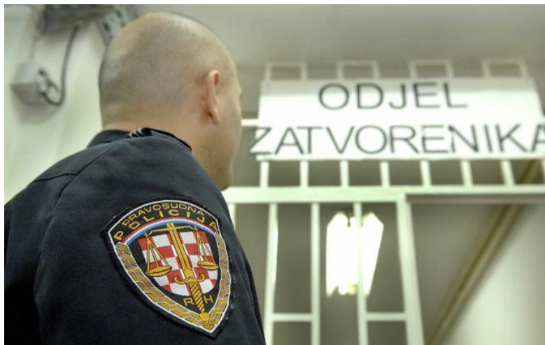
Slika 2: Službenik odjela osiguranja pravosudne policije

aktivnom otporu ili opasnostima koja prijete iz sigurnosno rizičnog ponašanja zatvorenika (maloljetnika), posljednja mjera kojom se održava red i sigurnost.