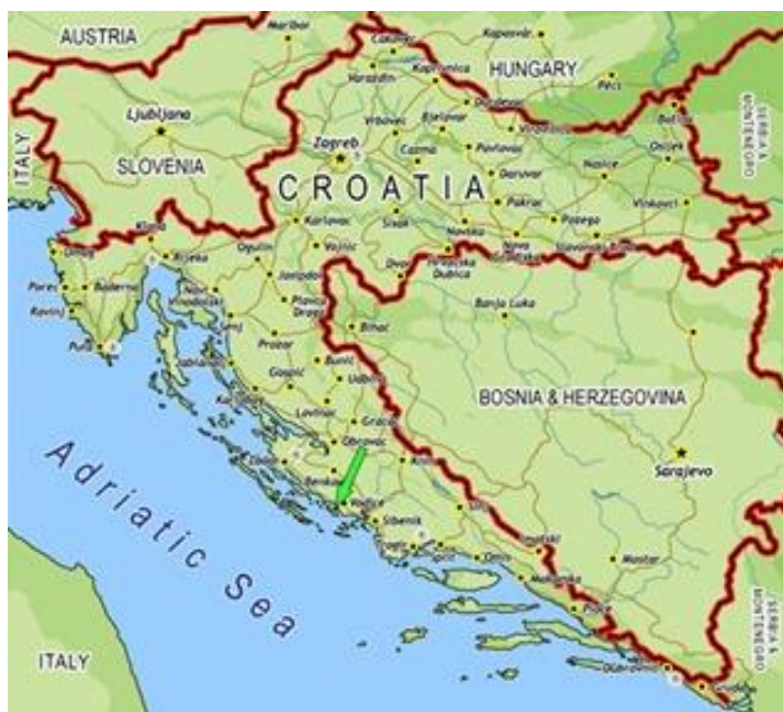
Slika 4. Granica Republike Hrvatske i susjednih država.