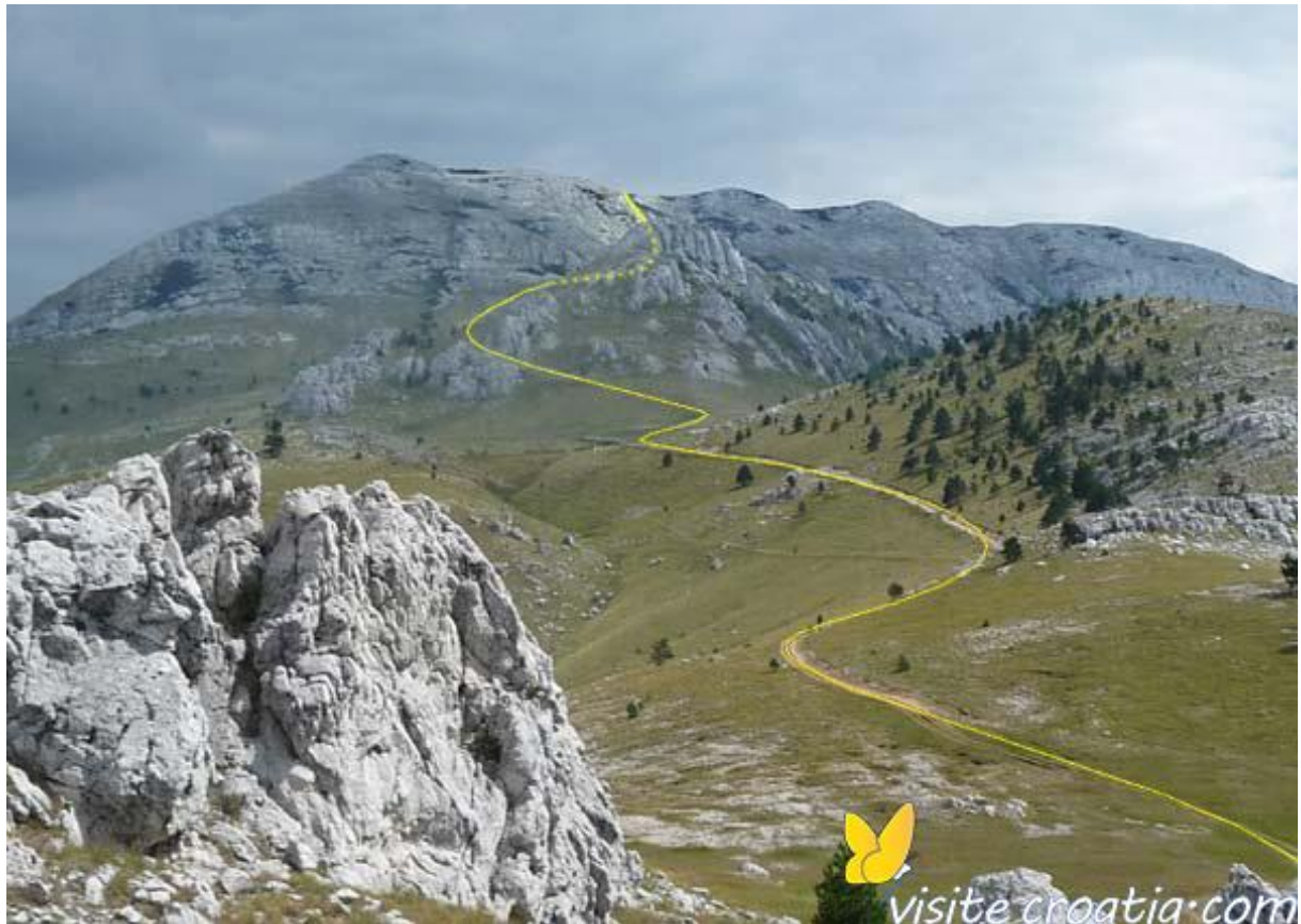
Slika 1. Prirodna granica planina Dinara

Kad granica proazi vodenim tokom postoje dva načina: