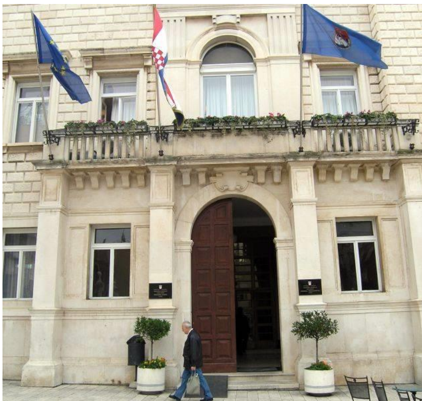
Slika 2. Zastave desna zastava predstavlja zastavu Grada Zadra.