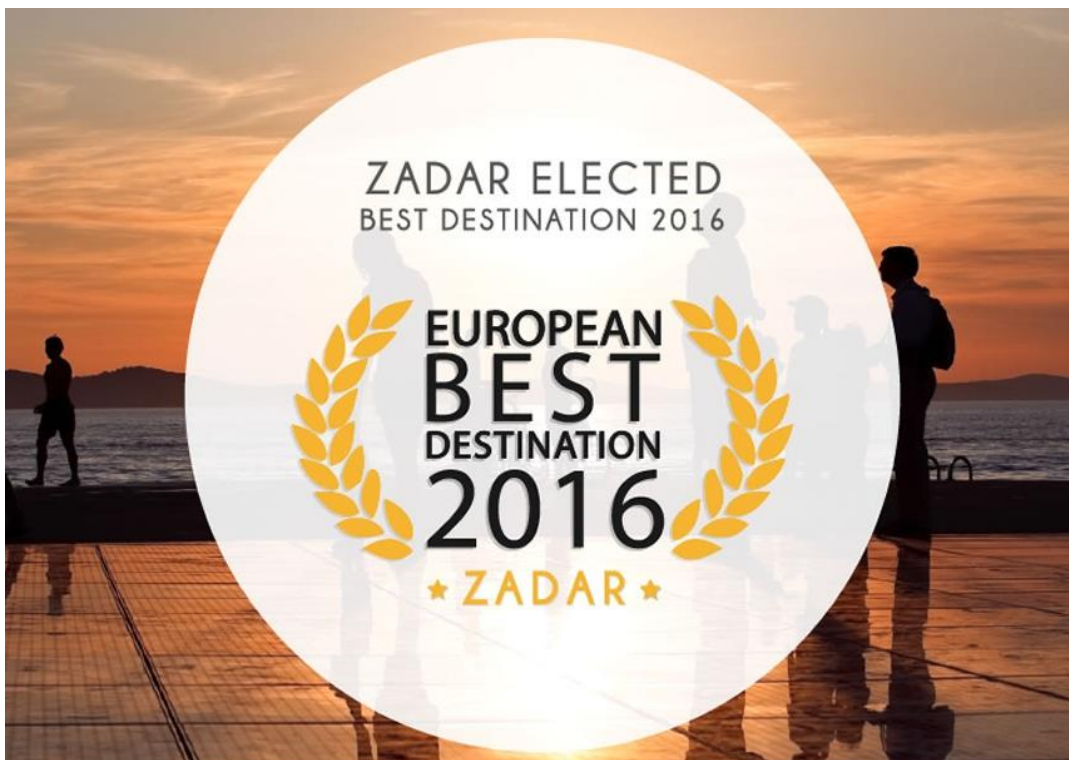
Slika 3. Zadar kao najbolja europska destinacija 2016. godine.

Ad 5. Obavlja poslove koje se odnose na promicanje poduzetničkih aktivnosti , promidžbe obrtništva i poduzetništva te poslovnog okruženja Grada radi privlačenja poduzetničkog ali i stranih investitora što u jedinicama lokalne samouprave tako i u jedinicama regionalne samouprave, kao i na rangu države. Hrvatska ima veliki potencijal od same obale, industrije, samo nam fali radnika, Slavonija je pusta, iseljena, i iseljava se konstantno iako postoje strani investitori ne mogu uložiti u našu državu radi toga što nema radne snage stoga moraju uvoziti svoju radnu snagu. Isto tako za ovaj upravni odjel bitno je naglasiti da potiče kreditiranje malih i srednjih poduzetnika kao i samu suradnju s lokalnim turističkim agencijama radi unaprjeđenja turističke ponude i promidžbe jedinica lokalne samouprave u ovom slučaju grada Zadra. Za Zadar je 2016. godina bila jedna od uspješnijih radi dobivanja nagrade za najbolju europsku destinaciju !