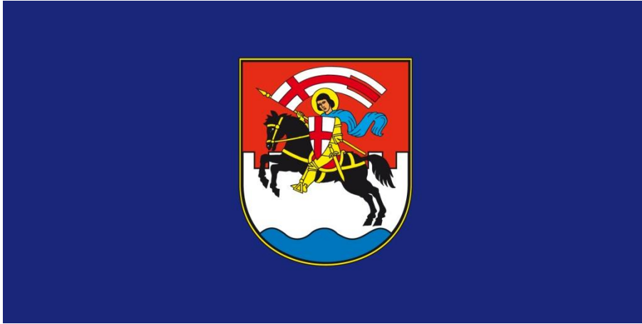
Slika 1. : grb Grada Zadra

Ako se grb postavlja, postavlja se s lijeve strane gledano s strane grbova kako se postavljaju.