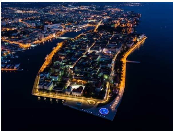
Slika 5. Grad Zadar noću.

Grad Zadar je prethodno rečeno uređen upravnim odjelima kojih je sve više radi pomoći samog lokalnog stanovništva od poljoprivrede preko ruralnog turizma koji je u velikom rastu te preko samih upravnih odjela koji su stvoreni radi racionalnijeg “dijeljenja” novca iz Europskih fondova. I za sam kraj cijelog završnog rada bitno je još naglasiti da je grad Zadar pun mladih poduzetnika i mladih ljudi koji su konstantno u funkciji rada i unaprjeđenja grada, kako za nas stanovnike tako i za strance i turiste. Isto tako, bitno je naglasiti da se grad iz dana u dan povećava, što po broju stanovnika, što po velikoj urbanizaciji i preseljenju većine ljudi u ruralno područje tako i širenje granica grada.