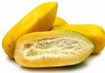
Slika 16. Babaco

Babaco ili planinska papaja je vrsta Carica pentagona , porijeklom iz Ekvadora i gornjeg toka Amazone. Babaco je bogat vitaminom A i C i sadrži betakaroten, kalcij, vlakna, magnezij i kalij te enzim papain koji pomaže u probavljanju masti i proteina 33 . Ovaj vrijedni enzim je najrasprostranjeniji u koži babaca, tako da to voće treba jesti s kožom (da dobije punu vrijednost). Babaco ima atraktivan torpedo ili cilindričan izgled, žute kože i sočnog žutog mesa bez sjemena. Voće raste u grozdovima na stablu, a najbolje ga je jesti svježeg, kada je u potpunosti zrelo. Okus je svjež i sladak, a može se definirati kao kombinacija jagoda i dinja. Nezrelo zeleno voće se koristi kao zeleno povrće u umacima kariju i chutneyu. Plodovi su obično kuhani ili pirjani kao povrće, a meso babaco plodova je također dobro u voćnim salatama. Babaco je vrlo pogodna vrsta za uzgoj u zaštićenom prostoru i podnosi temperature do 0 °C.