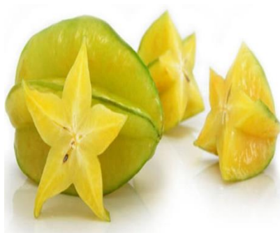
Slika 9. Carambola

Koža carambole je zelena do žućkasta, malo voštana i jestiva, meso je sočno, žuto - prozirno s jednom crnom jestivom sjemenkom. Okus carambole je svjež, sočan i osvježavajući i usporediv s mješavinom okusa papaje, naranče i grejpa. Plod može biti žute ili zelene boje, ovisno o sorti - žuto voće ima kiseli, a zeleno sladak okus. Carambola je bogata ugljikohidratima, vlaknima, vitaminom C i vodom, jede se svježa i potpuno je jestiva. Često se koristi u salatama, kolačima, marmeladi, želeima, koktelima ili je ukras raznih jela, a u uvjetima Hrvatske pogodna je za uzgoj u zaštićenom prostoru (jer podnosi temperaturu do 5 °C).