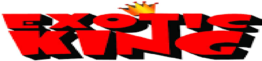
Slika 33. Brand Exotic King

poduzeća u proizvodnji, te tehnologija koju posjeduje, daju im vjeru za budući razvoj. Poduzeće Šulog d.o.o. je također spremno svakome ustupiti kompletno znanje i logistiku kako bi se na tržište plasirao bilo koji proizvod kroz njihove partnere ili se pronašlo novo tržište.