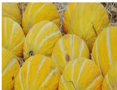
Slika 24. Jeju dinja

Jeju dinja (orijentalna dinja - Cucumis melo var. makuwa ) razvila se od divljih vrsta u Aziji, a njezin uzgoj i povijest su prilično dugi. U Indiji i Kini, orijentalne dinje se koriste još od prije Krista, a u Europi su se pojavile u 5. stoljeću. Orijentalna dinja sadrži vitamin E, kalcij, kalij, vitamine i folne kiseline, te znatne količine vode. Egzotična dinja ima veliki sadržaj šećera i vrlo malu sjemenu ložu koja se lako odvaja od ploda. Iznimno je sočna, tvrdog bijelog mesa i slatkastog mirisa, vrlo je tanke kore i iznimno dobro podnosi transport, ne puca i može se dugo čuvati. Pokazala se izvrsnom u liječenju žutice, začepljenja, ima antikancerogeno djelovanje i koristan je laksativ.