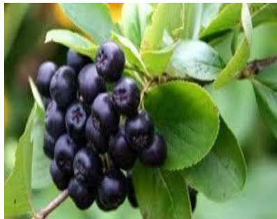
Slika 17. Sibirski borovnik

Okus medene borovnice varira od kiselog do blago slatkog ili gorkastog, a što se tiče konzumacije, mogu se konzumirati kao svježe voće ili u raznim pitama i kolačima, džemu, voćnim sokovima i jogurtu. Vrlo su ljekovite zbog svojeg antioksidativnog svojstva i visoke koncentracije vitamina C i D 34 .