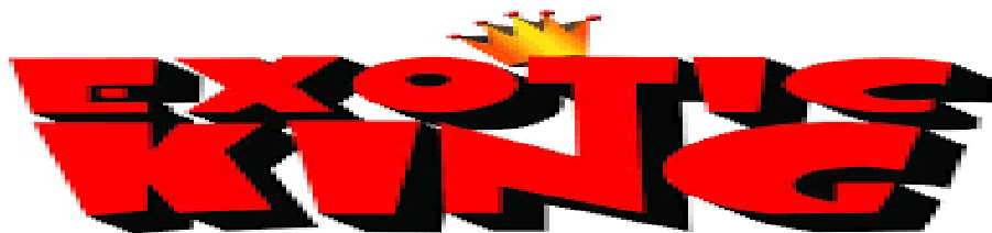
Slika 33. Brand Exotic King

poduzeća u proizvodnji, te tehnologija koju posjeduje, daju im vjeru za budući razvoj. Poduzeće Šulog d.o.o. je također spremno svakome ustupiti kompletno znanje i logistiku kako bi se na tržište plasirao bilo koji proizvod kroz njihove partnere ili se pronašlo novo tržište.