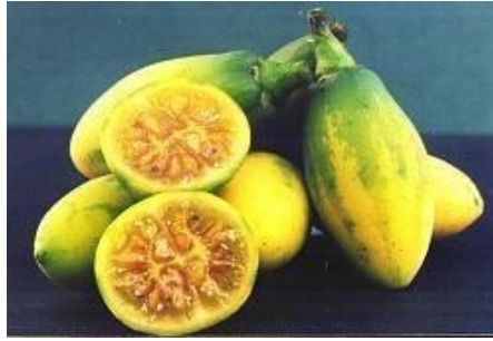
Slika 15. Casana