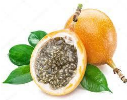
Slika 11. Granadilla

Plod je oblika i veličine šljive, slatko-kiselog okusa i sadrži žuto meso (nalikuje na žele s crnim jestivim sjemenjem), a ljuska je tvrda i sjajna. Granadilla je suptropsko voće, vrlo aromatično i srži vitamina (A, C i K, fosfor, željezo i kalcij) 28 . Konzumira se svježe te, kuhano ili pretvoreno u sok, no važno je napomenuti da se koža ploda ne jede.