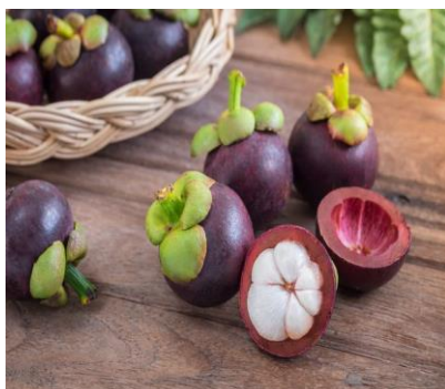
Slika 30. Mangosteen