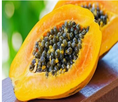
Slika 23. Papaja