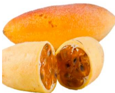
Slika 27. Curuba

Curuba ( Passifloratarminiana ) je vrsta iz roda Passiflora , obitelji Passifloraceae porijeklom iz Južne Amerike. Curuba plod je dužine do 10 cm i širine do 3 cm, meso i sjemenke Curube su jestive (okus je blago kiselkast - sličan okusu jabuke, naranče i krastavca), a koža Curube je glatka, žuta i mekana (nije jestiva). Biljka raste kao loza i ima rozo – crvene cvjetove, a bogata je kalcijem, željezom, niacinom, riboflavinom, natrijem te vitaminima A i C 40 . Curuba se obično jede kao voćka, ali se konzumira i kuhana ili pretvorena u sok.