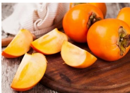
Slika 32. Japanska jabuka

Japanska jabuka – kaki potječe iz Japana, a od devetnaestog stoljeća uzgaja se i u Europi. Biljka je najljepša zimi, kada otpadnu listovi, a na golim granama kao lampioni ostanu narančasti plodovi. Plodovi dostižu težinu do pola kilograma - opna ploda je prozirna, a ispod nje se krije mekano meso puno vitamina C 44 . Najbolji je onaj plod koji je pod rukom mekan, a tvrdi plodovi za nekoliko dana sazrijevaju na sobnoj temperaturi. Od kakija se može praviti sok, džem, sirup i voćna salata.