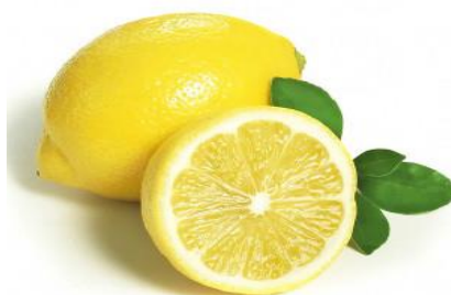
Slika 7. Limun mjesečar – hrvatska autohtona vrsta

Najznačajniji predstavnici južnog, suptropskog i tropskog voća su citrusi ili agrumi. To su limun, naranče, mandarine i grape-fruit (zajednički ih nazivamo citrusi ili agrumi). U priobalnom i obalnom području mediterana rastu oskoruše, rogači, smokve i mogranj.