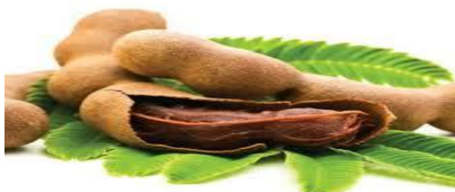
Slika 13. Tamarind

Tamarind ( Tamarindusindica ) je mahunarka porijeklom iz Afrike. Plod sadrži meku kiselu pulpu crvenkasto-smeđe boje, dug je 6-10 cm sa 1-6 teško-obloženih sjemenki, a izvana je smeđa čvrsta ljuska. Pulpa nezrelog voća je jestiva, ali jako kisela, dok je zreli plod manje kiseo. Sjemenke tamarinda su spljoštene, smeđe i sjajne. Vrlo je vrijedan izvor kalcija, kolina, vlakana, folne kiseline, magnezija, niacina, fosfora, kalija, tiamina, vitamina C i K 31 . Zrelo voće se koristi u desertima kao džem, u sokovima ili zaslađenim pićima, ili kao snack. Od njega se mogu napraviti bomboni. Tamarind također može biti dodan u juhe, variva i druga jela. Vrlo je pogodan za uzgoj na otvorenom u Dalmaciji i otocima.