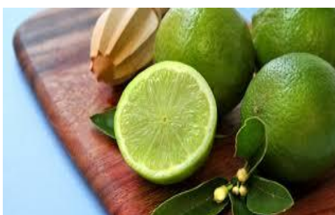
Slika 14. Limeta

Limeta ( Citrus aurantiifolia ) iz porodice rutvice ( Rutaceae ) raste u oblik malog drva ili visokog grma, visine do 5 metara s gustom okruglom krošnjom. Cvjetovi limete su elipsasti, dugi do 10 centimetara, s prozirnim točkama, a cvjetovi pojedinačni ili u skupinama, mirisni, promjera 3 do 4 centimetra. Sok plodova limete, a ponekad i ulje kore ploda ne koriste se samo za aromatiziranje brojnih jela i napitaka, već i u medicini. Od svih plodova citrusa, limeta se najčešće susreće u tropskim vrtovima. Sok limete mnogo je aromatičniji od soka limuna, a često se u vlažnim područjima tropa uzgaja i limunika, odnosno grejp. 32