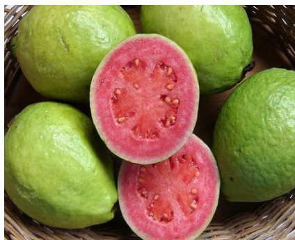
Slika 18. Guava

Guava se može jesti sirova kao voće, ili rezane sa sjemenkama u salatama. Također se mogu koristiti u pitama, džemovima, želeima, umacima, sokovima i čajevima.