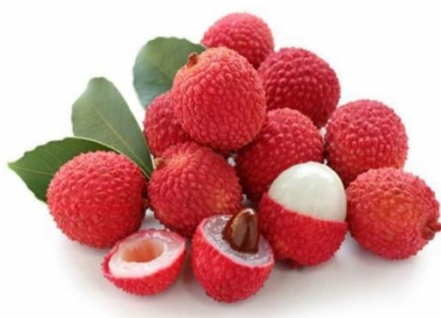
Slika 31. Liči

Liči je azijska trešnja i vrlo omiljeno voće u Kini (gdje se inače i uzgaja već preko 4000 godina). Prva knjiga ikada napisana o voću bila je posvećena upravo ličiju , a na Tajlandu postoje čak i festivali posvećeni ovom voću. Ako netko nekome u toj zemlji pokloni liči , znači veliku ljubav i spremnost da ponudi brak. Kora ličija je crvenkastosmeđe boje, a ispod je prozirno meso koje obmotava košticu. Prilikom pripreme ovoga voća za jelo, mora se prvo nožem zasjeći kora i napraviti mali rez (tada je koru lako oljuštiti prstima), zatim se prozirno meso isječe se na pola i iz njega izvadi koštica. Najbolje je kada se liči jede svjež, a ne iz konzerve ili sušen, jer tada gubi dragocjeno željezo i vitamin C 43 .