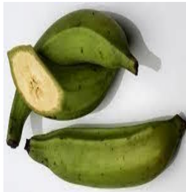
Slika 28. Plantana banana

Plantana banana je zeljasta biljka iz roda Musa koja raste najbolje u područjima sa stalnim toplim temperaturama i zaštitom od jakih vjetrova. Plantana banana je glavna hrana u tropskim regijama svijeta, a tretira se na isti način kao i krumpir. Neutralna je okusa i teksture pa se kuha ili prži, ima puno škroba, a malo šećera. Vrsta je koja se mora skuhati prije posluživanja jer nije prikladna sirova. Koristi se u mnogim jelima poput krumpira - obično kuhana, pržena ili pečena. Unutrašnja boja ploda je kremasta, žućkasta ili lagano ružičasta. Dok je koža banane zelene do žute boje, okus mesa je blag, a kako se mijenja na smeđu ili crnu, ona je slađeg okusa i ima više arome banane. Plod je dulji od klasične banane, te ima deblju kožu i grublju površinu. Ne postoji formalna botanička razlika između poznate banane i plantana banane , te korištenje bilo kojeg pojma temelji se isključivo na tome kako se voće konzumira.