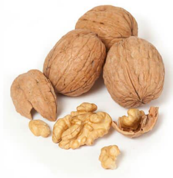
Slika 4. Orahovečki orah – predstavnik jezgrastog voća

Lupinasto ili jezgrasto voće je: orah, badem, lješnjak, kesten i kikiriki. Za jelo se koristi sjemenka koja kod većine plodova nije srasla sa usplođem. Sjemenka se sastoji od tvrde ljuske i jezgre-sjemenke, a jezgra je obavijena tankom pokožicom. Za razliku od većine voćnih vrsta koje uglavnom sadrže ugljikohidrate i vodu, jezgrasto se voće odlikuje visokim udjelom bjelancevina, zdravih masnoća te minerala, vitamina B i vitamina E.