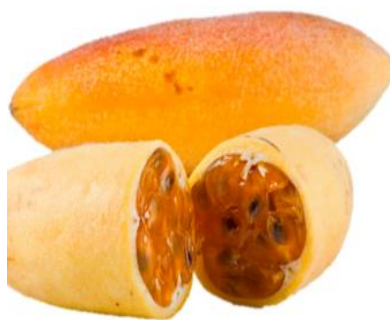
Slika 27. Curuba

Curuba ( Passifloratarminiana ) je vrsta iz roda Passiflora , obitelji Passifloraceae porijeklom iz Južne Amerike. Curuba plod je dužine do 10 cm i širine do 3 cm, meso i sjemenke Curube su jestive (okus je blago kiselkast - sličan okusu jabuke, naranče i krastavca), a koža Curube je glatka, žuta i mekana (nije jestiva). Biljka raste kao loza i ima rozo – crvene cvjetove, a bogata je kalcijem, željezom, niacinom, riboflavinom, natrijem te vitaminima A i C 40 . Curuba se obično jede kao voćka, ali se konzumira i kuhana ili pretvorena u sok.