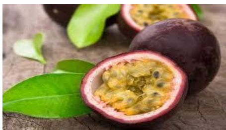
Slika 22. Passionfruit

Maracuja ima okrugle ili ovalne plodove, sočne unutrašnjosti ispunjene brojnim sjemenkama te se može jesti sirova ili koristiti za proizvodnju sokova (a često se dodaje u ostale voćne sokove za poboljšanje arome). U Hrvatskoj se može vrlo uspješno uzgajati u kontinentalnim uvjetima na način da biljka svojim velikim zelenim mesnatim listovnim pokrije površinu od 6 - 9 m 2 sa stotinjak cvjetova i plodova. Također je potrebno dvogodišnje sadnice posaditi na sunčano mjesto uz odgovarajuću konstrukciju (kao za vinovu lozu) i često ih i puno zalijevati. Vrlo je pogodna za uzgoj na otvorenom, daje izvrsne prinose u plastenicima i može se uzgajati u Dalmaciji i otocima na otvorenom.