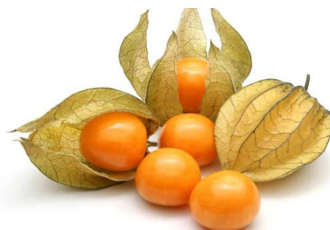
Slika 8. Physalis – peruanska jagoda

Slatkaste bobice jedu se svježe i sastavni su dio voćnih salata u kombinaciji s ostalim voćem. Sadrži vitamine A, C, B 1 , B 2 , B 6 , B 12 i puno fosfora, te 16% proteina 26 , što je vrlo visok postotak za voće. Znanstvena istraživanja pokazala su da sastavni dijelovi ploda, polifenoli i/ili karotenoidi, pokazuju protuupalna i antioksidativna svojstva 27 .