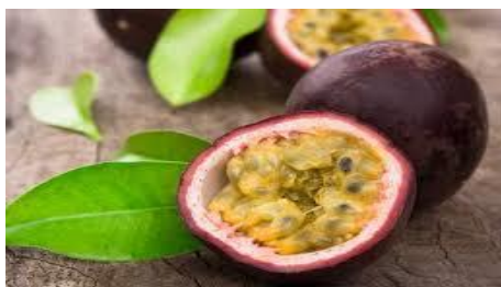
Slika 22. Passionfruit

Maracuja ima okrugle ili ovalne plodove, sočne unutrašnjosti ispunjene brojnim sjemenkama te se može jesti sirova ili koristiti za proizvodnju sokova (a često se dodaje u ostale voćne sokove za poboljšanje arome). U Hrvatskoj se može vrlo uspješno uzgajati u kontinentalnim uvjetima na način da biljka svojim velikim zelenim mesnatim listovnim pokrije površinu od 6 - 9 m 2 sa stotinjak cvjetova i plodova. Također je potrebno dvogodišnje sadnice posaditi na sunčano mjesto uz odgovarajuću konstrukciju (kao za vinovu lozu) i često ih i puno zalijevati. Vrlo je pogodna za uzgoj na otvorenom, daje izvrsne prinose u plastenicima i može se uzgajati u Dalmaciji i otocima na otvorenom.