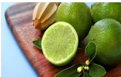
Slika 14. Limeta

Limeta ( Citrus aurantiifolia ) iz porodice rutvice ( Rutaceae ) raste u oblik malog drva ili visokog grma, visine do 5 metara s gustom okruglom krošnjom. Cvjetovi limete su elipsasti, dugi do 10 centimetara, s prozirnim točkama, a cvjetovi pojedinačni ili u skupinama, mirisni, promjera 3 do 4 centimetra. Sok plodova limete, a ponekad i ulje kore ploda ne koriste se samo za aromatiziranje brojnih jela i napitaka, već i u medicini. Od svih plodova citrusa, limeta se najčešće susreće u tropskim vrtovima. Sok limete mnogo je aromatičniji od soka limuna, a često se u vlažnim područjima tropa uzgaja i limunika, odnosno grejp. 32