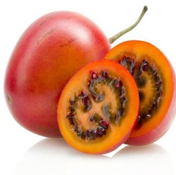
Slika 26. Tamarillo

sirov, ali zbog slatko – kiselog okusa svojih plodova popularan je za salate, variva, džemove, žele, sokove i kolače (kao nadjev).