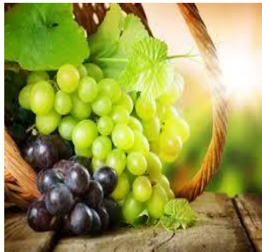
Slika 5. Grožđe – predstavnik bobičastog voća

Brusnice potječu iz Sjeverne Amerike i to su tvrde crvene bobice koja imaju kiselkasti okus. Brusnice postaju sve popularnije u prehrani zbog ljekovitih i antioksidativnih svojstava.