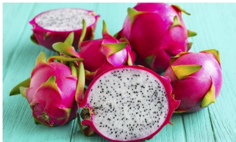
Slika 19. Pitahaya