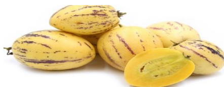
Slika 20. Pepino