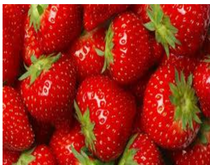
Slika 6. Vrgoračka jagoda – predstavnik jagodastog voća