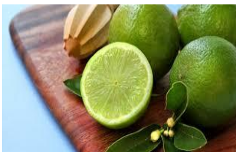
Slika 14. Limeta

Limeta ( Citrus aurantiifolia ) iz porodice rutvice ( Rutaceae ) raste u oblik malog drva ili visokog grma, visine do 5 metara s gustom okruglom krošnjom. Cvjetovi limete su elipsasti, dugi do 10 centimetara, s prozirnim točkama, a cvjetovi pojedinačni ili u skupinama, mirisni, promjera 3 do 4 centimetra. Sok plodova limete, a ponekad i ulje kore ploda ne koriste se samo za aromatiziranje brojnih jela i napitaka, već i u medicini. Od svih plodova citrusa, limeta se najčešće susreće u tropskim vrtovima. Sok limete mnogo je aromatičniji od soka limuna, a često se u vlažnim područjima tropa uzgaja i limunika, odnosno grejp. 32