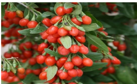
Slika 12. Goji