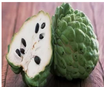
Slika 10. Cherimoja