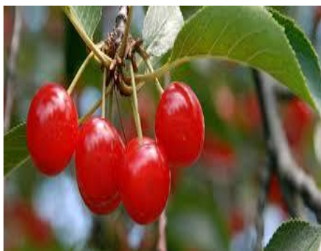
Slika 3. Višnja maraska – hrvatska autohtona vrsta

Najčešće konzumirano koštunjicavo voće je: šljive, višnje, trešnje, breskve, kajsije i marelice - ima ih raznih sorti. Plodovi im se sastoje od : kožice (ljuske), mesnatog usplođa i jedne koštice unutar koje se nalazi sjemenka. Koštunjicavo voće treba (po nazivu razlikovati) od orašastog – lupinastog ( nut ) voća jer je česta permutacija naziva.