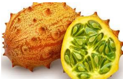
Slika 21. Kiwano

Kiwano je vrlo pogodan za uzgoj na otvorenom i daje izvrsne prinose u plastenicima.