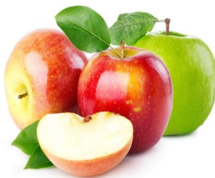
Slika 2. Jabuka - predstavnik jabučastog voća