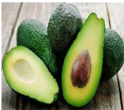
Slika 29. Avokado

Jede se uvijek sirov, i to odmah nakon skidanja kore jer brzo potamni. Često se koristi kao prilog jelima, posoljen i zaliven limunovim sokom ili maslinovim uljem. Može se napraviti i umak od avokada na način da se u sokovniku izmiješaju avokado , bijeli luk i razne začine.